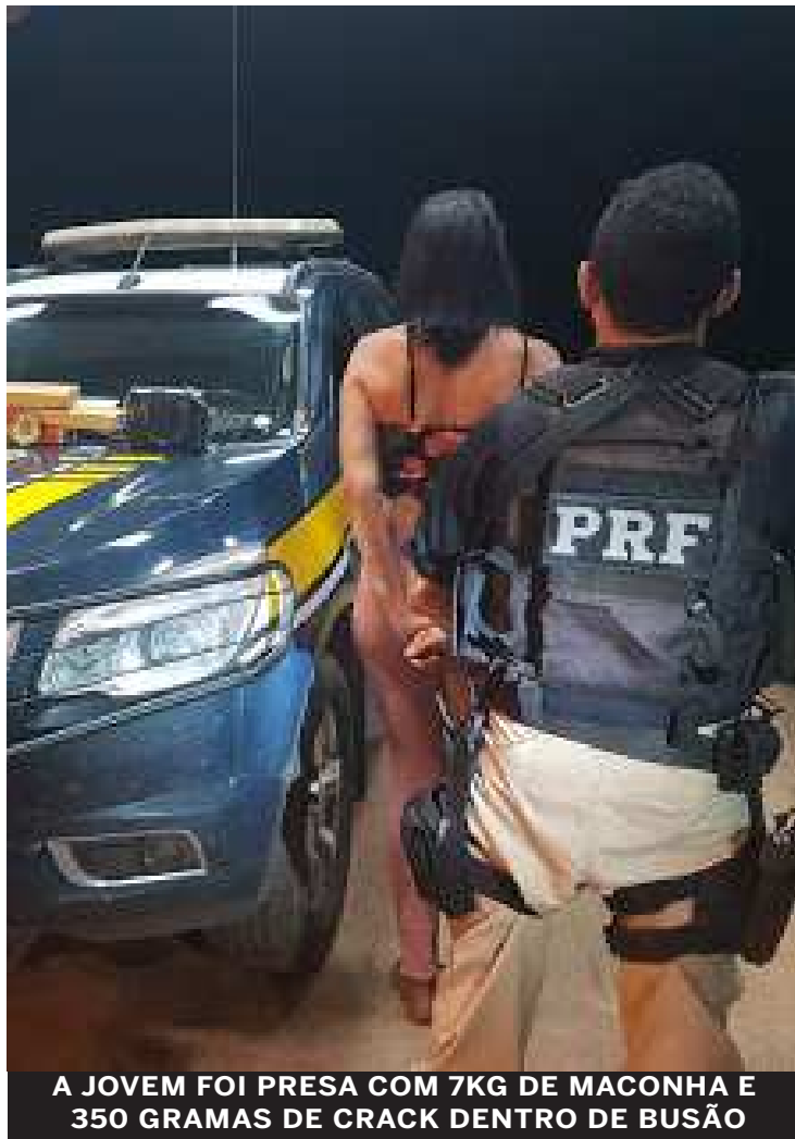
A JOVEM FOI PRESA COM 7KG DE MACONHA E 350 GRAMAS DE CRACK DENTRO DE BUSÃO

Diante das evidências, a jovem de 25 anos, e identidade não revelada, foi presa e conduzida para a Delegacia de Polícia Civil em Açailândia.