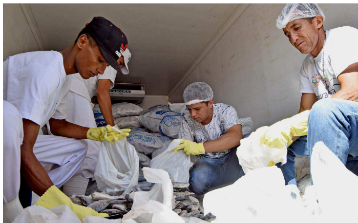
OS BAIRROS CONTEMPLADOS COM O PROGRAMA SÃO AQUELES CONSIDERADOS DE ALTO ÍNDICE DE INSEGURANÇA ALIMENTAR

Desde o dia 15 de março, quando foi realizada a primeira entrega do programa em 2018, já foram distribuídas mais de 142 toneladas de pescado, beneficiando aproximadamente 71.110 famílias, em mais de 40 bairros da cidade. Com a ação, executada pela Secretaria Municipal de Segurança Alimentar (Semsa), a meta do poder público municipal é alcançar todas as