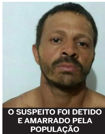
O SUSPEITO FOI DETIDO E AMARRADO PELA POPULAÇÃO

A guarnição foi ao local, onde constatou a veracidade da informação. O telhado da residência estava quebrado. Diante dos fatos, o suspeito foi conduzido e apresentado na Delegacia na cidade de Bacabaeira.