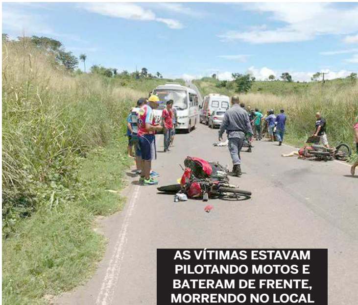
AS VÍTIMAS ESTAVAM PILOTANDO MOTOS E BATERAM DE FRENTE, MORRENDO NO LOCAL

Uma terceira pessoa ficou ferida e foi socorrida. Os corpos dos mortos foram levados para o Instituto Médico Legal (IML) de Imperatriz.