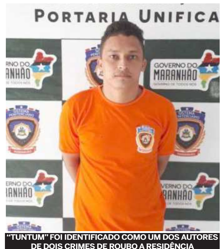
“TUNTUM” FOI IDENTIFICADO COMO UM DOS AUTORES DE DOIS CRIMES DE ROUBO A RESIDÊNCIA