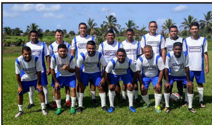
A EQUIPE DO RR BIKE EM BUSCA DO TÍTULO DO VI CAMPEONATO SOCIETY DA CIDADE OPERÁRIA