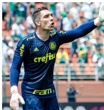
FOTO - PRASS PALMEIRAS: – Fernando Prass (goleiro) – Jailson (goleiro) – Vagner (goleiro) – Edu Dracena (zagueiro)

Falta de dinheiro não pode ser desculpa para o dirigente do seu time não contratar reforços para 2019. Duvida? Fizemos um levantamento com os 20 times da Série A e descobriu mais de 60 atletas cujos contratos terminam em dezembro – o único clube sem ninguém livre é o Cruzeiro. A relação abaixo conta apenas com jogadores que ficarão desempregados. Alguns nomes são bem interessantes e poderiam atuar como titulares em vários clubes do país, como Leandro Damiano, Robson Bambu, Fernando Prass, Jailson, Edu Dracena, Marcos Júnior, Cícero, Jael, Léo Moura, João Ricardo, Lucho Gonzalez... Outros, veteranos, devem se aposentar, como o corinthiano Emerson Sheik, o santista Renato e o rubro-negro Juan.