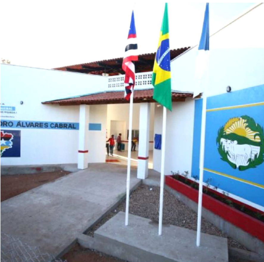
NO TOTAL, SÃO MAIS DE 115 REFORMAS E CONSTRUÇÕES NO ESTADO

Investir em educação tem sido uma das marcas do Governo Flávio Dino em todas as regiões maranhenses. A implantação de projetos como o Escola Digna, Instituto de Educação, Ciência e Tecnologia do Maranhão (Iema), Núcleo de Educação e a construção de novas escolas de ensino regulares nos municípios, tem dado um salto positivo no mapa da educação no Estado.