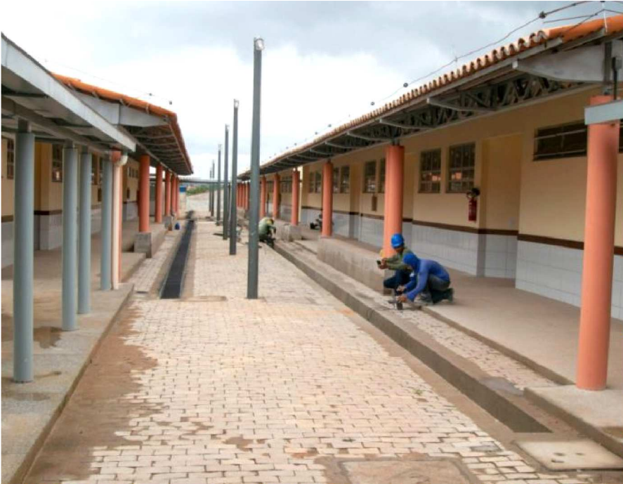
GOVERNO DO MARANHÃO INVESTIU MAIS DE R$ 312 MILHÕES EM OBRAS

Maranhão possui mais de 100 obras educacionais em andamento