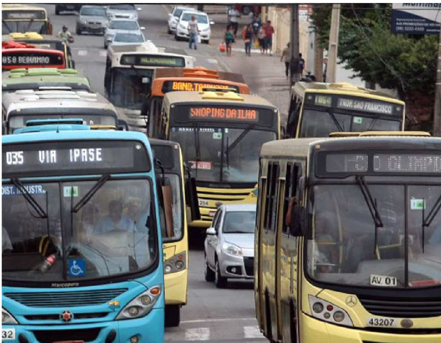
RODOVIÁRIOS VÃO DEFINIR PARALISAÇÃO EM ASSEMBLEIA NESTA QUARTA

Reunião dos Rodoviários pode definir se a categoria entra ou não em greve na próxima semana