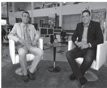
Sala de Entrevista

A Assembleia Legislativa, por determinação do presidente Othelino Neto (PCdoB), realizará, nesta terça-feira (8), seu primeiro Pregão Eletrônico, que visa à aquisição de bens e serviços de forma mais célere e transparente. A modalidade de licitação acontecerá às 15h, no Auditório Neiva Moreira do Complexo de Comunicação, tendo como objeto a compra de material de informática. O Pregão Eletrônico materializa o que de mais moderno existe em se tratando de contratação pública, conferindo maior celeridade e a almejada desburocratização do procedimento licitatório.