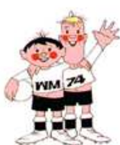
Tip e Tap Alemanha 1974