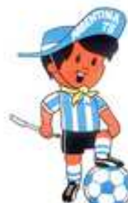
Gauchito Argentina 1978