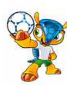
Fuleco Brasil 2014