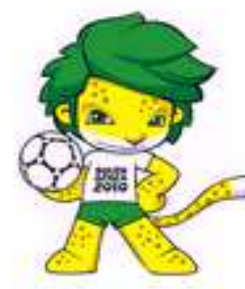
Zakumi África do Sul 2010