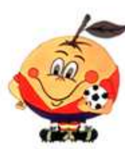
Naranjito Espanha 1982