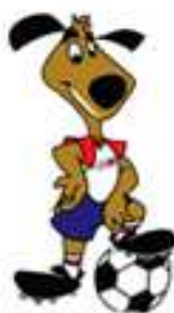
Striker Estados Unidos 1994