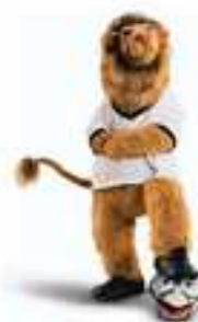
Goleo Alemanha 2006