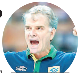
O técnico de vôlei e empresário Bernardo Rezende, nome confirmado para a superpalestra de abertura da Semana do Mercado Financeiro, promovida pela Liga Mestra da UNDB

A Semana terá uma ampla programação de debates e palestras, com a participação de alunos e docentes dos cursos de Administração, Ciências Contábeis e Direito da UNDB. E confirmados para a palestra magna de abertura no dia 19 deste mês, às 17h, dois nomes de impacto: O empresário e ex-técnico da Seleção Brasileira de Vôlei Bernardo Rezende, o Bernardinho, e o economista, administrador de empresas e executivo do mercado financeiro João Amoedo (RJ). Eles vão falar sobre o atual cenário da gestão contemporânea, a importância da liderança e as tendências do mercado financeiro. Apesar de promovido pela UNDB, o evento é de extensão e, portanto, gratuito e aberto ao público interessado, mas com necessidade de inscrição prévia, que pode ser feita através do site www.undb.edu.br .