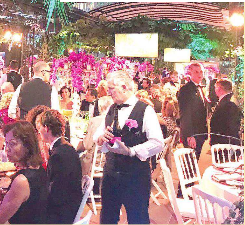
Roberb foi destaque e leilou uma de suas belas obras de arte