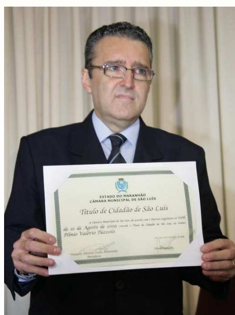
Com o título de Cidadão Ludovicense, do qual muito se orgulha

Frase: "A felicidade está no interior das pessoas e não no mundo exterior."