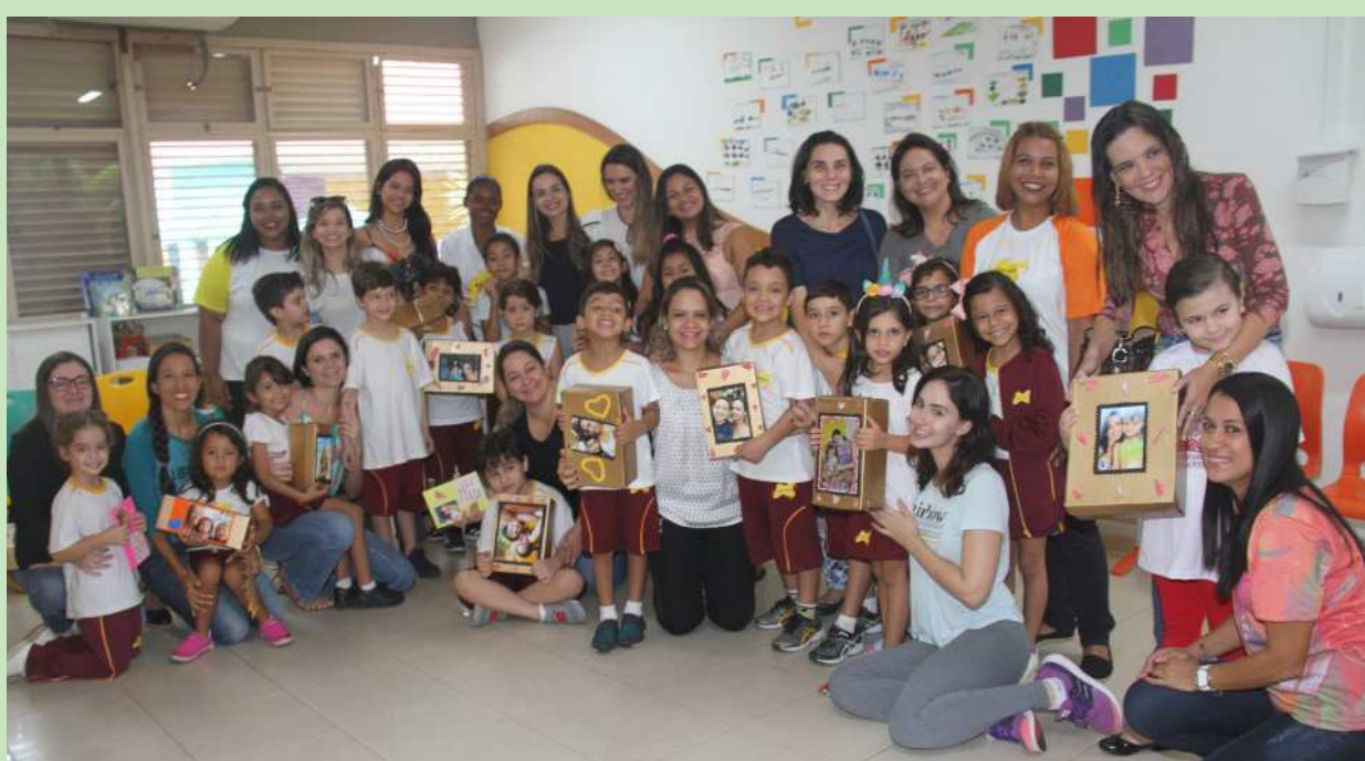
Grupo de alunos homenageando suas mães no Dom Bosco