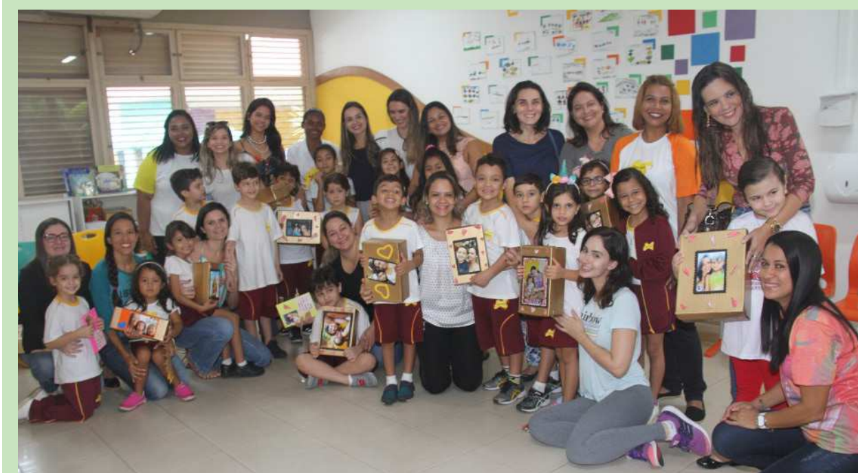
Grupo de alunos homenageando suas mães no Dom Bosco