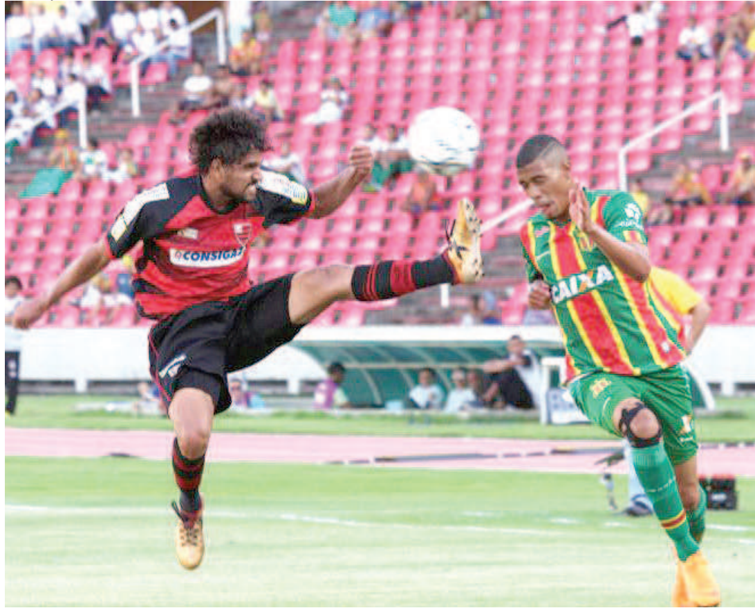
Sampaio quer repetir a boa atuação que teve no último jogo disputado no Castelão e derrotar o ABC