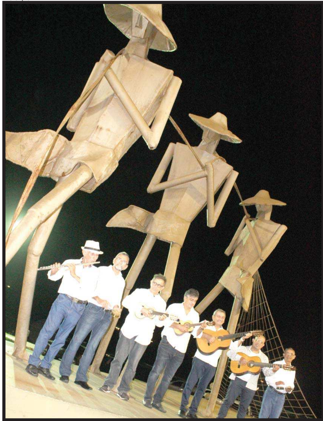
Arte inspirada na obra O Arrastão , de Cordeiro do Maranhão, numa alusão ao chorão que pesca do fundo do baú as melodias