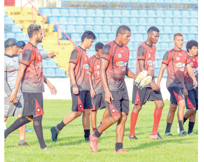
Moto retorna aos treinamentos e vai tentar eliminar o Imperatriz