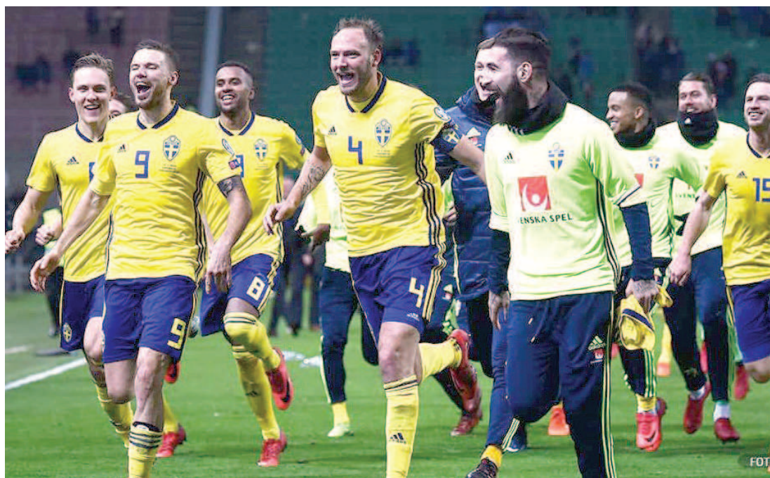
Jogadores suecos terminaram a fase de grupos em primeiro lugar e foram a grata surpresa da chave

Suécia e Suíça fazem um confronto totalmente imprevisível hoje, a partir das 11h (horário de Brasília), pelas oitavas de final da Copa do Mundo. O jogo ocorre na Arena Zenit, em São Petersburgo, e quem vencer pegará nas quartas de final o ganhador de Colômbia e Inglaterra. Os suecos terminaram a primeira fase no primeiro lugar do Grupo F, que tinha a poderosa Alemanha. Agora o objetivo é passar das oitavas de final pela primeira vez desde 1994, quando ficaram em terceiro lugar. Desde então, os nórdicos disputaram o Mundial em 2002 e 2006, mas ambas as vezes caíram nas oitavas de final.