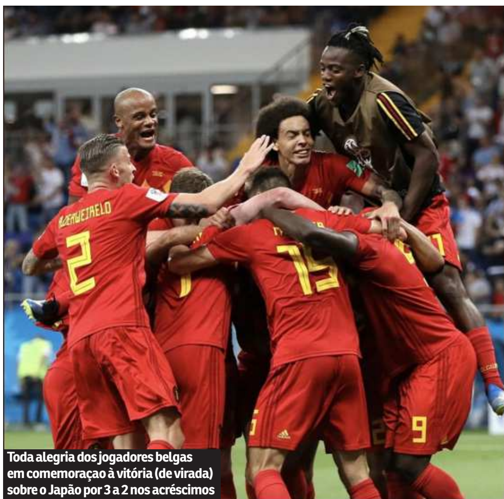
Toda alegria dos jogadores belgas em comemoração à vitória (de virada) sobre o Japão por 3 a 2 nos acréscimos

Com o porte físico e a vontade de um touro, ele tentou de todos os jeitos. O bom sis-