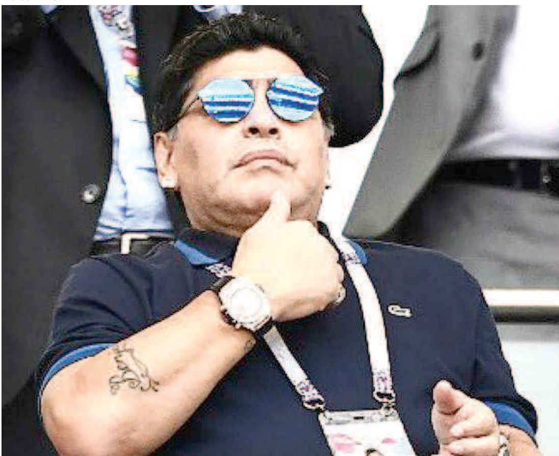
Maradona pediu respaldo a jovens jogadores que passarão a integrar o time da Argentina futuramente