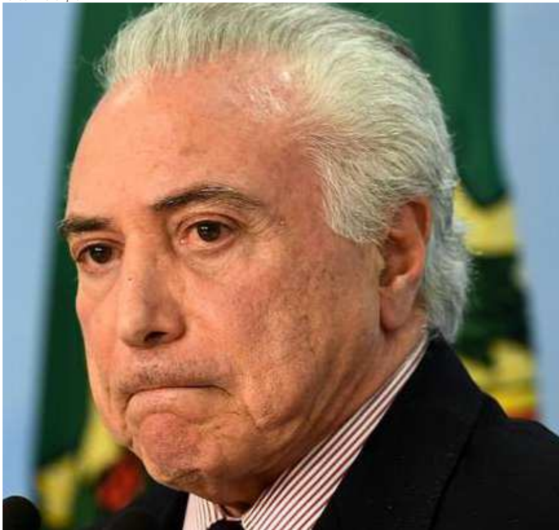
O governo de Michel Temer, segundo os relatores da ONU, tem falhado em relação aos Direitos Humanos