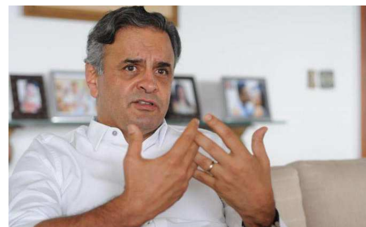
Gilmar arquivou a investigação do senador Aécio Neves no fim de junho

Para além do andamento do caso, a PGR critica diretamente o entendimento do ministro Gilmar Mendes de que se pode arquivar um caso sem que tenha havido pedido do Ministério Público Federal. Raquel Dodge disse que o próprio STF descartou essa possibilidade em julgamento em 2014, com a maioria dos ministros, mesmo existindo previsão no Regimento Interno da Corte.