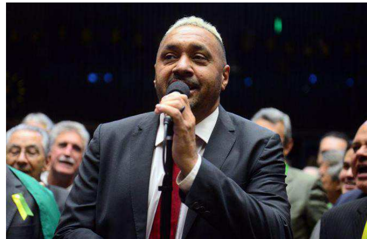
Depois de anunciar que não seria mais candidato, Tiririca voltou atrás