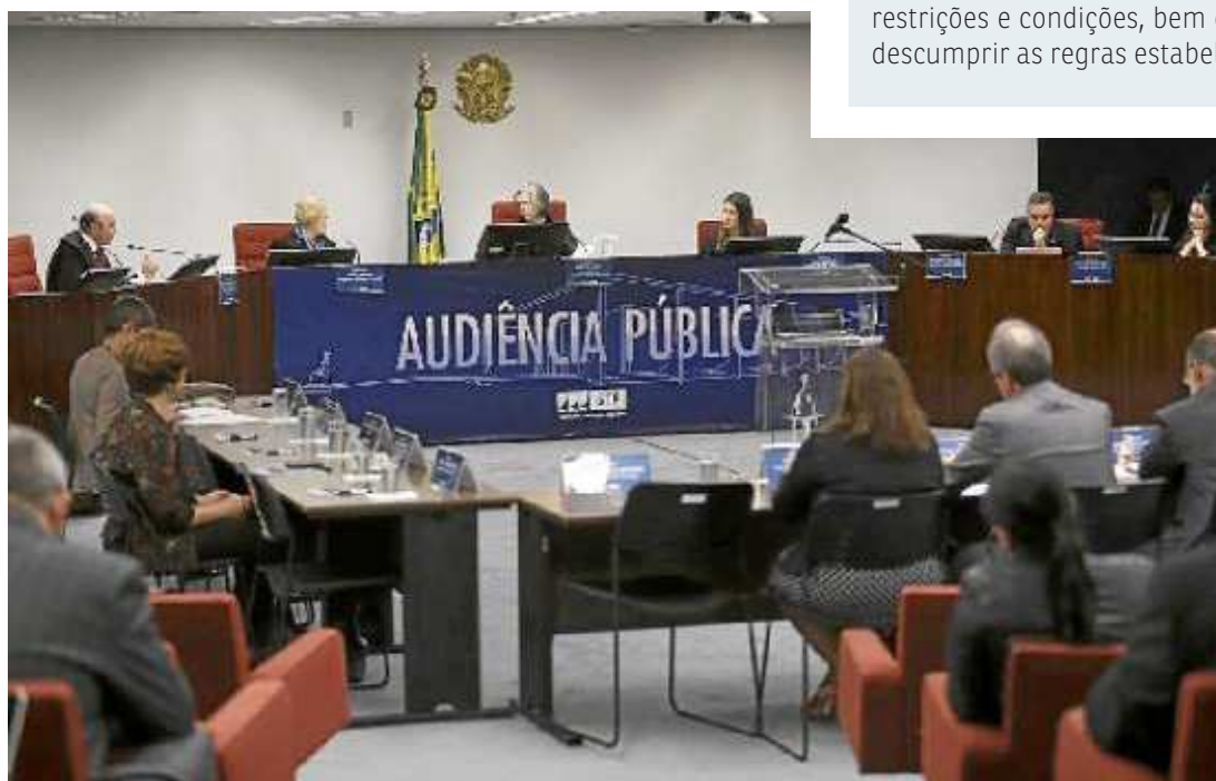
As discussões sobre as questões envolvendo o aborto estarão de volta hoje à Suprema Corte em Brasília

As audiências públicas que ocorrem no STF discutem o pedido de Arguição de Descumprimento de Preceito Fundamental (ADPF) nº 442, ajuizado pelo PSol em parceria com o Instituto Anís, que pede a descriminalização até a 12ª semana de gestação. Atualmente, no Brasil, os artigos 124 e 126 do Código Penal criminalizam a prática — exceto em caso de risco de vida da mãe, estupro e feto anencéfalo, que o próprio STF incluiu em 2012. A audiência segue hoje.