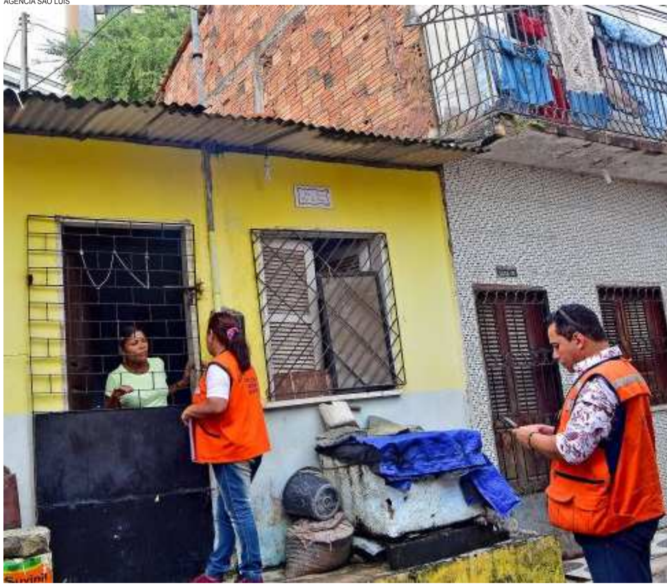
Agentes da Defesa Civil percorrem casas e orientam população sobre os perigos de permanecer em locais apontados como de risco

Estamos em alerta sempre, e com a intensidade de chuvas ou outro componente que possa causar riscos a essas pessoas, intensificamos os trabalhos