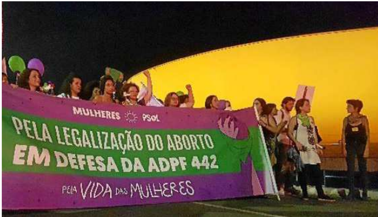
Juristas, profissionais de saúde, professores e representantes de ONGs estão entre os participantes da audiência pública: 20 minutos para expor opiniões