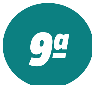
Posição em que se encontra o Guarani

Após a derrota para o Fortaleza, o Guarani estacionou nos 29 pontos e caiu para a nona colocação. A diferença para a Ponte Preta, primeira do G4 e que já jogou pela 21ª rodada, é de apenas três pontos.