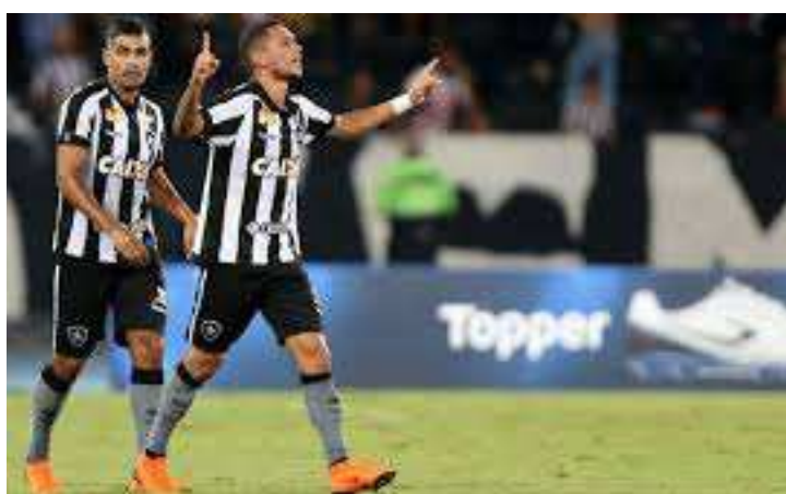
Torcida promete empurrar o Alvinegro para conquista de grande vitória