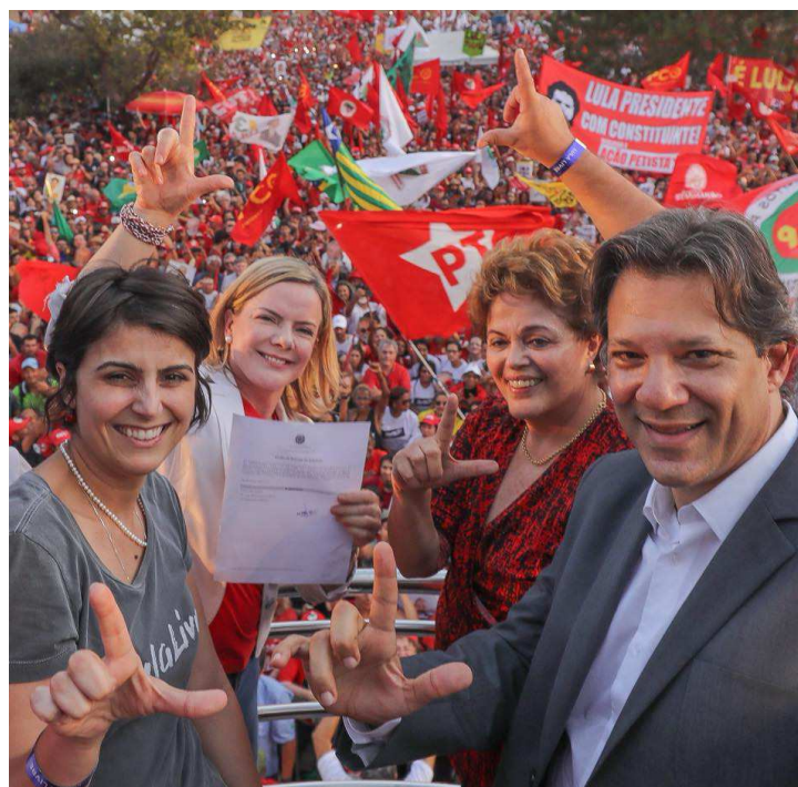
O registro foi apresentado por representantes do PT, já que Lula está preso na PF de Curitiba