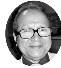
AURELIANO NETO MEMBRO DA AML E AIL

Patrono da cadeira n.º 9 da Academia Maranhense de Letras – AML. E, por escolha do fundador, o poeta Olavo Bilac, é o patrono da cadeira n.º 15 da Academia Brasileira de Letras - ABL.