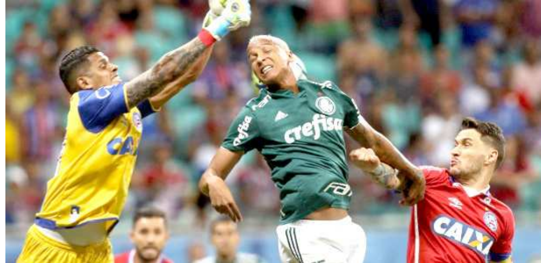
Time de Felipão é favorito diante do tricolor baiano no jogo de hoje, às 19h15, no Estádio Pacaembu

momento. A equipe atravessa um momento favorável, já não leva gols há cinco jogos, e sob o comando de Scolari contabiliza duas vitórias, contra Cerro Porteño (2 a 0) e Vasco (1 a 0), e um empate, diante do América-MG (0 a 0).