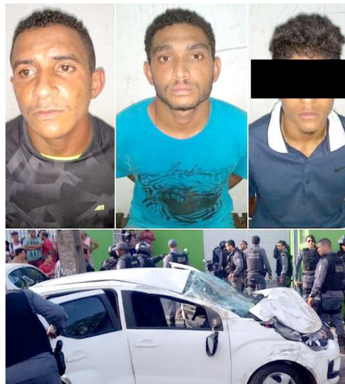
Os três bandidos capotaram o carro e foram presos pela PM