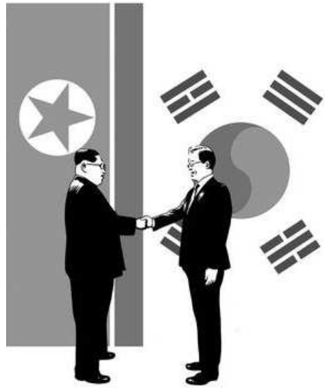
CHAN WOO KIM EMBAIXADOR DA REPÚBLICA DA COREIA NO BRASIL

A Coreia do Sul soma um território de aproximadamente 100 mil Km² e uma população em torno de 50 milhões de habitantes, dimensões de país pequeno. Por outro lado, com base em dados de 2017, o país está ranqueado em 12º lugar no mundo em valores de PIB, sendo que o PIB per capita gira em torno de 30 mil dólares. Além disso, o país é membro do Organização para Cooperação e Desenvolvimento Econômico (OCDE), e do G20, grupo que se reúne permanentemente para discutir as diretrizes da economia global. Ainda, a Coreia do Sul mantém acordos de livre comércio com 52 países e, em maio passado, fez o lançamento da abertura de negociações de comércio com o Mercosul.