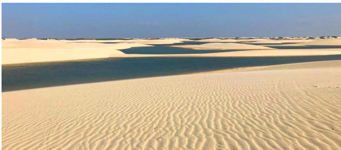
O céu colorido registra a presença dos kitesurfistas nas belas praias de Atins nesta época do ano

P ela dificuldade de acesso, paraísos perdidos como Atins ficaram escondidos por muitos anos. Agora, atletas da modalidade kitesurf ocupam o vilarejo e estão movimentando o turismo, gastronomia e hotelaria.