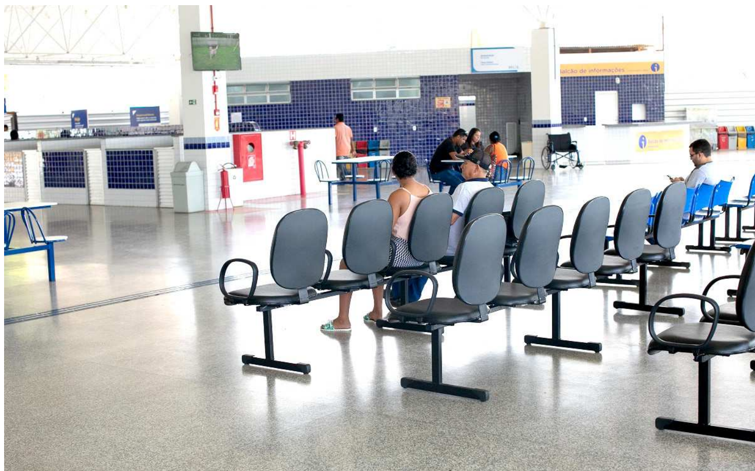
O treinamento integra o Programa de Capacitação que vem sendo realizado pela Empresa Maranhense de Administração Portuária