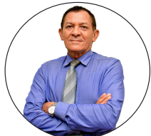
POR RAIMUNDO BORGES DIRETOR DE REDAÇÃO

O secretário municipal da Fazenda diz que está chamando os contribuintes a pagarem o que devem, negociando. Quem não pagar vai ater-se com a Serasa ou com a Justiça