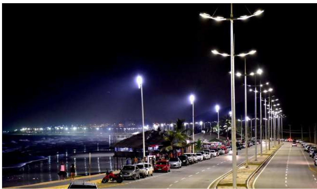
A cidade já recebeu mais de 15 mil pontos de luz branca. A meta é alcançar 80 mil pontos até o fim de 2020

Na BR-135 equipes trabalham na instalação de cabos do posteamento. Os trabalhos na área estão avançando e prosseguem ao longo da semana com a implantação de aproximadamente 900 metros de cabos para ligação dos postes. Outras áreas