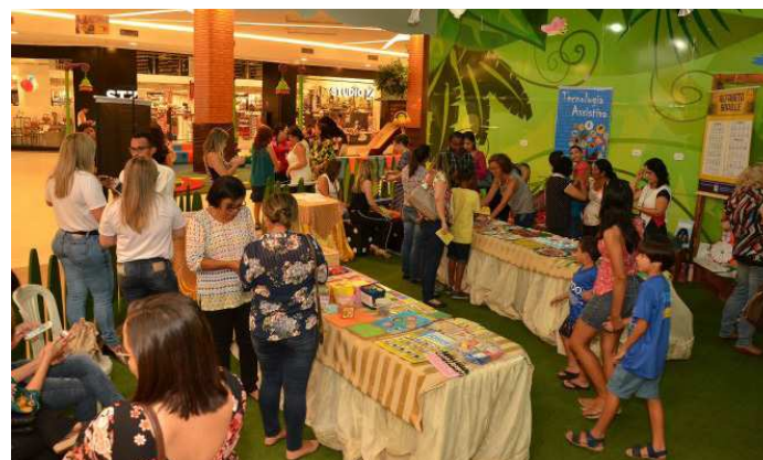
Recursos foram apresentados aos frequentadores do Rio Anil Shopping

A mostra integra uma programação organizada em alusão ao Dia da Luta da Pessoa com Deficiência. Dia 26, haverá uma mesa-redonda sobre os Desafios do Ensino de Língua Portuguesa para Surdos.