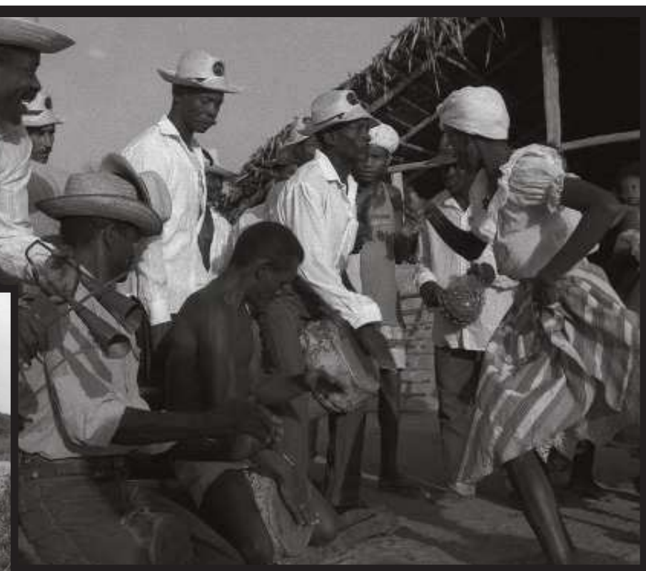
Cotidiano dos quilombolas e seus costumes foram registrados, e o Tambor de Crioula de Frechal foi captado pela belga Christine Leidgens

Comunidade remanescente de descendentes de escravos que lutaram pelo direito à posse das terras que eram de seus antepassados, o Quilombo de Frechal celebra seus 226 anos com uma grande programação cultural. IMPAR