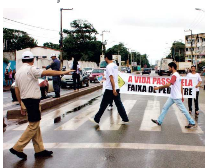
Agentes de trânsito orientam sobre o uso da faixa de pedestres