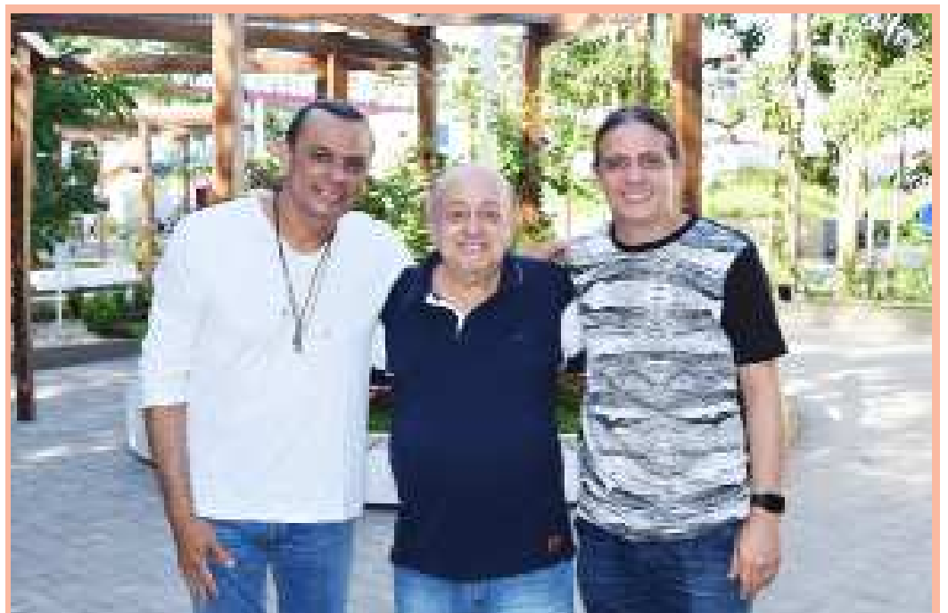
O cantor, compositor e instrumentista piauiense Frank Aguiar, ídolo absoluto do forró, ficou encantado com o Mirante da Balaia, mais novo cartão postal de Caxias. Frank é visto na foto ao lado do prefeito Fábio Gentil e do candidato a deputado estadual Zé Gentil