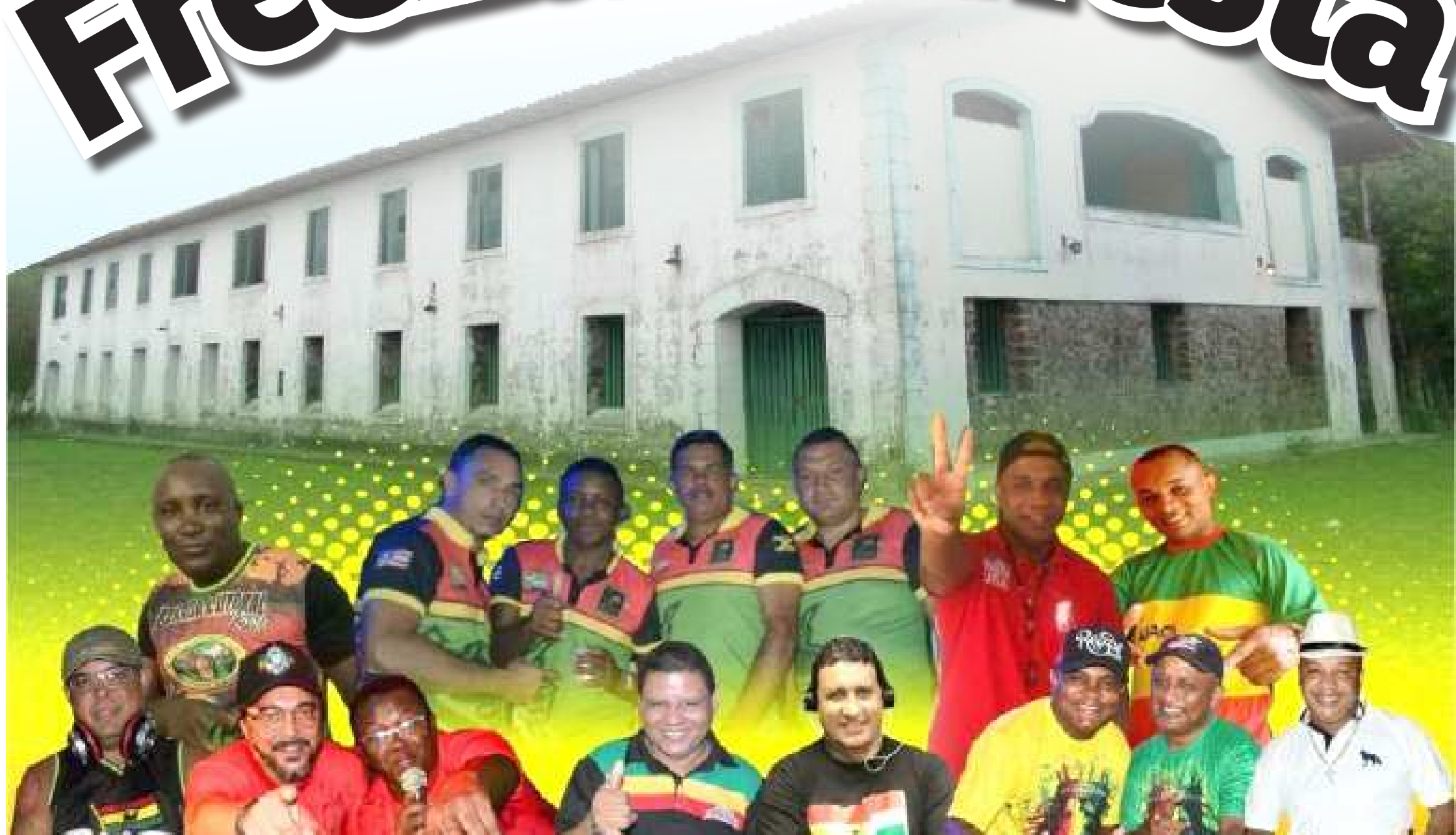
Festejo de São Benedito em Frechal com a presença de DJs de São Luís e da Baixada Maranhense marca as comemorações dos 226 anos de fundação da comunidade e os 33 anos da Associação de Moradores de Frechal

Comunidade remanescente de descendentes de escravos que lutaram pelo direito à posse das terras que eram de seus antepassados, o Quilombo de Frechal celebra seus 226 anos com uma grande programação cultural