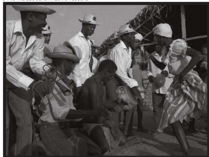
Tambor de Crioula de Frechal foi captado pela belga Christine Leidgens