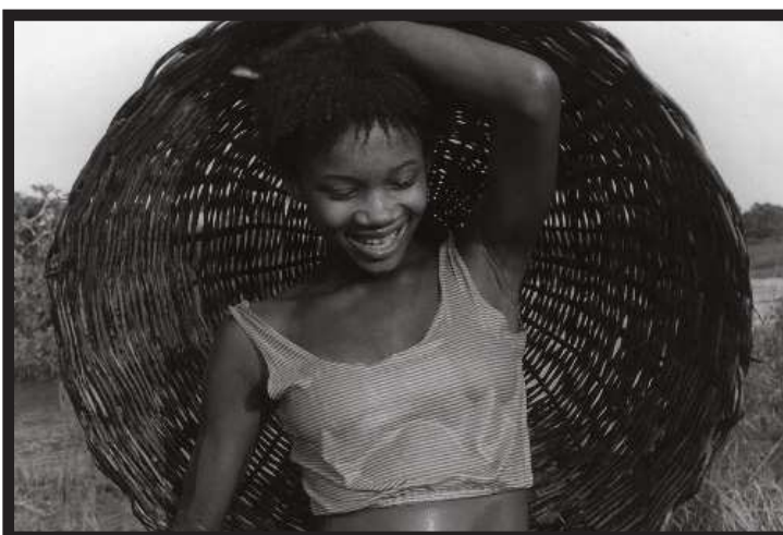
Cotidiano dos quilombolas e seus costumes foram registrados em fotos