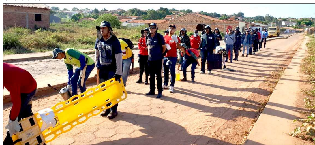
Os trabalhos preventivos estão sendo realizados com brigadistas em fazendas, comunidades agricultoras e indígenas