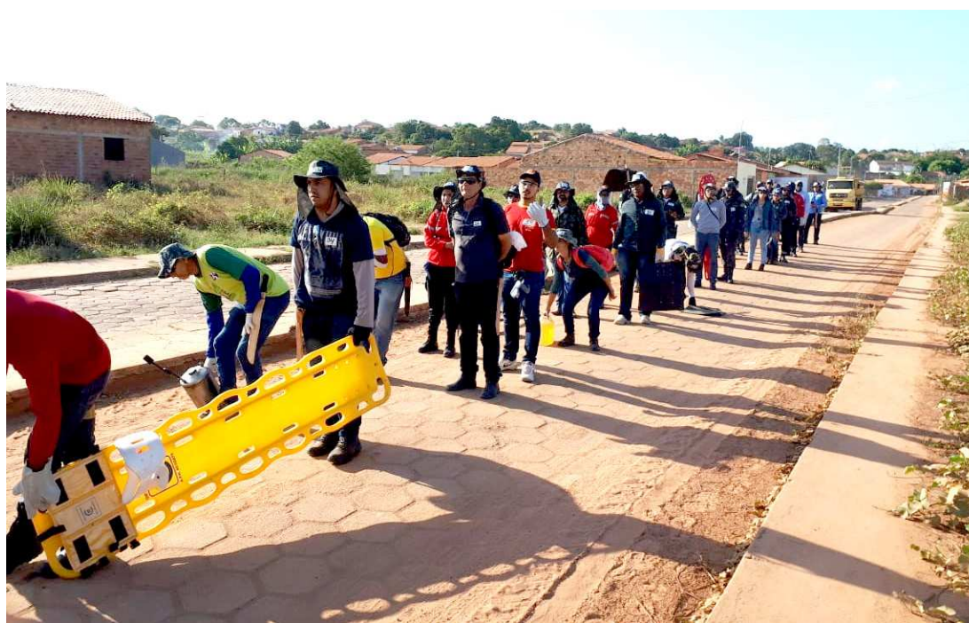
São realizados trabalhos preventivos com brigadistas em fazendas, comunidades agricultoras e indígenas

As principais causas são a estiagem e queimadas sem orientação. O segundo semestre do ano é o período mais crítico, segundo a Coordenadoria Estadual de Proteção e Defesa Civil do Corpo de Bombeiros. Isso, devido às características