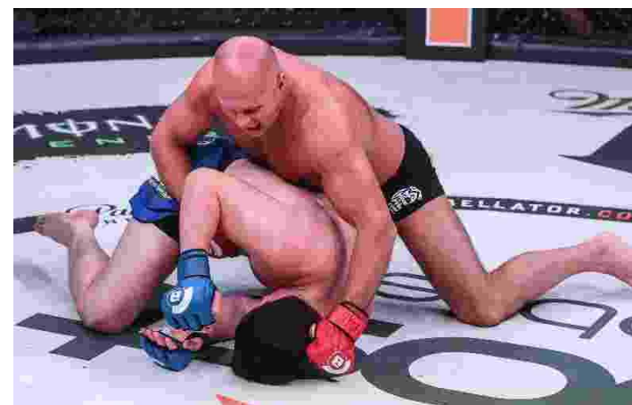
FEDOR APLICOU CERTEIROS GOLPES E NOCAUTEOU SONNEN

Chael Sonnen entrou na arena circular do Bellator no último sábado (13) com a difícil missão de bater a lenda russa Fedor Emelianenko nas semifinais do GP peso-pesado da organização, mas não obteve êxito e acabou nocautado ainda no primeiro round de luta.