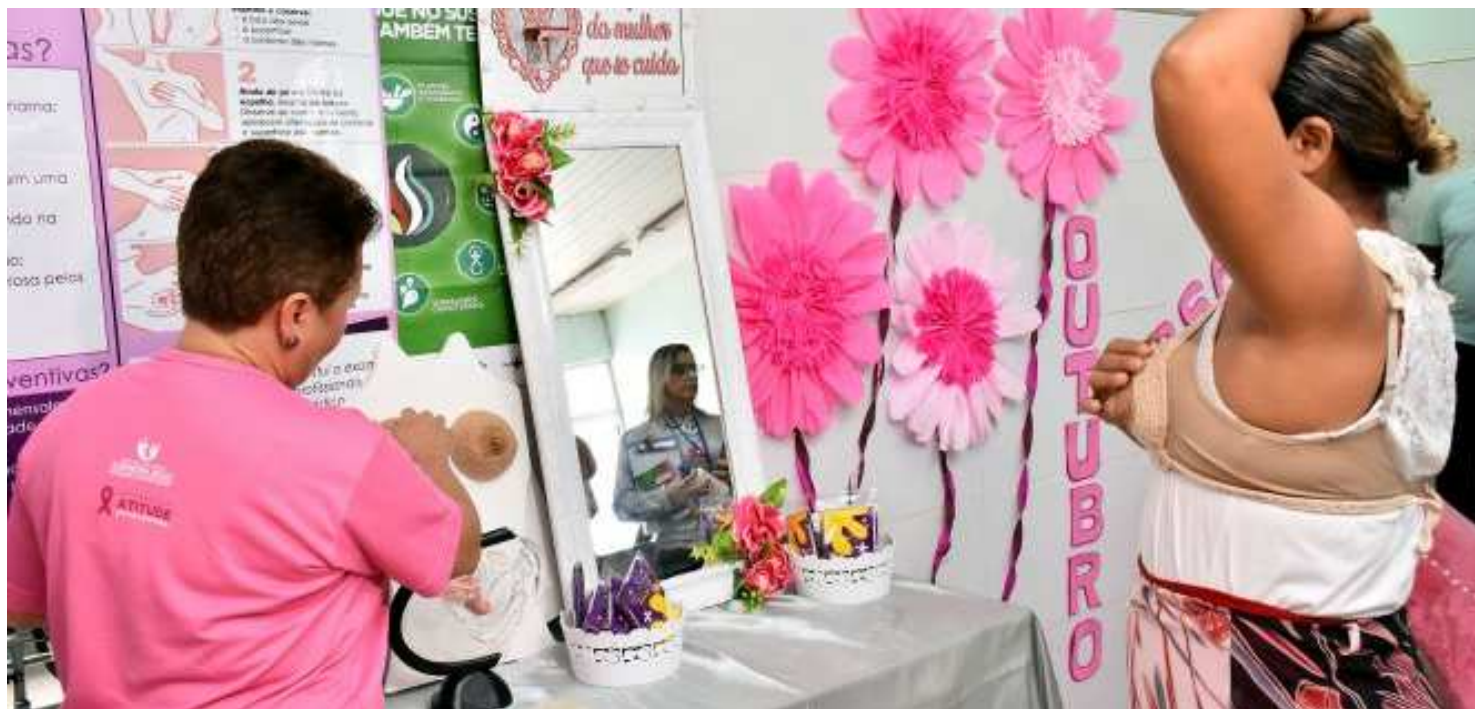
Durante o mutirão no Residencial Paraíso, realizado das 8h às 16h, foram ofertadas às mulheres palestras educativas sobre o câncer de mama

Como parte das atividades alusivas ao Outubro Rosa, a Prefeitura de São Luís realizou, nesta segunda-feira (15), um mutirão de ações preventivas de saúde voltado às mulheres no Centro de Saúde do Residencial Paraíso, na região Itaquí-Bacanga. A iniciativa tem como objetivo intensificar as ações preventivas contra o câncer de mama – mote da campanha – e levar às mulheres da comunidade orientações sobre o problema e incentivá-las a buscar o diagnóstico precoce. O mutirão, que acontecerá também em outras unidades de saúde, tem a coordenação da Secretaria Municipal de Saúde (Semus) e segue orientação do prefeito Edivaldo.