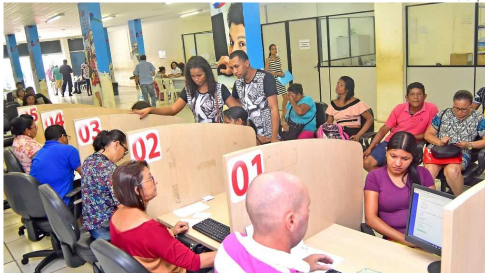
Residenciais Morada do Sol I e II contam com um total 2.176 casas com 42,87 m² de área

Para contemplação final do imóvel, é obrigatório às pessoas sorteadas comprovar as condições especificadas no cadastro, por meio de documentação comprobatória, quando convocado após divulgação das listagens de selecionados. Os documentos devem ser entregues das 8h às 16h, na