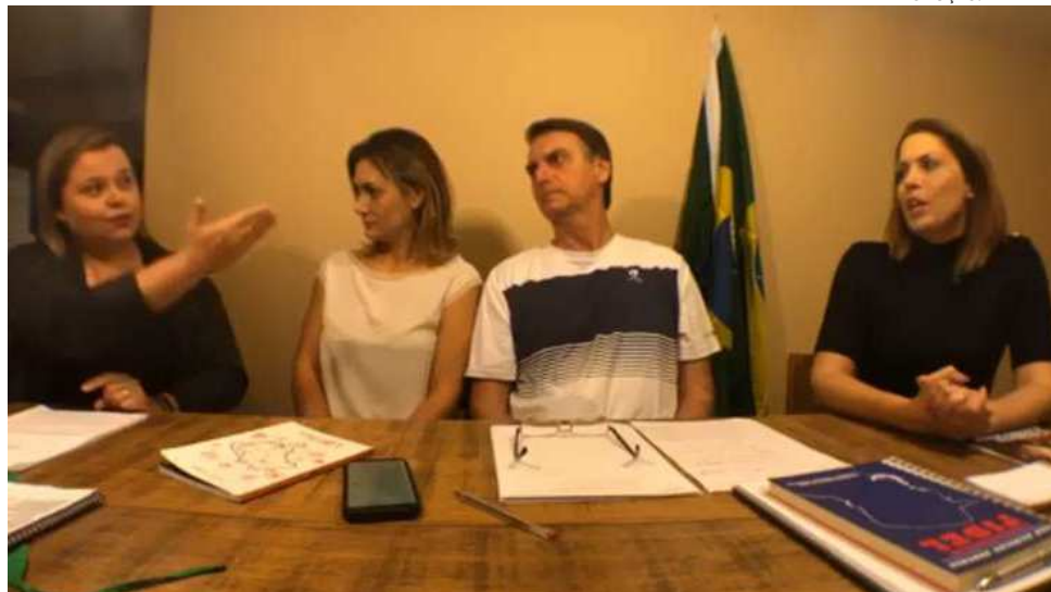
Bolsonaro afirma que vai incluir pessoas com deficiência, mas não fala sobre propostas (foto):

Segundo o candidato, “o Estado não tem nada a ver com isso”. “Votamos contra a inclusão, pela deformação do projeto, que criava uma classe especial entre aqueles com proble-