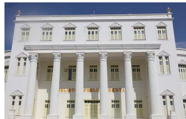
Programação cultural foi realizada pela Biblioteca Benedito Leite

A Biblioteca Pública Benedito Leite (BPBL) tem uma agenda cheia de atividades neste mês de outubro, com ações diversificadas. Evento literário, mês das crianças e participação em feiras estão na programação, que acontece na capital e no interior do estado.