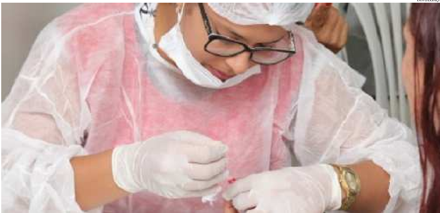
Profissional faz aplicação de testagem rápida, um dos exames para detecção de sífilis, que avança no país e pode ser contraída de três formas

Dedicado à prevenção sobre o câncer de mama, o mês de outubro também será voltado para combater o avanço da sífilis, uma infecção sexualmente transmissível (IST) curável e exclusiva do ser humano.