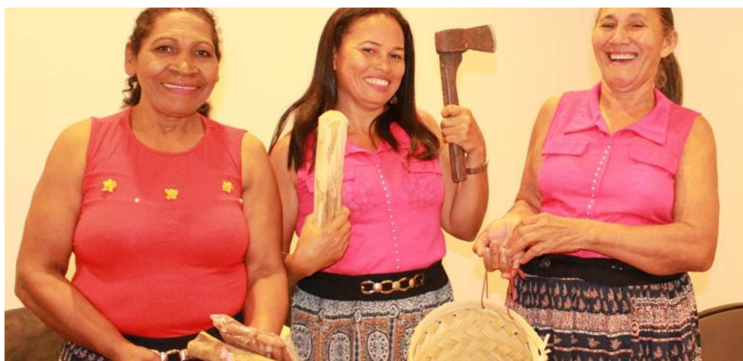
Encantadeiras do Movimento Interestadual das Quebradeiras de Coco Babaçu mostraram a riqueza de seu trabalho por meio do canto

A arte de cantar acompanha as quebradeiras de coco babaçu desde muito cedo. Acompanhada pelas avós, mães, tias, essas mulheres aprendem desde criança que as canções são uma maneira de expressar luta e resistência de um modo de vida tradicional como a quebra do coco babaçu. Em apresentação no Museu do Amanhã (RJ) na última semana, as vozes das Encantadeiras do Movimento Interestadual das Quebradeiras de Coco Babaçu (MIQCB) ecoaram e posicionaram sobre a necessidade do reconhecimento à cultura do babaçu, à valorização do trabalho da mulher, à conquista pelo acesso livre ao território e a necessidade de preservação dos babaçuais.