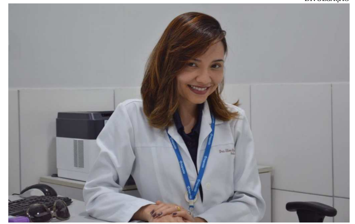
Médica destaca desconhecimento e a falta de acesso a serviços