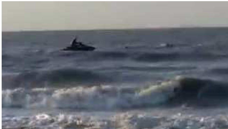
Bombeiros resgatam três banhistas que estavam se afogando