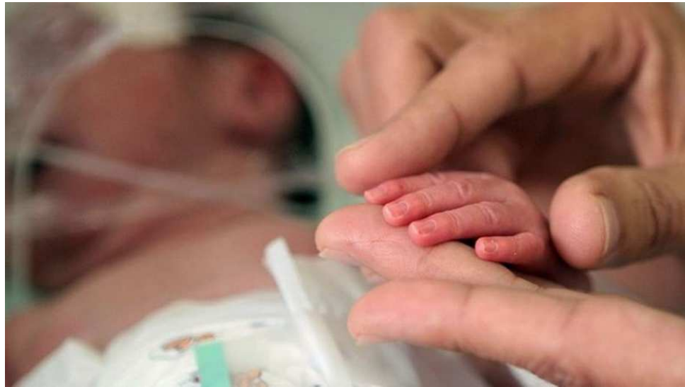
Uma gravidez acompanhada desde o início reduz as chances de mortalidade infantil

A Jornada de Pediatria oferece apostila com manuais da Sociedade Brasileira de Pediatria, da Academy of