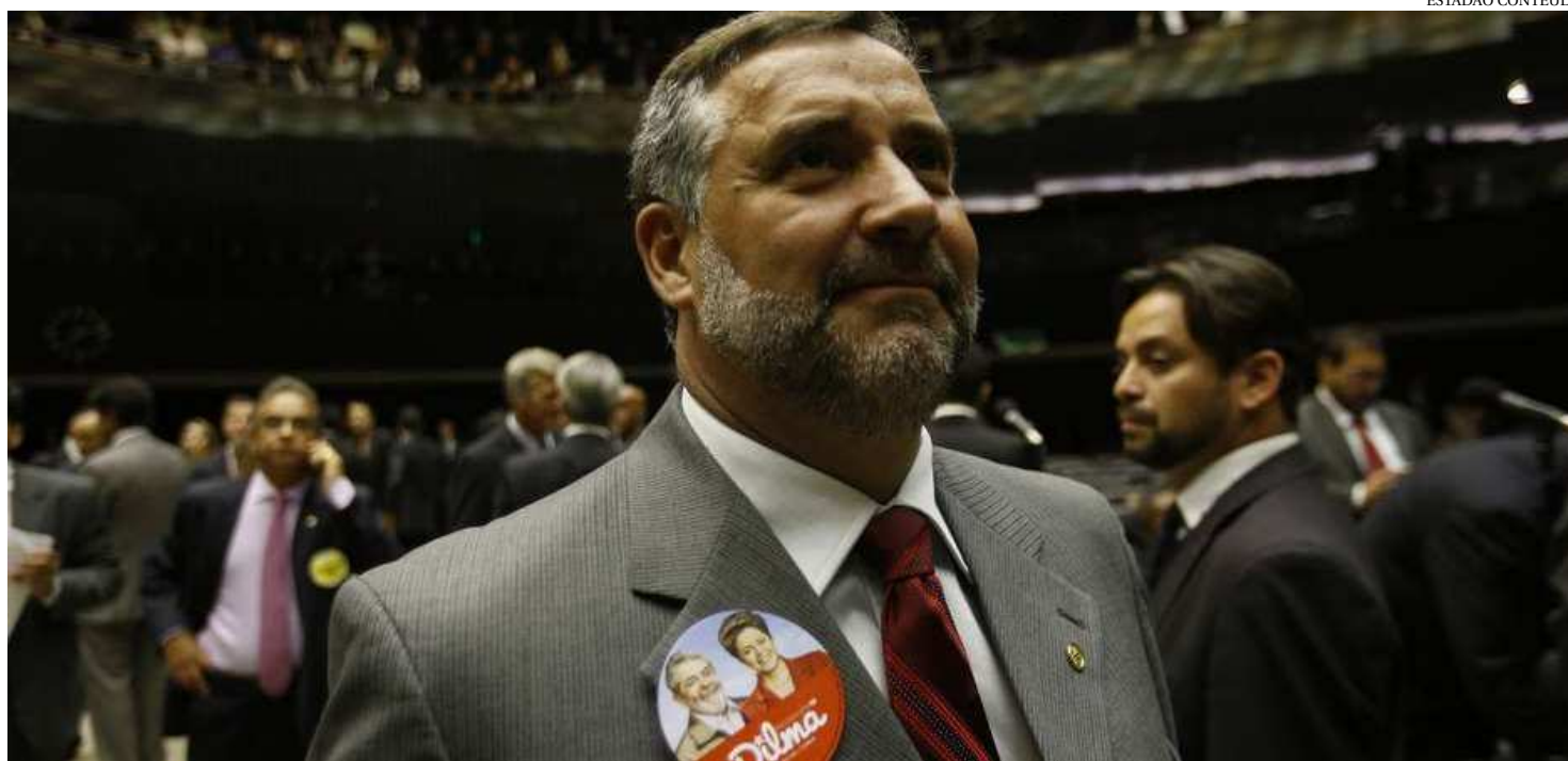
O líder do Partido dos Trabalhadores na Câmara, deputado Paulo Pimenta (RS)

O líder do PT na Câmara dos Deputados, Paulo Pimenta, ironizou nesta segunda-feira o que chamou de “atestado fake” do candidato do PSL à Presidência, Jair Bolsonaro, para não participar dos debates presidenciais com Fernando Haddad (PT).