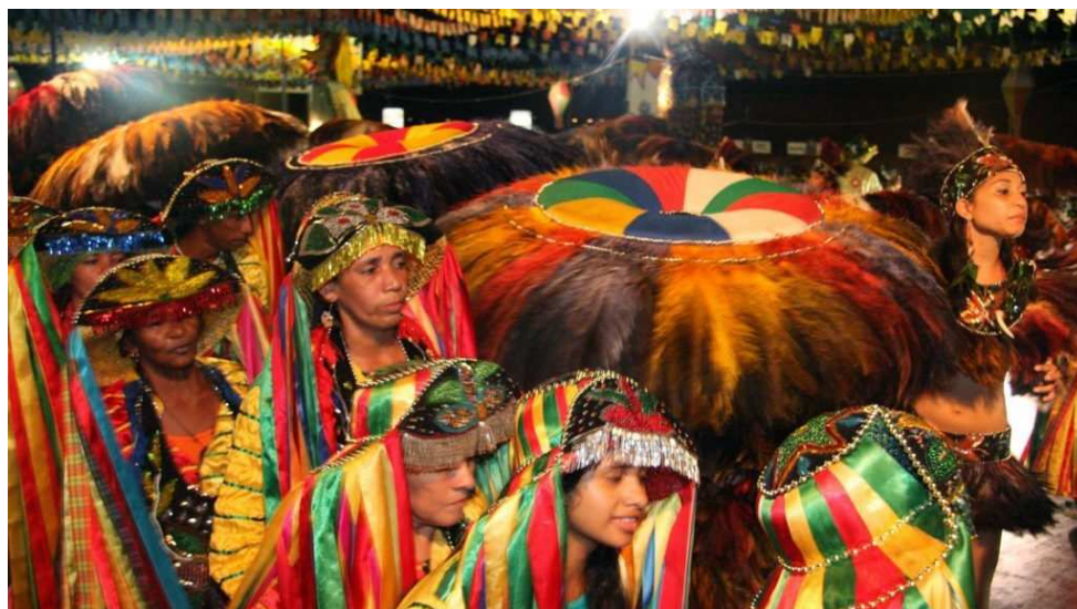
Gravações acompanham toda a temporada junina e outros momentos do ciclo da brincadeira

Os registros de Guriatã foram realizados ao longo de vários anos, retratam a personalidade multifacetada e a excepcional obra musical dessa personalidade, que liderou por mais de