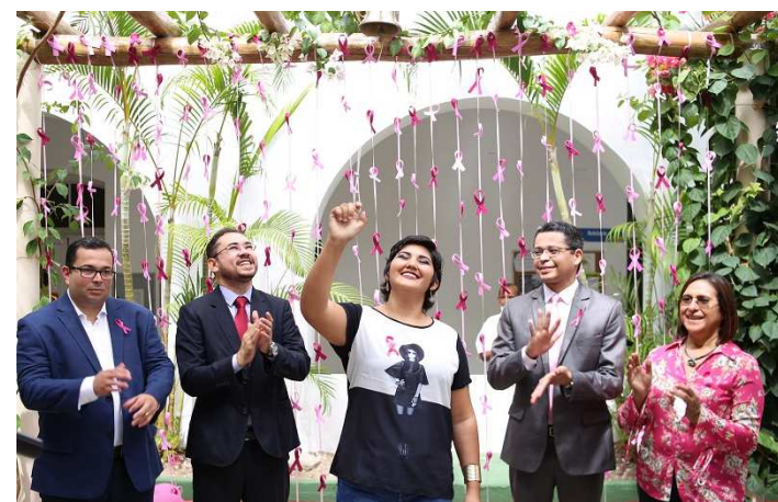
O Governo do Estado realizou o Dia D da campanha Outubro Rosa

O Governo do Estado realizou o Dia D da campanha Outubro Rosa, nesta segunda-feira (15), no Hospital de Câncer do Maranhão. A ação se dedica a compartilhar informações sobre o câncer de mama e promover a prevenção. A programação incluiu bate-papo e um ato simbólico de vitória, quando paciente tratada no hospital tocou o sino da cura.