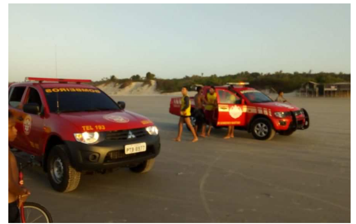
Equipe do Batalhão de Bombeiros Marítimo em ação de resgate

No último sábado, o Batalhão de Bombeiros Marítimos (BBMar) foi acionado pelo Centro Integrado de Operações de Segurança do Maranhão (Ciops) para atender uma ocorrência de resgate de vítimas no mar, na Praia do Araçagi.