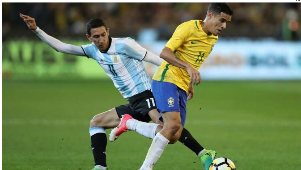
BRASILEIROS E ARGENTINOS PROMETEM GRANDE JOGO ESTA TARDE NA CIDADE DE JIDÁ

No gol, Alisson deverá retornar, substituindo Ederson, que teve rara chance de atuar pelos pentacampeões. Além disso, Danilo, Miranda e Filipe Luís devem atuar nos lugares de Fabinho, Pablo e Alex Sandro, respec-