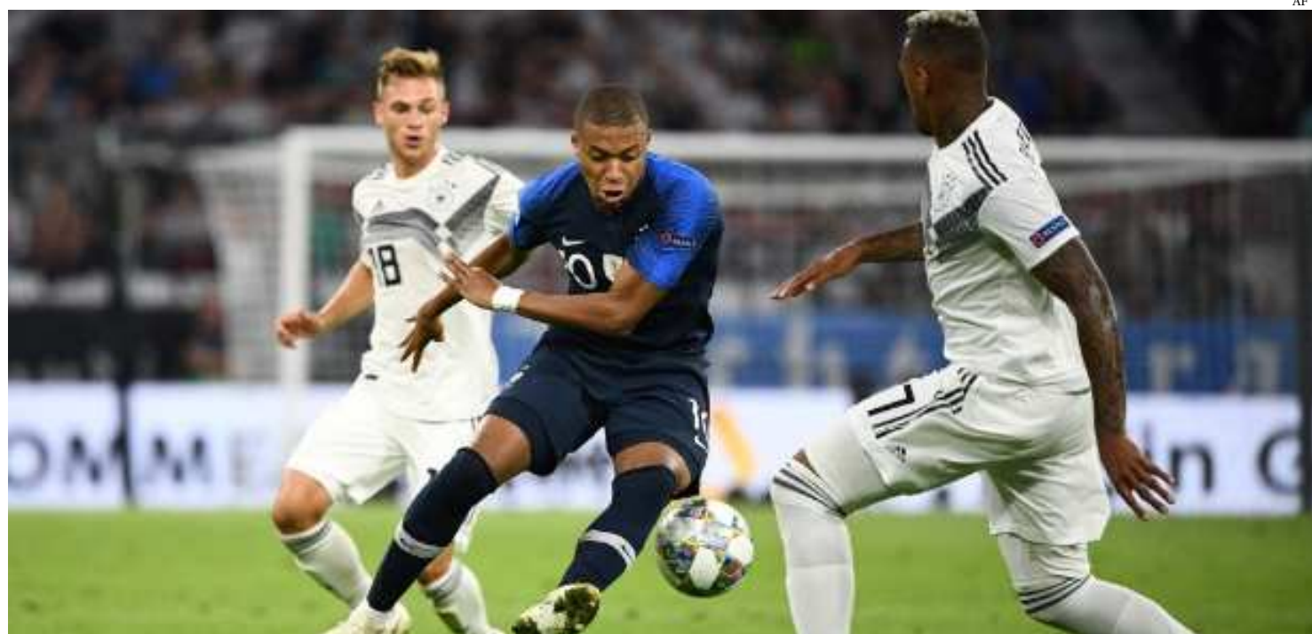
ALEMANHA E FRANÇA FAZEM UM DOS GRANDES CLÁSSICOS DO FUTEBOL EUROPEU, NO STADE DE FRANCE, EM PARIS

A Alemanha está em crise e precisa de uma vitória para dar uma resposta aos críticos, que incluem boa parte da imprensa e ex-jogadores da equipe. A França, por sua vez, atual campeã mundial, manteve a base da temporada passada e tem jogadores que são protagonistas em seus clubes, como Mbappé, Griezmann e Pogba. As duas equipes se enfrentam, hoje, no Stade de France, em Paris, pela Liga das Nações. Em momentos distintos, duas das grandes seleções da história do futebol, medem força. A partida vai ser às 15h45.