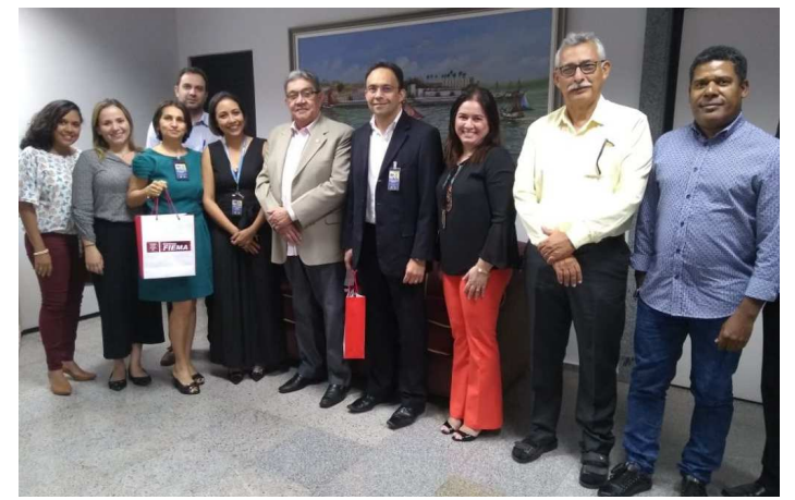
Reunião teve a presença da infraero