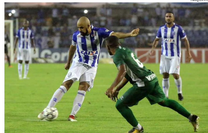
CORITIBA E CSA FAZEM JOGO COM OS MESMOS OBJETIVOS

A reta final da Série B do Campeonato Brasileiro está emocionante. Com o líder Fortaleza caminhando a passos largos para confirmar o acesso, restam três vagas em aberto para a primeira divisão nacional de 2019. O CSA, que vive um momento de oscilação, depende de apenas de suas forças para terminar a 32ª rodada no G4, enquanto Atlético-GO e Coritiba buscam a reabilitação para seguir na briga.