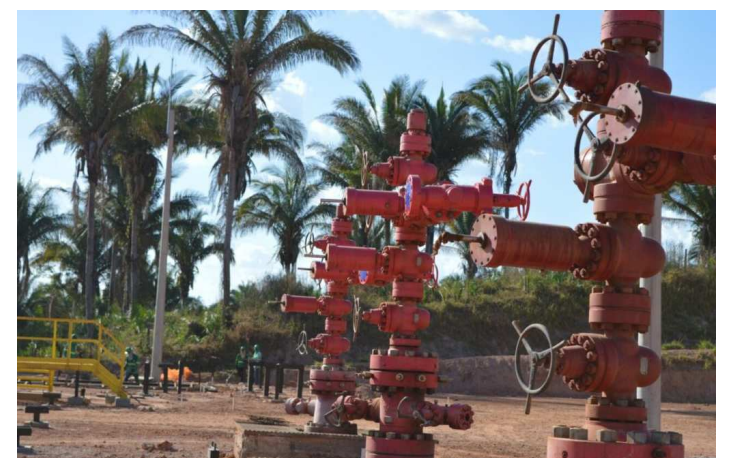
A comercialidade do gás natural se consolida

A política de atração e expansão de investimentos no Maranhão, realizada pela Secretaria de Estado de Indústria, Comércio e Energia (Seinc), resulta no anúncio de mais uma importante iniciativa no estado. A declaração de comercialidade de um poço de gás natural localizado na cidade de Bacabal, município da região do Médio Mearim.