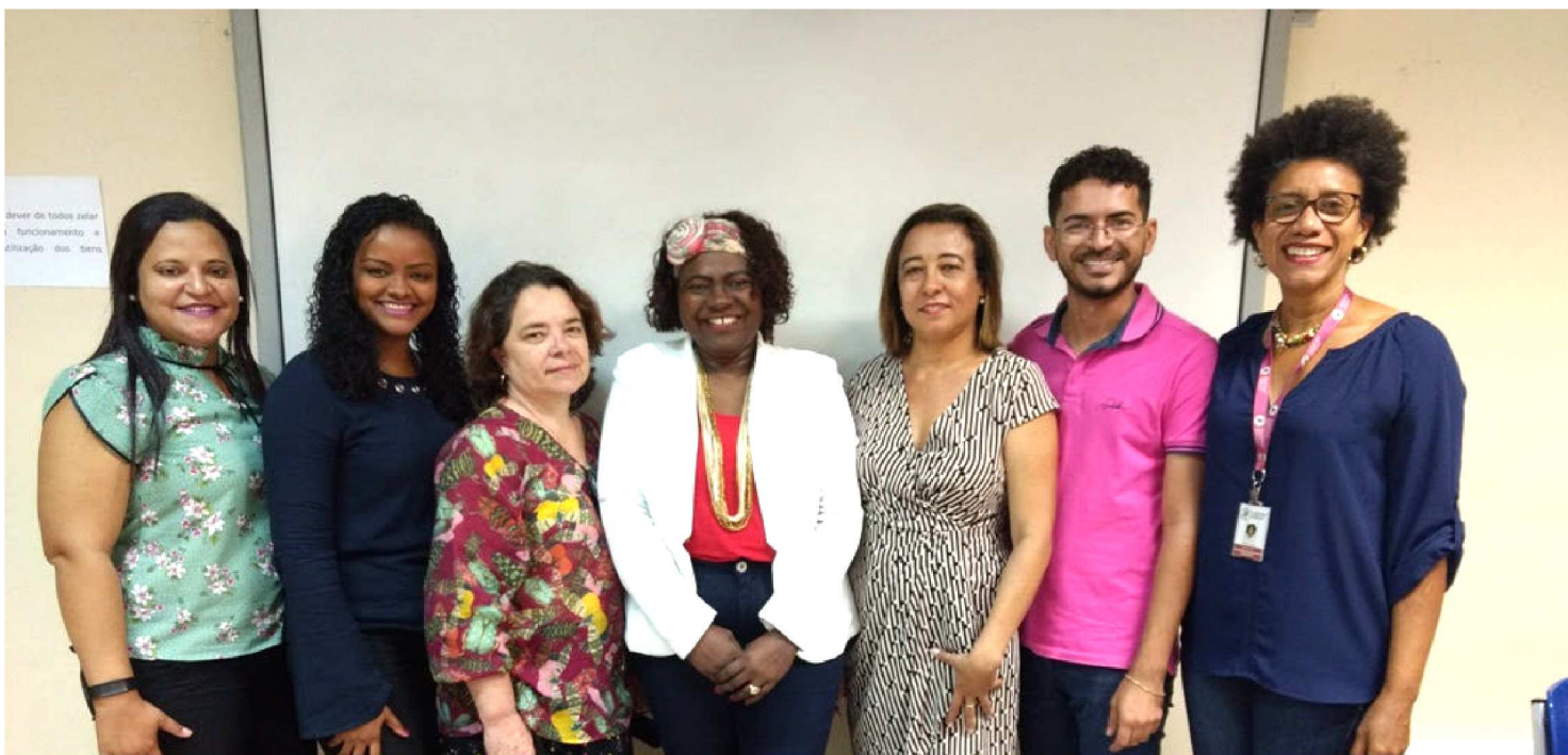
ESPECIALISTAS FORAM CERTIFICADOS EM SOCIOEDUCAÇÃO

O Maranhão passa a contar, agora, com profissionais especialistas em socioeducação. Em outubro, dez profissionais do sistema socioeducativo nos meios aberto e fechado foram certificados no Curso de Especialização em Políticas Públicas e Socioeducação, realizado pela Escola Nacional de Socioeducação – ENS, vinculada à Secretaria Nacional dos Direitos da Criança e do Adolescente, em parceria com a Universidade de Brasília – UnB. A iniciativa pioneira no país visou capacitar profissionais com formação especializada para atuar no sistema socioeducativo, sendo dez alunos por cada estado. Realizado de forma simultânea e articulada com os núcleos estaduais das Escolas de Socioeducação, o curso foi realizado na modalidade de ensino à distância, com orientação de professores de referência nas áreas de gestão de políticas públicas em socioeducação, justiça e direitos humanos, processo e o atendimento socioeducativo, e metodologias de pesquisa e intervenção. No âmbito local, o curso teve o apoio da Uni-