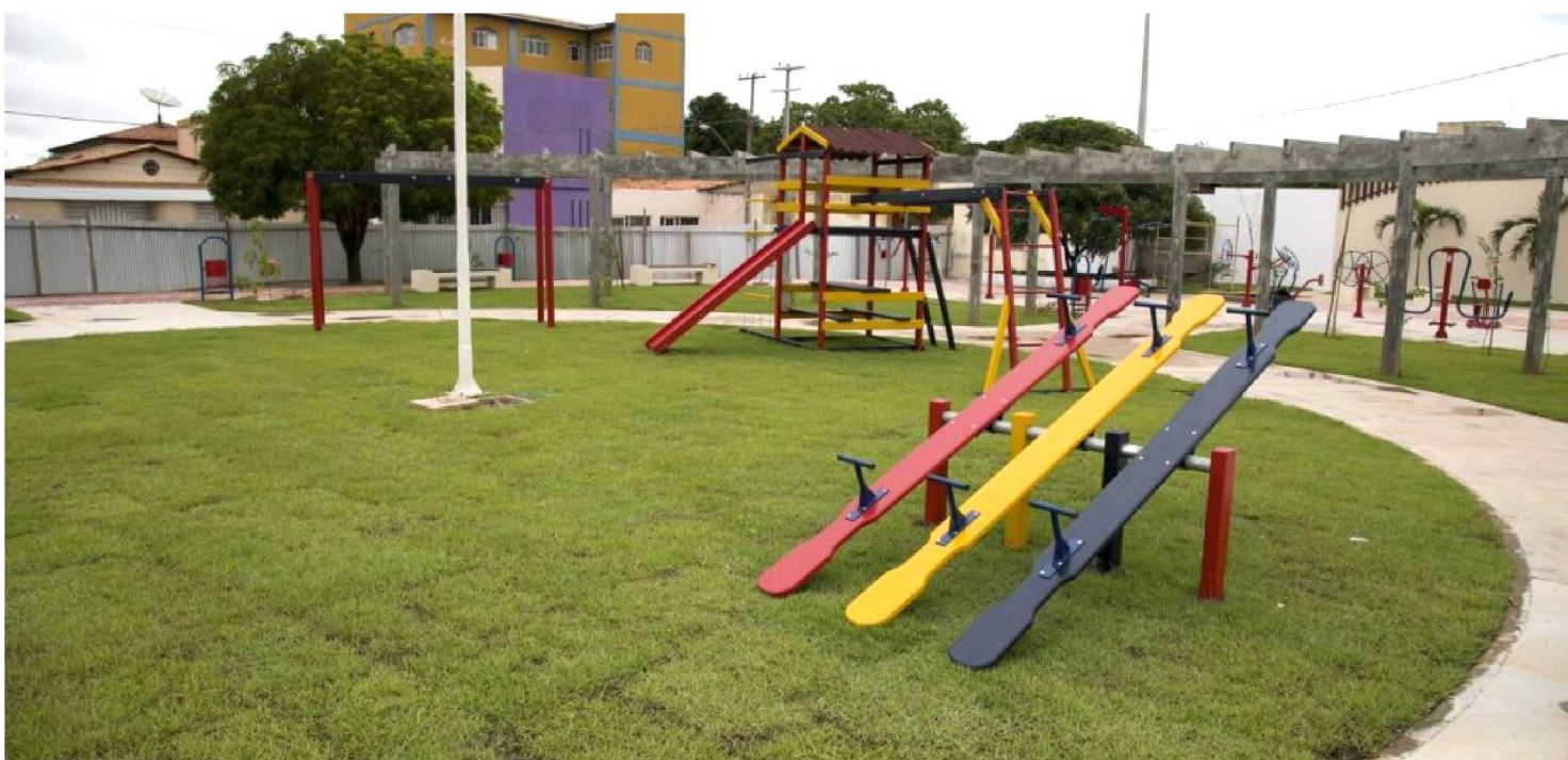
AS OBRAS DE MODERNIZAÇÃO E ADEQUAÇÃO CONTEMPLAM A CONSTRUÇÃO DE QUIOSQUES COM LANCHONETES E BANHEIROS

Os investimentos do Governo do Maranhão não param. Na área de Esporte e Lazer, só neste ano de 2018, por meio da Secretaria de Estado da Infraestrutura, mais de R$ 24 milhões já foram aplicados em construções e revitalizações de complexos esportivos e praças.