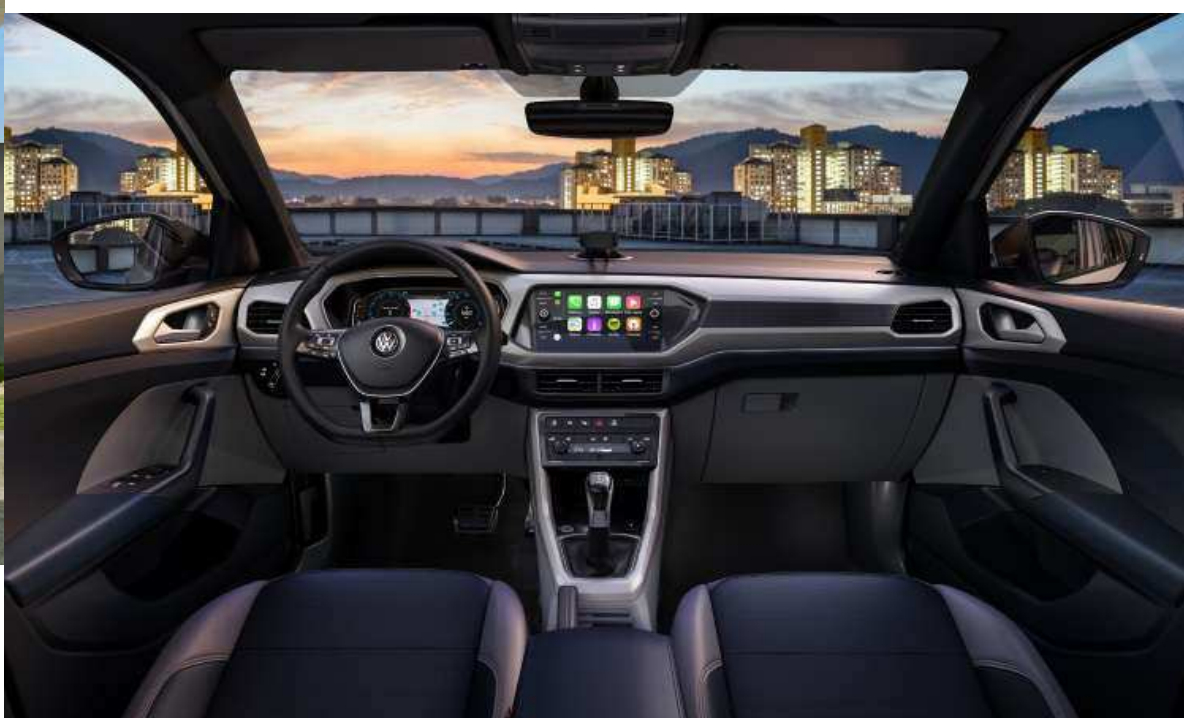
O PAINEL TEM DESENHO MODERNO, HORIZONTALIZADO, COM SISTEMA MULTIMÍDIA QUE LEMBRA UM TABLETE

1 O porta-malas tem volume que pode variar de 373 a 420 litros, já que o banco traseiro é reclinável e o encosto do dianteiro do passageiro pode ser dobrado, ampliando o espaço para cargas compridas. E falando em espaço, o interior do T-Cross acomoda quatro pessoas com conforto, já que conta com bancos anatômicos e com comandos bem posicionados. O painel é moderno e horizontalizado, como as linhas externas do modelo. A versão Highline, mais completa, poderá vir equipada com painel de instrumentos totalmente digital, o Active Info Display, que altera a configuração dos elementos e exibe o mapa de navegação.