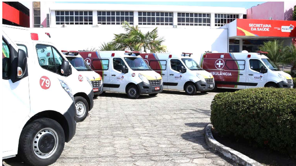
MODERNAS AMBULÂNCIAS PARA UNIDADES DE SAÚDE DO INTERIOR DO ESTADO

Destas sete ambulâncias, três são unidades de suporte avançado”, pontuou. O Hospital Macrorregional de Presidente Dutra e os Hospitais Regionais de Timon e Caxias foram beneficiadas com transporte sanitário de suporte avançado (USA) – veículos equipados com duas macas, duas pranchas, um umidificador, cadeira de rodas, desfibrilador, cilindro e bala de transporte para oxigênio. A diretora administrativa do Hospital Regional