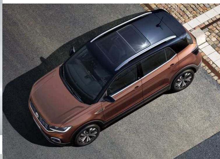
O TETO SOLAR PANORÂMICO É UM DOS OPCIONAIS DO NOVO SUV COMPACTO