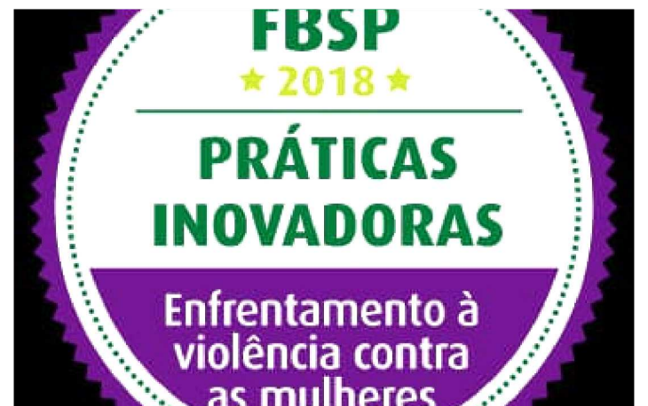
PATRULHA MARIA DA PENHA É INICIATIVA DO GOVERNO

A Patrulha Maria da Penha, da Polícia Militar do Maranhão (PMMA), recebeu um importante reconhecimento nacional. Na última quarta-feira (31), o grupo especializado no combate à violência contra a mulher foi premiado com o selo do Fórum Brasileiro de Segurança Pública (FBSP). O projeto maranhense concorreu com outras 106 iniciativas inscritas.