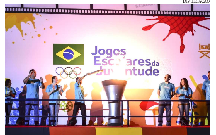
JOGOS ESCOLARES DA JUVENTUDE COMEÇAM NO DIA 12

O Comitê Olímpico do Brasil (COB) já está em Natal (RN) para organizar a maior etapa já realizada dos Jogos Escolares da Juventude, entre os dias 12 e 25 de novembro. Remodelada esse ano, a principal competição estudantil do país terá a participação de mais de 5 mil atletas dos 26 estados brasileiros, além do Distrito Federal e uma delegação do Japão. O Centro de Convivência do evento, em Ponta Negra, vai receber pela primeira vez atletas das duas categorias de idade – 12 a 14 e 15 a 17 anos, de 2.136 escolas de todo o país. Além das competições, diversas atrações culturais e educativas farão parte do evento.