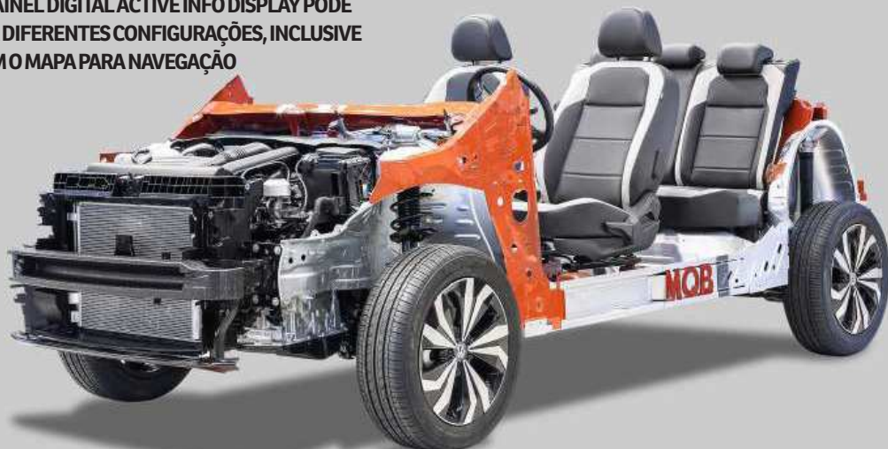
O PAINEL DIGITAL ACTIVE INFO DISPLAY PODE TER DIFERENTES CONFIGURAÇÕES, INCLUSIVE COM O MAPA PARA NAVEGAÇÃO

As versões 1.0 TSI podem ser equipadas com câmbio manual ou automático Tiptronic, com as aletas no volante, ambas de seis marchas. O outro motor é o 250 TSI Total Flex (1.4 litro), que gera 150cv e 25,5kgfm de torque, com gasolina ou etanol. Ele só pode ser combinado com o câmbio automático de seis marchas.