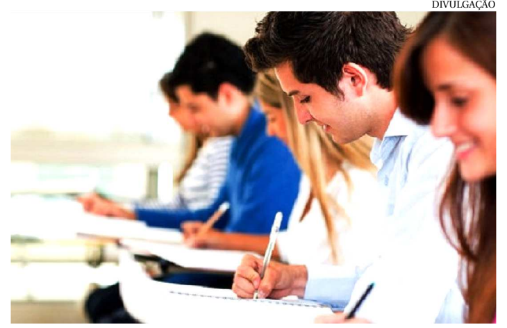
A CERIMÔNIA DE CERTIFICAÇÃO FOI REALIZADA QUARTA-FEIRA

A Prefeitura de São Luís, por meio da Secretaria Municipal de Educação (Semed), certificou 800 alunos que participaram do programa Brasil Alfabetizado, iniciativa do Governo Federal executado pela gestão municipal. A cerimônia de certificação ocorreu nesta quarta-feira (31). O programa tem o objetivo de contribuir para a universalização do Ensino Fundamental, promovendo apoio às ações de alfabetização de jovens a partir dos 15 anos, adultos e idosos.