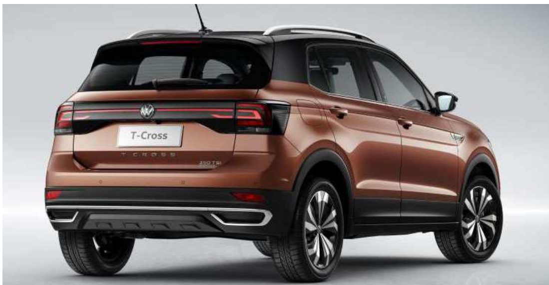
A TRASEIRA ROBUSTA TEM UM PAINEL QUE FAZ A CONEXÃO ENTRE AS LANTERNAS

2 O modelo conta ainda com sistema multimídia com tela tátil de oito polegadas, semelhante a um tablet, que será vendido como opcional. São quatro entradas USB, sendo duas para os passageiros do banco de trás, que também são beneficiados por saídas de ar-condicionado. Um detalhe interessante do interior do T-Cross é a iluminação ambiente em LED, que pode ser vista na região dos pés, no centro do console, no painel e nas maçanetas. Outro opcional para o modelo é o sistema de som Beats, com sete alto-falantes, sub woofer no porta-malas) e 300W RMS de potência. Além disso, o T-Cross disponibiliza o seletor do perfil de condução, que traz os modos normal, ecológico, esportivo e individual.