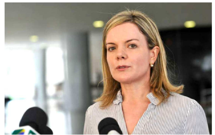
PRESIDENTE DO PT, GLEISI HOFFMANN, TAMBÉM CRITICOU

O PT reagiu com duras críticas à escolha do juiz Sérgio Moro como ministro da Justiça e Segurança Pública no governo de Jair Bolsonaro. Para o partido, Moro revelou “imparcialidade como juiz” após ter condenado o ex-presidente Luiz Inácio Lula da Silva e aceitado o convite do presidente eleito. “Sua máscara caiu”, diz nota da Executiva Nacional da legenda.