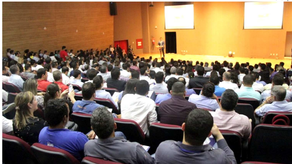
A CONSTRUÇÃO DO PORTO SÃO LUÍS FAZ PARTE DA POLÍTICA DE INVESTIMENTOS

Na ocasião, os fornecedores do Maranhão tiveram a oportunidade de interagir com as empresas apoiadoras e mantenedoras do PDF, que é considerado um instrumento estratégico de