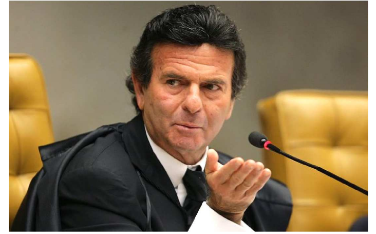
PARA MINISTRO DO STF, MORO VAI COMBATER A CORRUPÇÃO

O ministro Luiz Fux, do Supremo Tribunal Federal (STF), comentou quinta (1º) o anúncio de que o juiz federal Sergio Moro aceitou o cargo de ministro da Justiça no governo do presidente eleito Jair Bolsonaro, afirmando que a “escolha foi a que a sociedade brasileira o faria se consultada”.