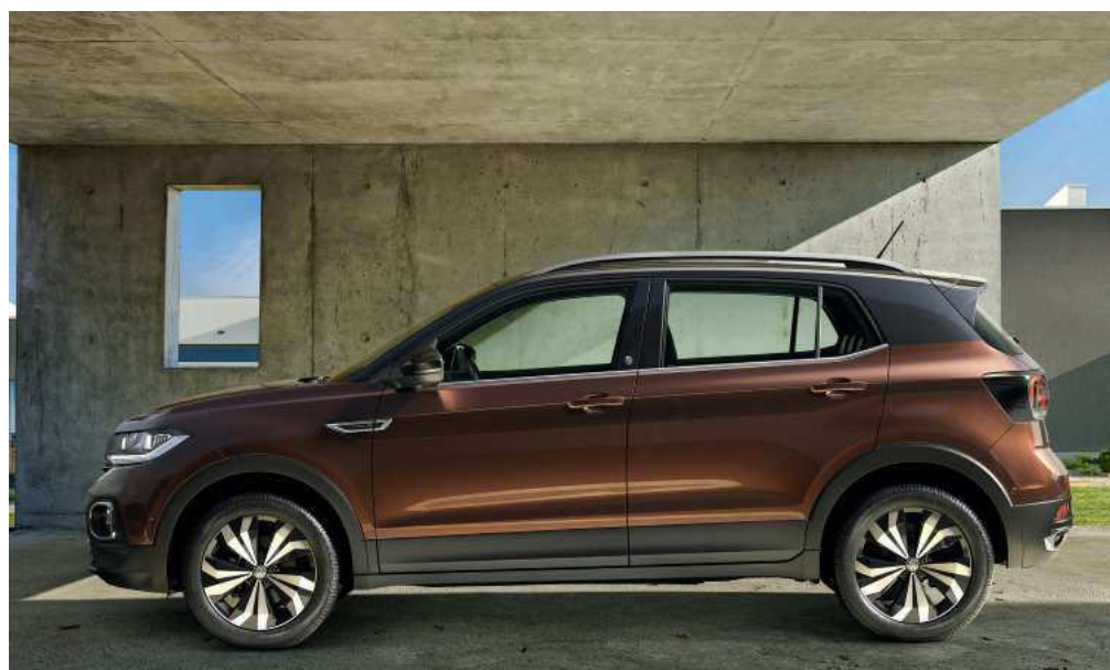
O MODELO BRASILEIRO TEM DISTÂNCIA ENTRE-EIXOS DE 2,65M, 88MM MAIOR DO QUE O EUROPEU

1 O porta-malas tem volume que pode variar de 373 a 420 litros, já que o banco traseiro é reclinável e o encosto do dianteiro do passageiro pode ser dobrado, ampliando o espaço para cargas compridas. E falando em espaço, o interior do T-Cross acomoda quatro pessoas com conforto, já que conta com bancos anatômicos e com comandos bem posicionados. O painel é moderno e horizontalizado, como as linhas externas do modelo. A versão Highline, mais completa, poderá vir equipada com painel de instrumentos totalmente digital, o Active Info Display, que altera a configuração dos elementos e exibe o mapa de navegação.