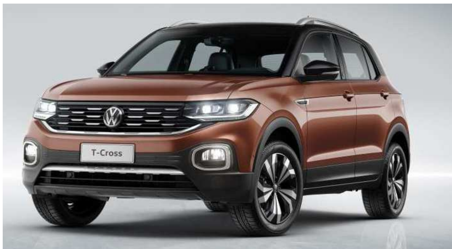
O SUV COMPACTO SERÁ PRODUZIDO NA FÁBRICA DE SÃO JOSÉ DOS PINHAIS, NO PARANÁ

O VW T-Cross foi apresentado em São Paulo simultaneamente com a Europa e a China, onde também será comercializado, e é um dos cinco novos SUVs que a montadora lançará na América Latina até 2020. Mas a Volkswagen revelou que o modelo produzido no Brasil terá algumas diferenças, como distância entre-eixos 88mm maior do que a do similar europeu, totalizando 2,65m. O T-Cross mede 4,20m de comprimento e 1,56m de altura (9mm mais alto que modelo europeu). Todas as versões serão equipadas com luz de condução diurna (DRL) em LED, integrada ao farol de neblina, mas opcionalmente poderão trazer faróis full-LED.