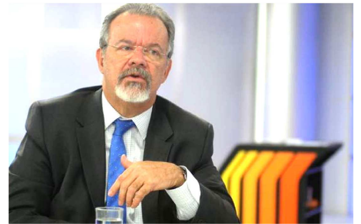
JUNGMANN DEVE SE ENCONTRAR COM MORO NA QUARTA, 07

O ministro da Segurança Pública, Raul Jungmann, afirmou na última quinta-feira, 1º, considerar “um ganho” ter o juiz Sérgio Moro no Executivo. O juiz aceitou nesta manhã o convite feito pelo presidente eleito Jair Bolsonaro para comandar um superministério da Justiça, abarcando também a área da Segurança Pública.