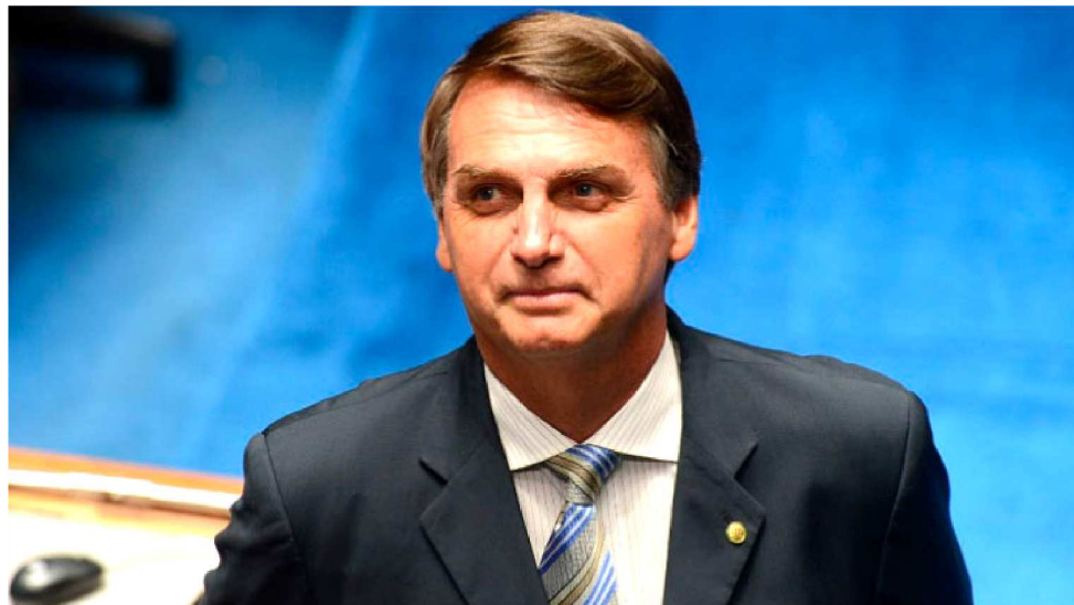
BOLSONARO DIZ QUE MARCOS PONTE TEM A MISSÃO DE ALAVANCAR ENSINO SUPERIOR

O presidente eleito também anunciou que o ensino superior sairá do âmbito do Ministério da Educação e passará a ser administrado pelo Ministério da Ciência e Tecnologia. “Não temos nenhuma das nossas universidades entre as melhores do mundo e o nosso Marcos Pontes vai dar um gás