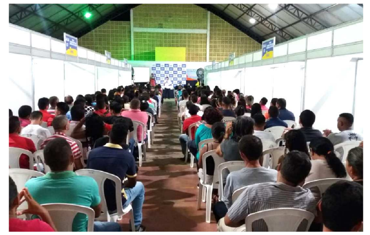
ENCONTRO DO SEBRAE VAI HABILITAR EMPREENDEDORES