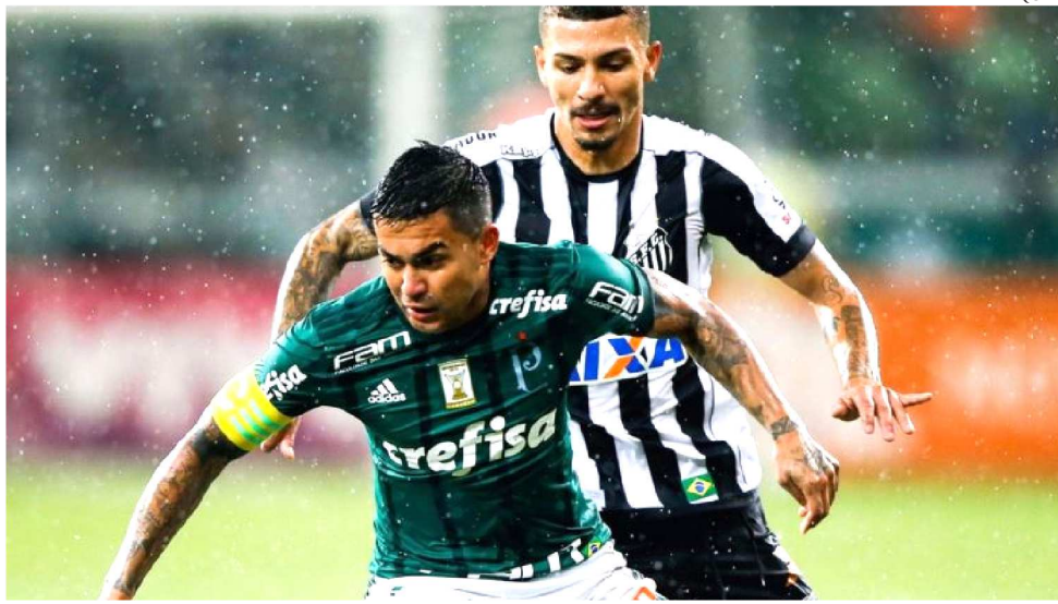
PALMEIRAS E SANTOS FAZEM HOJE À NOITE O GRANDE CLÁSSICO DO FUTEBOL PAULISTA

Está muito perto de entrar nesse bloco. A pontuação já é a mesma do Atlético-MG, que só aparece na frente do Santos por levar vantagem nos critérios de desempate. Assim, falta apenas dar um passo à frente.