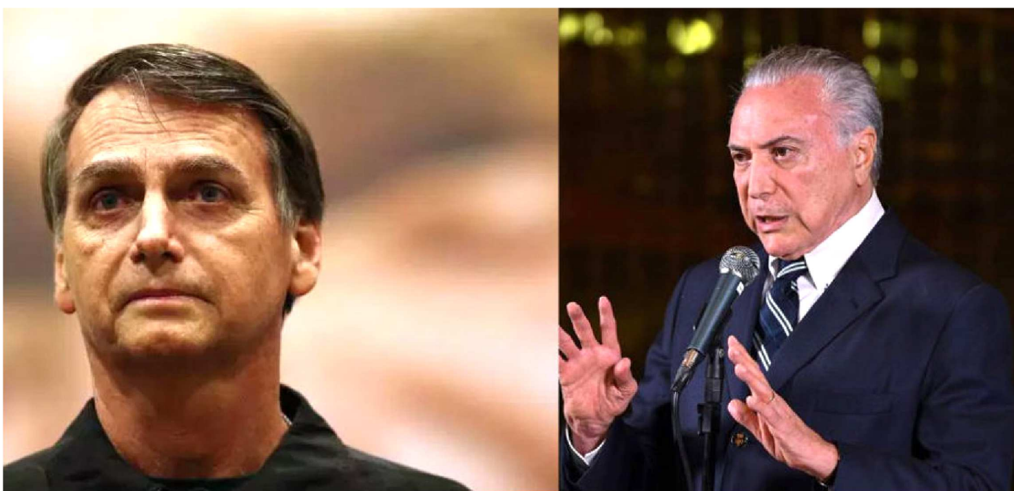
O PRESIDENTE ELEITO, JAIR BOLSONARO (PSL) CONVERSOU COM O PRESIDENTE MICHEL TEMER (MDB) APÓS RESULTADO DAS URNAS

A primeira reunião entre o presidente Michel Temer e o presidente eleito Jair Bolsonaro está marcada para a próxima quarta-feira (7), no Palácio do Planalto. O encontro representa a continuidade do processo de transição entre os dois governos iniciado quarta (31), quando o ministro-chefe da Casa Civil, Eliseu Padilha, recebeu os primeiros 22 nomes da equipe de transição da parte de Bolsonaro.