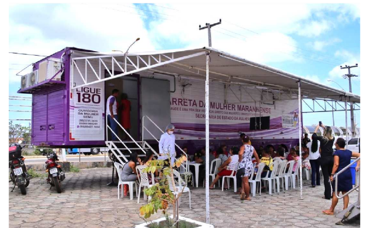
CARRETA DA MULHER FEZ MAIS DE UM MIL ATENDIMENTOS