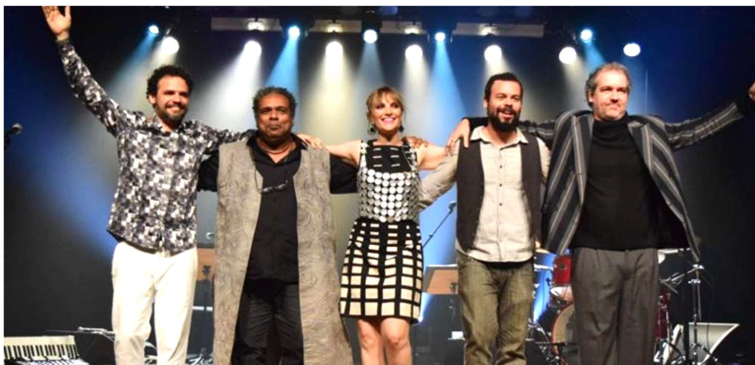
ESPETÁCULO MOSTRARÁ CANÇÕES QUE ENTRARAM PARA HISTÓRIA E MARCARAM GERAÇÕES EM EVENTO EXCLUSIVO PARA MÉDICOS

Um delicioso musical para reviver o sonho da democracia, do aflorar da MPB e de grandes astros da música brasileira revelados em festivais dos anos de 1960, uma era de efervescências políticas e culturais no Brasil! Sucesso absoluto por onde tem passado o musical MPB – A Era dos Festivais é a grande atração amanhã (13) no palco do Teatro Arthur Azevedo, onde acontece a II Noite da Medicina Maranhense, evento fechado para convidados da classe médica e que presta homenagem a médicos que marcaram época em nosso Estado.