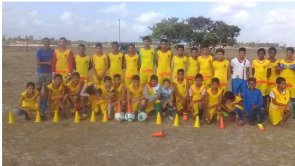
ESTA É UMA DAS EQUIPES QUE FAZEM PARTE DA ESCOLINHA "PEQUENOS LEÕES"

Concorrendo com outros 42 meninos da mesma faixa etária, os maranhenses se destacaram e despertaram o interesse do coordenador das divisões de base. Foram examinados e depois liberados para retornarem a São Luís, onde a preparação continua. No próximo ano o observador do clube carioca retorna a Santo Amaro para analisar a evolução técnica da dupla. As chances deles serem transferidos para o Fluminense são muito grandes. Eles só não ficaram imediatamente no Rio, devido ao período de transfe-