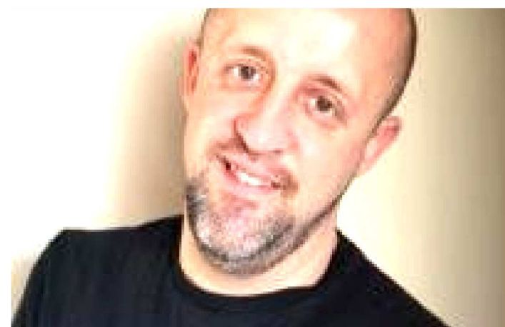
CARPINEJAR TORNOU-SE CONHECIDO PELO JETTO DE ESCREVER

O poeta, cronista e jornalista Fabrício Carpinejar será um dos destaques da 12ª Feira do Livro de São Luís. O escritor que publicou quarenta e três livros entre poesia, crônicas, infanto-juvenis e reportagem, detentor de mais de 20 prêmios literários, atua como comentarista do programa Encontro com Fátima Bernardes e é colunista dos jornais Zero Hora e blog no O Globo.