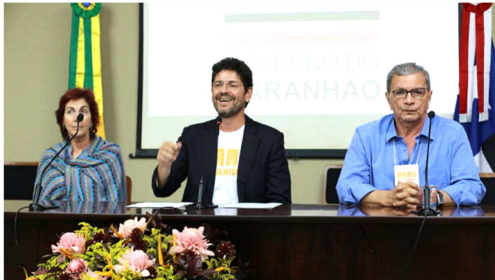
TEMAS DE GRANDE IMPORTÂNCIA FORAM DEBATIDOS DURANTE O EVENTO

Durante o encontro foram realizadas diversas oficinas e mesas de debates, além de reuniões da diretoria da Anipes. O anfitrião do evento, presidente do Instituto Maranhense de Estudos Socioeconômicos e Cartográficos