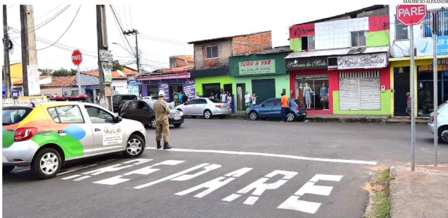
PREFEITURA REALIZA INTERVENÇÕES PARA DAR MAIS FLUIDEZ AO TRÁFEGO NA REGIÃO DA COHAMA

Com o objetivo de dar maior fluidez ao tráfego e proporcionar mais mobilidade e segurança a motoristas e aos pedestres, a Prefeitura de São Luís, por meio Secretaria Municipal de Trânsito e Transportes (SMTT), segue realizando intervenções em ruas e avenidas da capital. Esta semana, os bairros que integram a região da Cohama receberam os serviços. No local, foram feitas modificações no sentido das vias, bem como implantada nova sinalização horizontal e vertical. As ações integram um pacote de serviços executados pela gestão do prefeito Edivaldo Holanda Júnior em pontos estratégicos da cidade e que visam garantir mais qualidade de vida para a população.