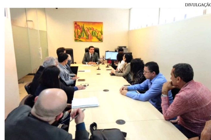
O EDITAL DEVE SAIR EM MARÇO DE 2019. AS PROVAS ATÉ MAIO

O Governo do Estado, por meio da Fundação da Criança e do Adolescente, assinou acordo com o Ministério Público do Estado sobre a realização do concurso público da Fundação, em audiência de conciliação na Vara de Interesses Difusos e Coletivos, na sexta (9), no Fórum Desembargador Sarney Costa.