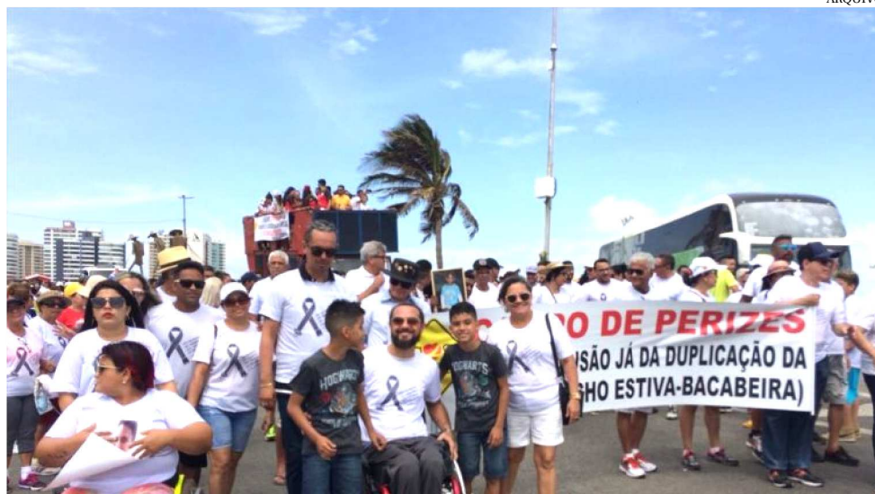
CAMPANHA ACONTECE EM SÃO LUÍS TODOS OS ANOS DESDE 2011, NA AV. LITORÃNEA

O Dia Mundial em Memória das Vítimas de Trânsito é uma ação de nível