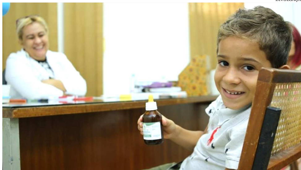
O FARMÁCIA VIVA É UMA INICIATIVA PIONEIRA, CRIADA PELO GOVERNADOR FLÁVIO DINO

O Farmácia Viva consiste no cultivo, conservação e utilização de plantas medicinais, bem como a produção de alguns tipos de plantas medicinais (utilizando como matriz as próprias plantas cultivadas), que serão dispensadas no Sistema Único de Saúde – so-