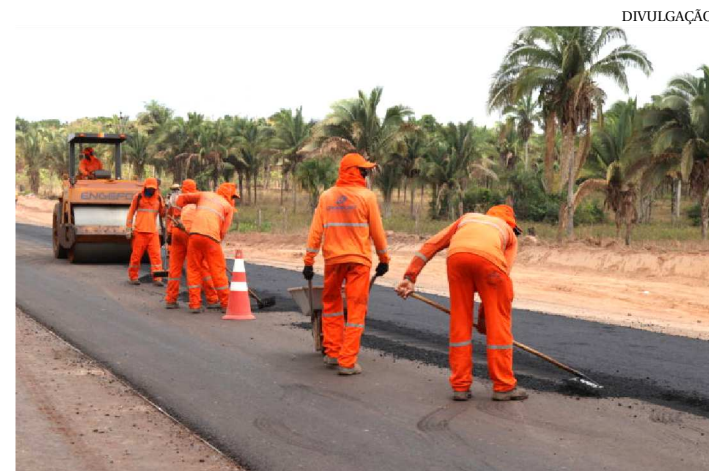
O INVESTIMENTO MELHOROU A VIDA DE 52.664 MORADORES

Buritirana e Amarante receberam do Governo do Estado 20 quilômetros de pavimentação de vias urbanas e rurais. Investimento que melhorou a vida dos 52.664 moradores, com o fim da poeira, da lama e com melhores condições de acesso.