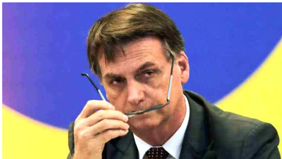
JAIR BOLSONARO DIZ QUE 70% DO DINHEIRO É DESTINADO PARA O GOVERNO CUBANO

Ele ainda defendeu que é um tema que também afeta as relações trabalhistas. “Em torno de 70% do salário desse médico é confiscado para a ditadura cubana. Outra coisa, que é um desrespeito com quem recebe tratamento por parte desses cubanos. Não temos qualquer comprovação que se-