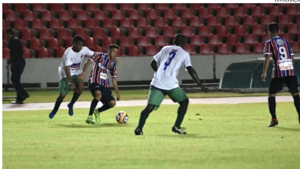
MAC VAI MOSTRAR SUA FORÇA CONTRA O BACABAL, PENSANDO NO TOPO DA TABELA