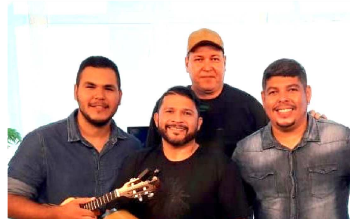
FESTA DO NOBRE SIMPLICIDADE ACONTECE HOJE, NO FERIADO