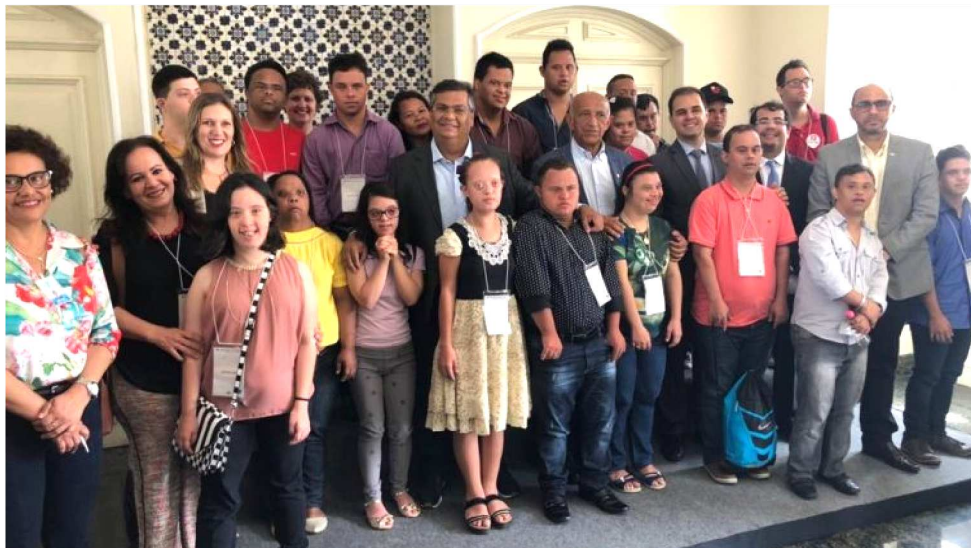
ALUNOS CAPACITADOS VISITAM O PALÁCIO DOS LEÕES