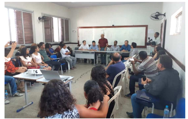
CARAVANA DA LIBERDADE VAI A TIMBIRAS DEBATER

Dando continuidade às ações do Programa Estadual de Enfrentamento ao Trabalho Escravo, a Caravana da Liberdade foi a Timbiras para discutir junto ao poder público e sociedade civil locais estratégias para prevenir o aliciamento de pessoas vulneráveis ao trabalho escravo. Conforme o Observatório do Trabalho Escravo (MPT/OIT), entre os anos de 2003 e 2017 cerca de 22,85% dos trabalhadores resgatados no Brasil são naturais do Maranhão. A Caravana da Liberdade é uma iniciativa da Comissão Estadual para a Erradicação do Trabalho Escravo (COETRAE/MA).