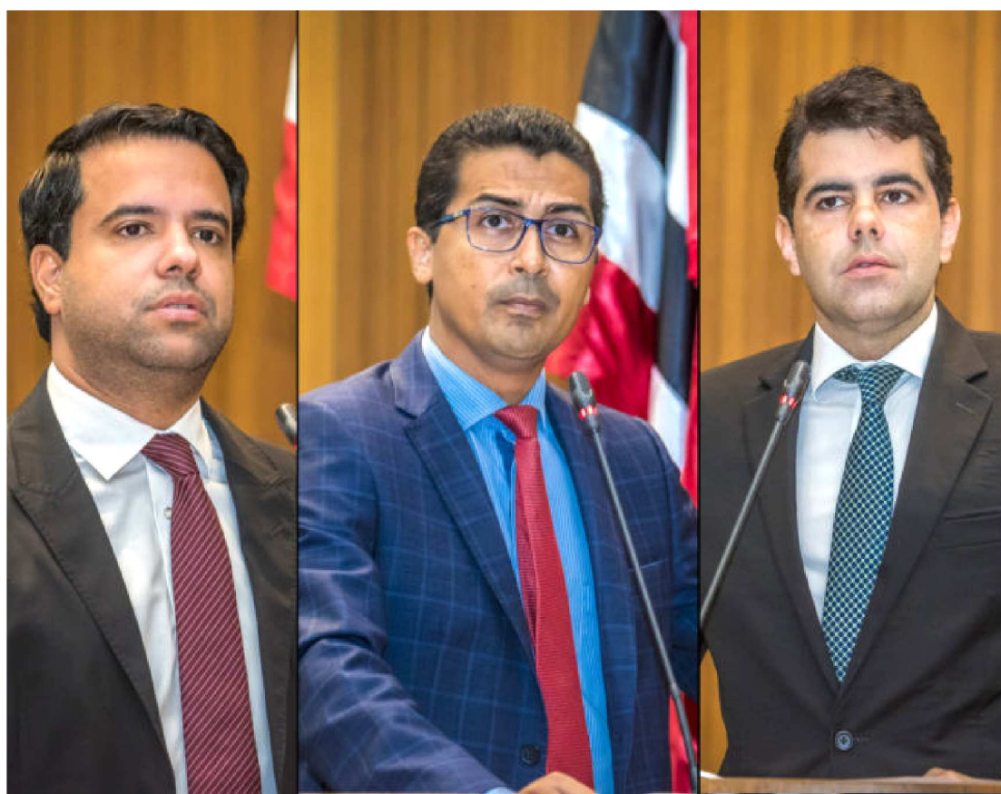
DEPUTADOS SAEM A FAVOR E CONTRA O DECRETO EDITADO PELO GOVERNADOR FLÁVIO DINO

Nesta semana repercutiu, na Assembleia Legislativa, o decreto editado pelo governador Flávio Dino (PCdoB). O decreto, batizado de “Escolas com Liberdade e Sem Censura no Maranhão”, gerou discussão, na última terça-feira (13), em torno do teor do documento. O decreto garante liberdade aos professores dentro das salas de aula e é uma resposta ao projeto de Lei Escola Sem Partido, bandeira defendida pelo presidente eleito, Jair Bolsonaro (PSL).