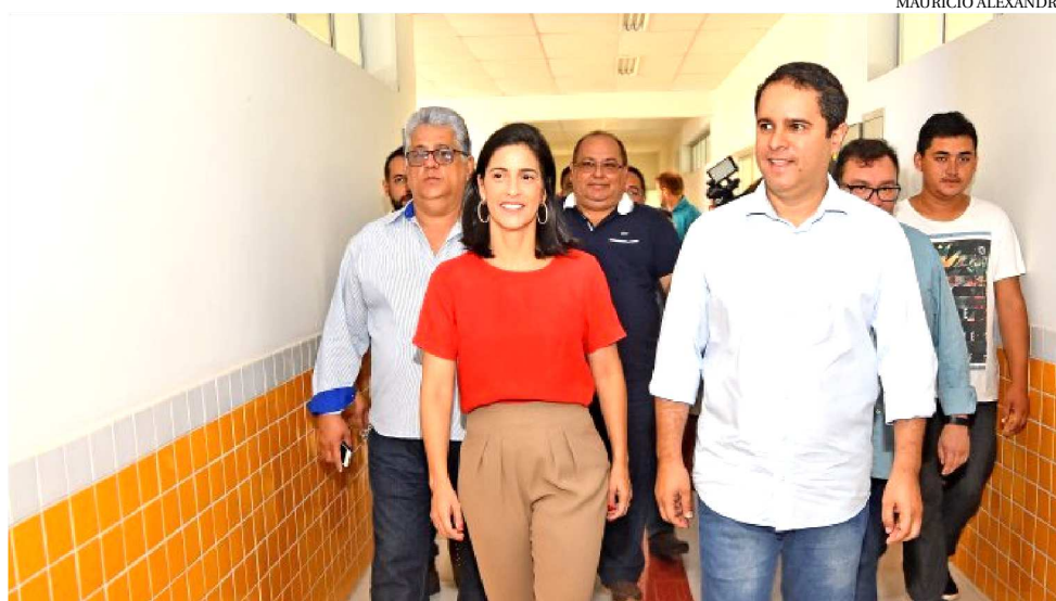
A CRECHE DA CHÁCARA BRASIL POSSUI O MESMO PADRÃO ESTRUTURAL DAS DEMAIS

mesmo padrão estrutural das demais unidades que já estão prontas ou em construção. São espaços idealizados para o acolhimento e o desenvolvimento das crianças com até cinco anos de idade. A unidade atenderá principalmente a crianças de bairros da região do Turu, como Divineia, Vila Luizão, Alonso Costa, entre outros.