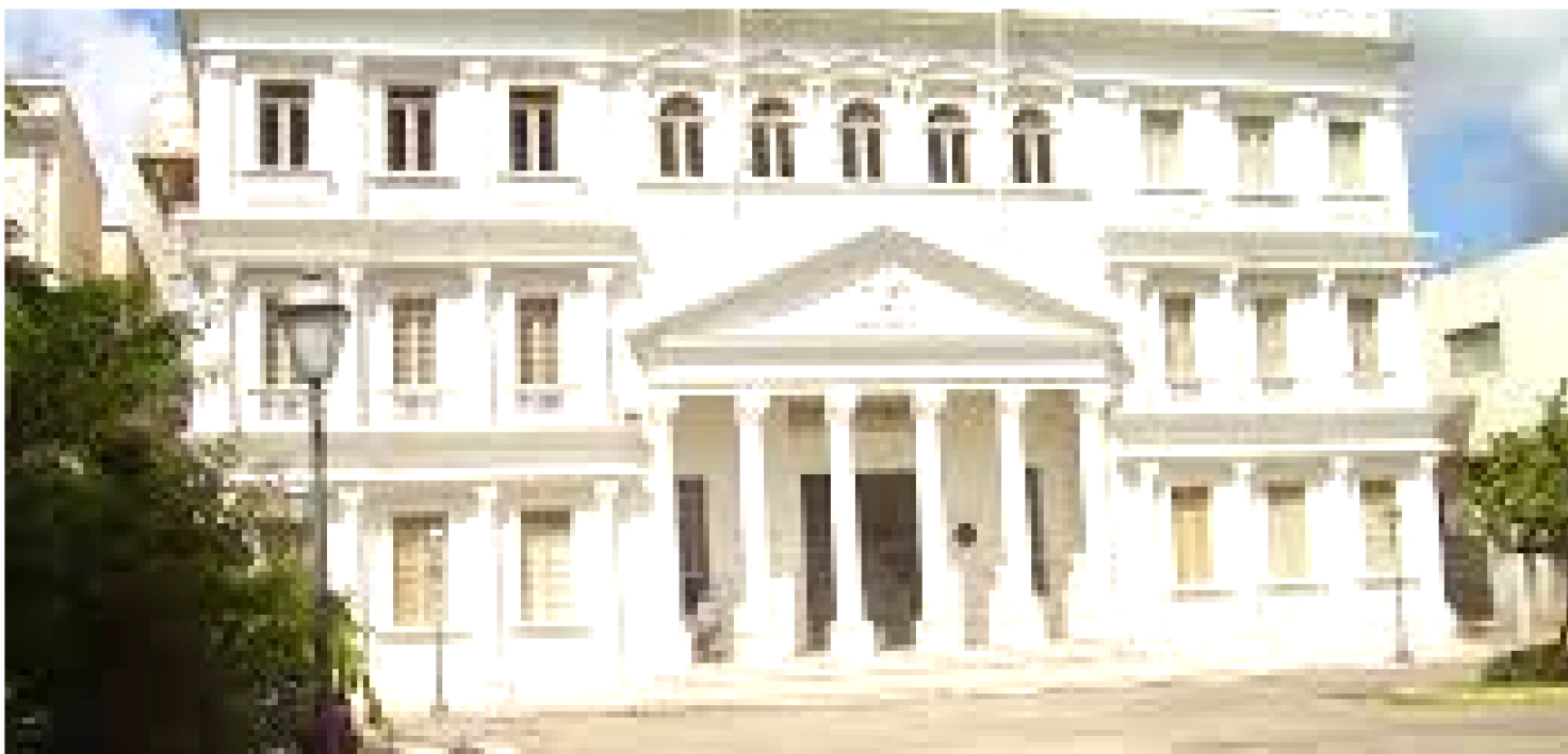
A JUSTIÇA INSTRUI SOBRE BOAS PRÁTICAS

Profissionais de comunicação do sistema de Justiça brasileiro se reunirão no dia 23 de novembro, em São Luís (MA), para um workshop de boas práticas na área. O evento é promovido pelo Tribunal de Justiça do Maranhão, em parceria com o Fórum Nacional de Comunicação e Justiça (FNCJ). A atividade acontecerá das 8h às 18h, no auditório da Associação dos Magistrados do Maranhão (AMMA). Serão certificadas seis horas de capacitação.