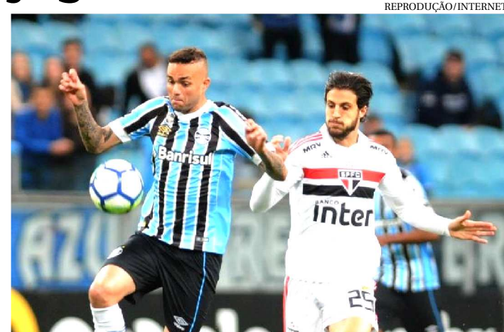
CLÁSSICO DOS TRICOLORS VALE VAGA PARA A LIBERTADORES

São Paulo e Grêmio duelam nesta quinta-feira (15) por uma vaga direta na fase de grupos da edição 2019 da Copa Libertadores da América. O clássico entre tricolores é parte da programação da trigésima quarta das 38 rodadas previstas para o Campeonato Brasileiro versão 2018. Será disputado no Morumbi, em São Paulo, a partir das 19h (horário de Brasília).