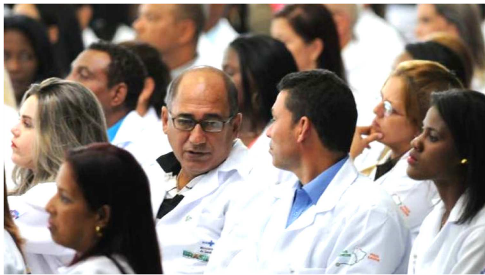
PROFISSIONAIS DA SAÚDE TAMBÉM APROVAM O PROGRAMA MAIS MÉDICOS

Entre os resultados, Um índice alto de usuários (87%) apontou que a