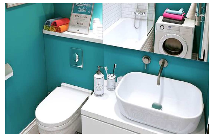
EQUIPAMENTOS MELHORAM IDH

Com a construção e instalação dos kits sanitários – banheiros individuais dotados de infraestrutura adequada para atender necessidades básicas de higiene pessoal – os maranhenses de 13 municípios com baixo Índice de Desenvolvimento Humano (IDH) estão tendo mais saúde, qualidade de vida e emprego. As obras são realizadas pela Companhia de Saneamento Ambiental do Maranhão (Caema). Já foram entregues 507 kits sanitários, beneficiando cerca de 2.200 pessoas. O investimento total para os primeiros lotes de banheiros foi de aproximadamente R$ 4,3 milhões. Outros 473 kits sanitários em construção estão em fase de conclusão.