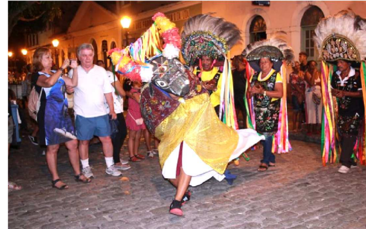
BOI LINDA JOIA APRESENTA-SE NO CANTO DA CULTURA