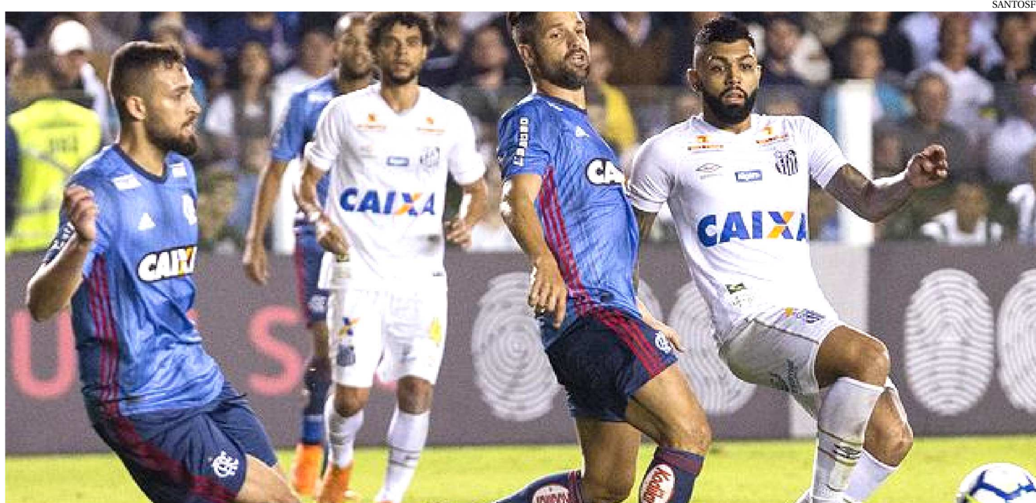
O ARTILHEIRO GABIGOL (À DIREITA) REAPARECERÁ NO ATAQUE DO TIME SANTISTA, NESTA TARDE, CONTRA O RUBRO-NEGRE CARIOCA

Em clima de depressão, Flamengo e Santos vão duelar hoje pela trigésima quarta rodada do Campeonato Brasileiro e aproveitando-se do feriado da Proclamação da República, dia do aniversário do rubro-negro, a partir das 17h (horário de Brasília), no Maracanã, Rio de Janeiro.