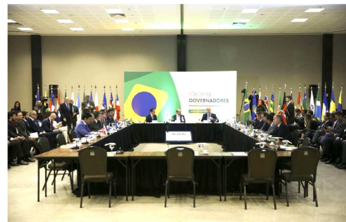
GOVERNADORES ELEITOS PARTICIPAM DE FÓRUM EM BRASÍLIA

O governador do Piauí, Wellington Dias (PT), ficou responsável de representar os governadores do Nordeste no Fórum de Governadores que aconteceu, ontem, em Brasília.