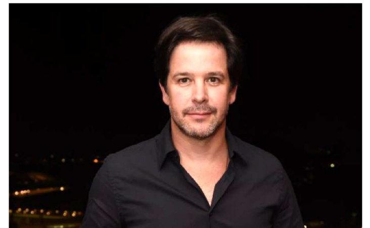
MURILO BENÍCIO FOI UM DOS HOMENAGEADOS DO FESTIVAL

A cerimônia de encerramento e premiação da 11ª Maranhão na Tela acontece às 20h, no Kinoplex, sala Kinoevolution, no Golden Shopping. Durante nove dias, o festival exibiu mais de 100 filmes em nove mostras, com pré-estreias nacionais e filmes regionais. A programação contou ainda com painéis, rodada de negócios, debates, oficinas, masterclasses e laboratórios. O ator e diretor Murilo Benício e o cineasta maranhense Frederico Machado foram os homenageados. Além das mostras com os dois homenageados, a maratona de filmes reuniu as mostras Panorama Brasil, com seis filmes brasileiros inéditos; Cavídeo 21 anos, com três filmes da produtora do carioca Cavi Borges; Ação em Dupla, composta de cinco filmes dirigidos por dois diretores; e Animarte, o festival de animação que neste ano trouxe 47 filmes.