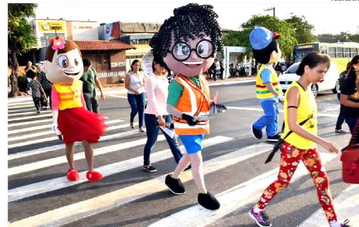
TURMA DO JOCA NA AÇÃO REALIZADA NA FAIXA DE PEDESTRE

Prevenir acidentes e informar sobre o uso da faixa pedestre é o foco da campanha educativa realizada pela gestão do prefeito Edivaldo em diversas avenidas da capital, de forma permanente. Na tarde de quarta-feira (21), equipes da Prefeitura de São Luís por meio da Secretaria Municipal de Trânsito e Transportes (SMTT), estiveram nas avenidas Daniel de La Touche, próximo ao shopping, e na Jerônimo de Albuquerque, nas proximidades do viaduto da Cohama. Acompanhados pelos mascotes da Turma do Joca, a equipe sensibilizou pedestres e também condutores de veículos. Com o tema 'No Trânsito Somos Todos Pedestres', na ocasião foram distribuídos ao público material informativo, cartazes e panfletos.