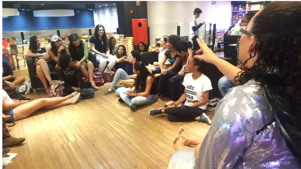
LEITORES TERÃO A OPORTUNIDADE DE CONHECER A OBRA DA ESCRITORA BRITÂNICA

Um teto todo seu (1929) é o romance onde está a famosa frase “Uma mulher deve ter dinheiro e um teto todo seu se ela quiser escrever ficção”. A obra de Virginia Woolf trabalha o feminismo com ousadia e de forma leve, com personagens são questionadas por serem do sexo feminino: enquanto homens são estimulados a desenvolver sua criatividade, mulheres cumprem um papel de submissão. Assim, o Clube propõe denunciar a falta de liberdade das mulheres para trabalhar como escritoras e a redução do papel delas na sociedade como um todo. Os encontros são gratuitos. No domingo dentro da programação da 12ª Felis (Feira do Livro de São Luís),