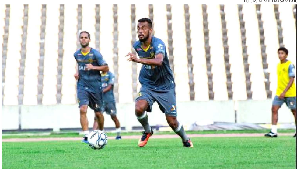
SAMPAIO FEZ ÚLTIMO TREINO ANTES DA VIAGEM PARA CRICIÚMA, SANTA CATARINA