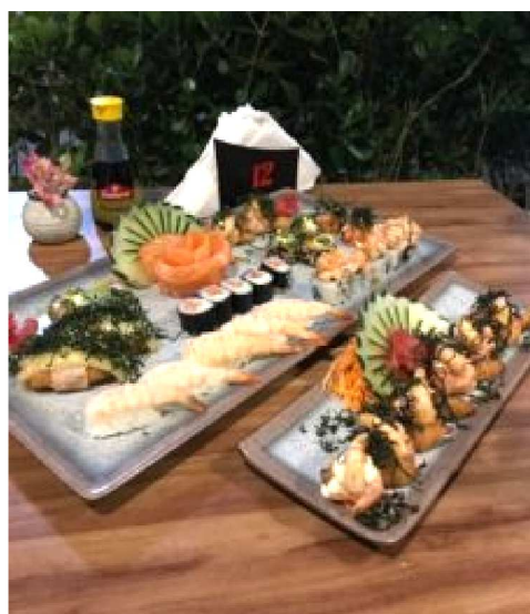
Nagoia com 30 peças. Serve duas ou três pessoas e custa R$ 109,00