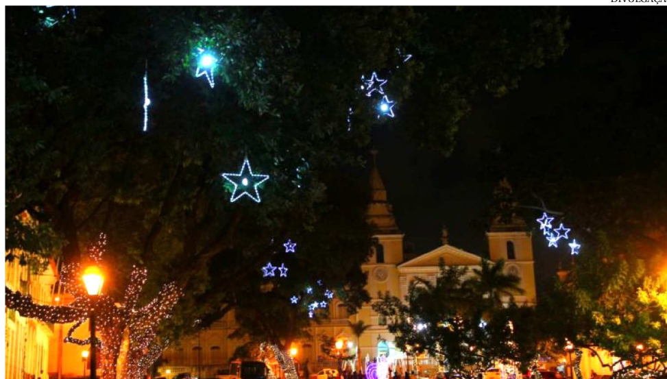
A CERIMÔNIA DE ABERTURA SERÁ DIA 1º DE DEZEMBRO, NO PALÁCIO DOS LEÕES

A Praça Pedro II será transformada em uma Vila Encantada, ambientada com diversos cenários que simbolizam o período natalino. As crianças poderão se divertir nas praças Soldadinho de Chumbo, Ursinhos Polares e Boneco de Neve, admirar a Casa do Papai Noel, a chuva de neve e as luzes da bola encantada.