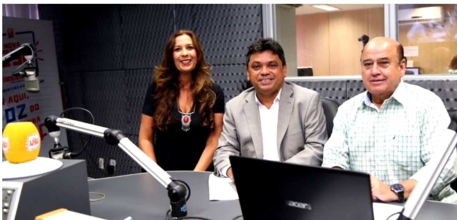
MÁRCIO JERRY CONCEDEU ENTREVISTA AO PROGRAMA CONTRAPONTO DA RÁDIO TIMBIRA

Eleito deputado federal com expressiva votação, o presidente estadual do PCdoB, Márcio Jerry, concedeu entrevista ao programa Contraponto da Rádio Timbira, na tarde desta quinta-feira (22), onde falou sobre o cenário nacional, as perspectivas políticas para os próximos anos e as expectativas para o primeiro mandato como parlamentar.