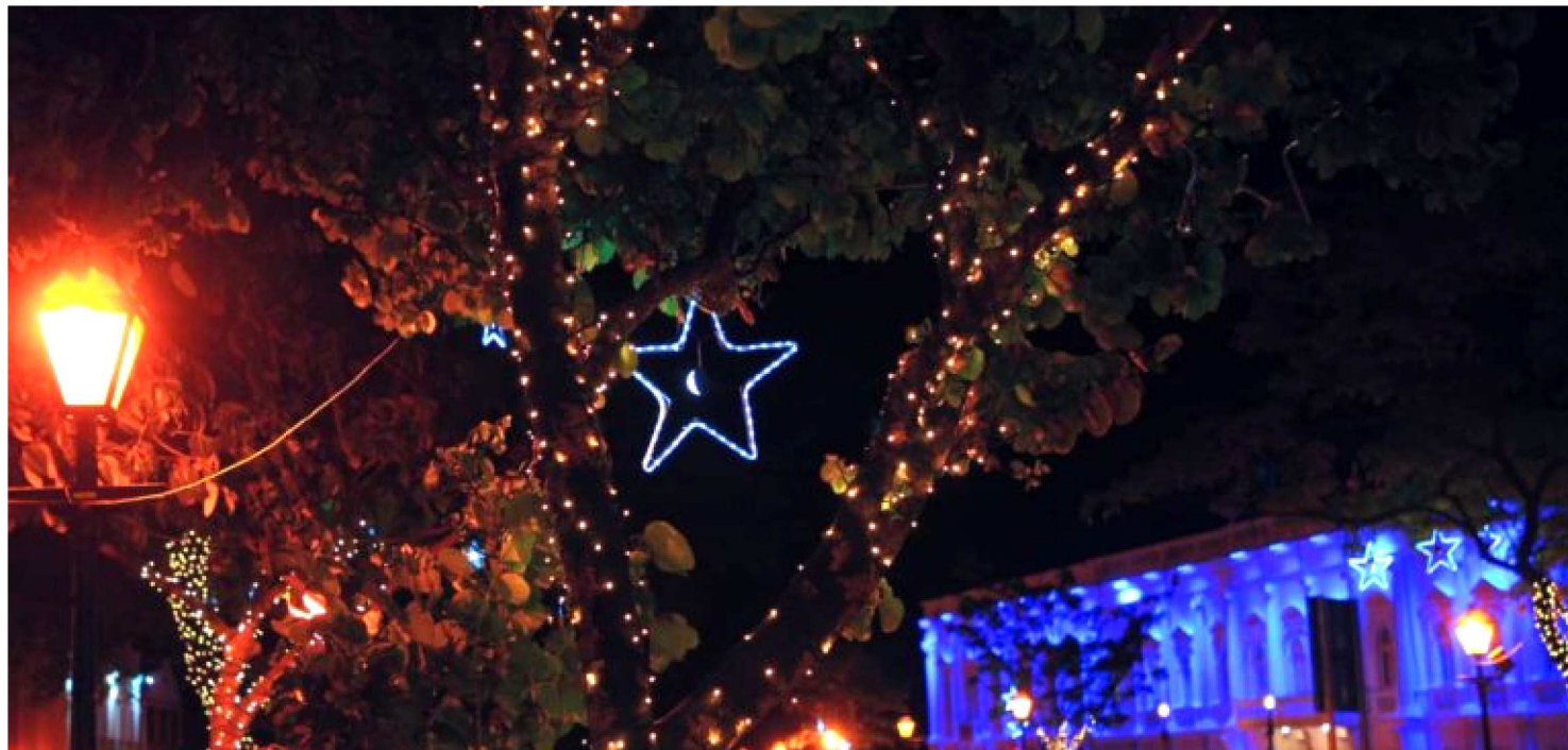
O ESPETÁCULO DE SONS, CORES E LUZES PROMETE SER UMA DAS GRANDES ATRAÇÕES DA VILA ENCANTADA