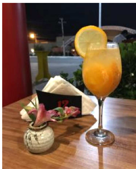
Para beber: um Gin tônico com tangerina