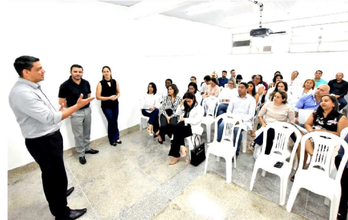
REUNIÃO DOS PROFISSIONAIS DO SÍRIO LIBANÊS E SOCORRÃO

Visando promover melhorias ao fluxo de pacientes, ao atendimento e aos processos administrativos, o Hospital Municipal Dr. Clementino Moura (Socorrão II) está recebendo o projeto 'Lean nas Emergências', ação criada pelo Ministério da Saúde para melhorar o atendimento em emergência de hospitais que atendem pelo Sistema Único de Saúde (SUS). A ação integra a política de saúde da Prefeitura de São Luís. A execução da ferramenta conta com o assessoramento técnico de especialistas do Hospital Sírio-Libanês, que estão esta semana em São Luís e realizaram reunião com profissionais do Socorrão II, oportunidade na qual contextualizaram os principais aspectos dessa metodologia de gestão e apresentaram o diagnóstico de desempenho operacional do hospital conforme estudo realizado pelo Sírio-Libanês na unidade.