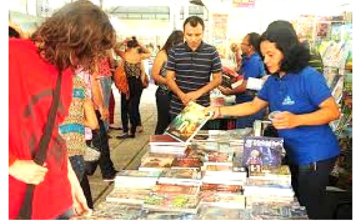
A 12ª FEIRA DO LIVRO DE SÃO LUÍS ENCERRA-SE NO DOMINGO

Com o intuito de fortalecer a leitura entre jovens e adolescentes na 12ª Feira do Livro de São Luís, foi lançada a campanha Juventude leitora e engajada , uma ação que promove o acesso ao livro e à literatura para crianças, adolescentes, jovens e de adultos. As ações de conscientização e sensibilização com o apoio de instituições de juventudes, culturais e feministas que fizeram a autogestão das ações de empoderamento e engajamento, que estão ocorrendo, no Espaço da Juventude.