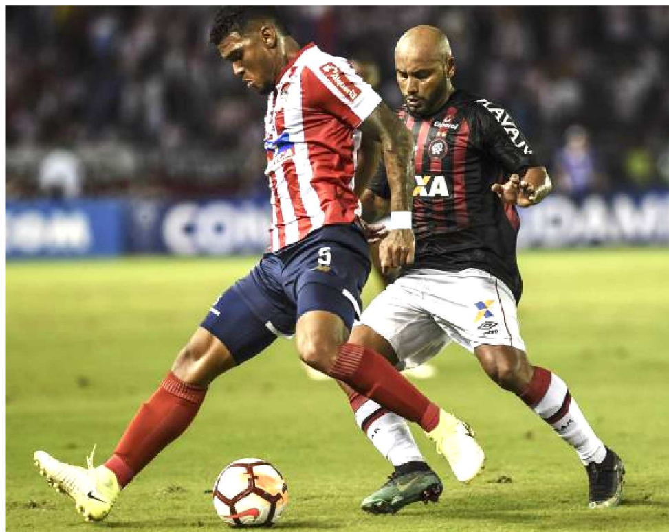
ATLÉTICO-PR FAZ HOJE O JOGO MAIS IMPORTANTE DO ANO, COM APOIO DA TORCIDA

que ainda não conseguiu conquistar um título continental, tendo como melhor campanha o vice-campeonato da Copa Libertadores em 2015, mas que tem um título da Série A do Campeonato Brasileiro vencido em 2001. Na atual temporada, a equipe já passou por cinco adversários, Newell's Old Boys, Peñarol, Caracas, Bahia e por último Fluminense. Dentro do seu estádio, está mantendo uma campanha muito boa, já que venceu quatro dos cinco jogos que disputou em