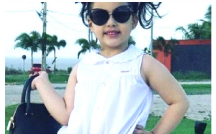
MINIDIVA CRYSTAL FREIRE SERÁ UMA DAS ATRAÇÕES

A Mini Miss Brasil it blogueira 2017, apresentadora de TV, atriz, modelo e fashion influencer Crystal Freire será a grande anfitriã de grandes personalidades hoje no Crystal Fashion Day , que acontece, a partir das 16h, nos salões nobres do Blue Tree Towers São Luís (antigo Hotel Quatro Rodas), no bairro do Calhau. A ideia é reunir em um só espaço moda, arte e cultura com a participação de grandes marcas e lojas locais e nacionais na passarela em um grande desfile.