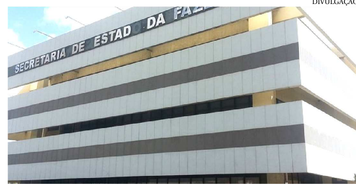
A FISCALIZAÇÃO COMEÇOU PELO POSTO DE TIMON

Equipes de agentes fiscais da Secretaria de Estado de Fazenda (Sefaz), do Posto Fiscal de Timon, na divisa com o estado Piauí, identificaram um esquema para evasão do Imposto sobre Circulação de Mercadorias e Serviços (ICMS) em vendas de grãos, especialmente de milho e milho, que saem em grande quantidade do Maranhão, para se converter em ração e abastecer as grandes granjas e criadores do Nordeste, utilizando supostas empresas atacadista do regime simples.