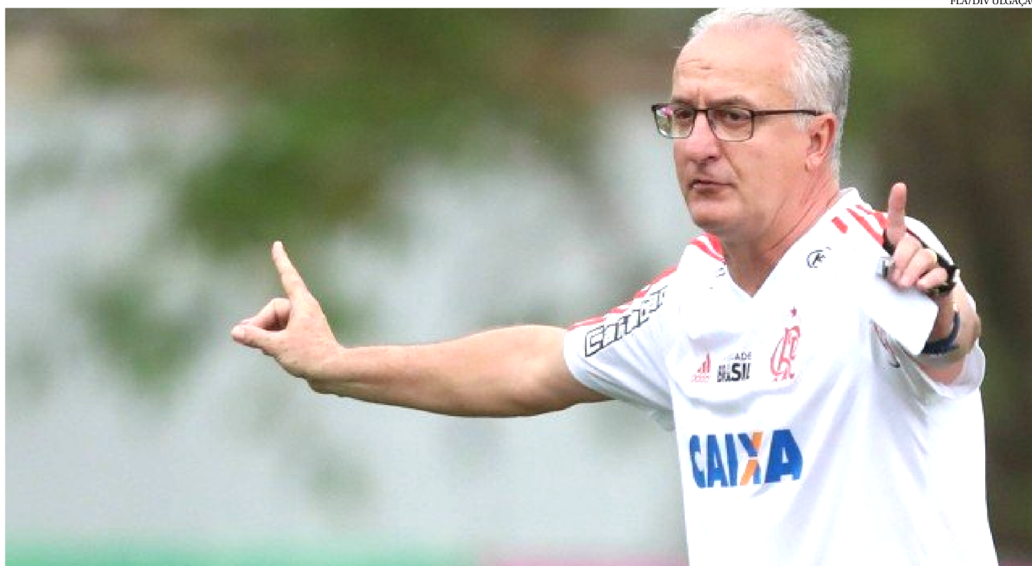
TÉCNICO DORIVAL JÚNIOR PROJETA UM FUTURO VITORIOSO PARA O FLAMENGO, QUE SERÁ COMANDADO POR ABEL EM 2019

Em entrevista ao canal “Fox Sports”, ontem, Dorival Júnior já falou em tom de despedida. O treinador – que, em duas passagens de 2013 e 2018, abriu e encerrou a gestão do presidente Eduardo Bandeira de Mello – agradeceu e diz deixar a Gávea com a sensação de uma “etapa cumprida”, e ainda projetou um futuro vitorioso do Flamengo em breve.