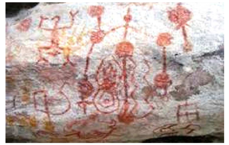
DATAÇÃO FOI COMPROVADA EM DIFERENTES LABORATÓRIOS

O sítio arqueológico da caverna de Pedra Pintada, na margem esquerda do Amazonas, a poucos quilômetros da cidade de Santarém (PA), revelou muito para a americana. Lá, habitaram sociedades complexas o bastante para produzir peças de cerâmica, um tipo de atividade que exige certo grau de diferenciação social e de especialização, característico de grupos que já dominam a agricultura.