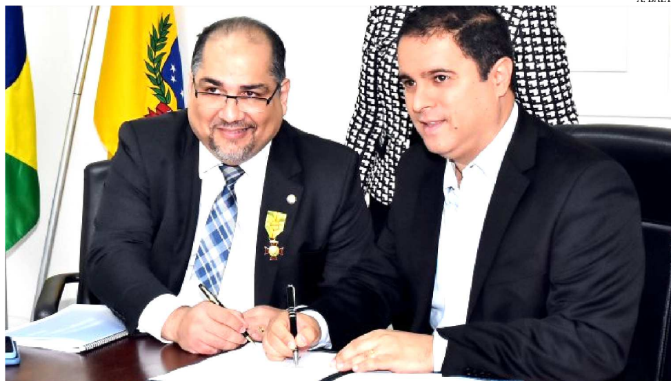
A META DO PROJETO É ATENDER SEIS MILHÕES DE PESSOAS ATÉ 2019