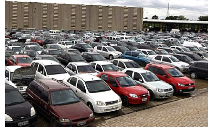
VEÍCULOS ESTÃO EM CONDIÇÃO DE RECUPERAÇÃO OU SUCATA