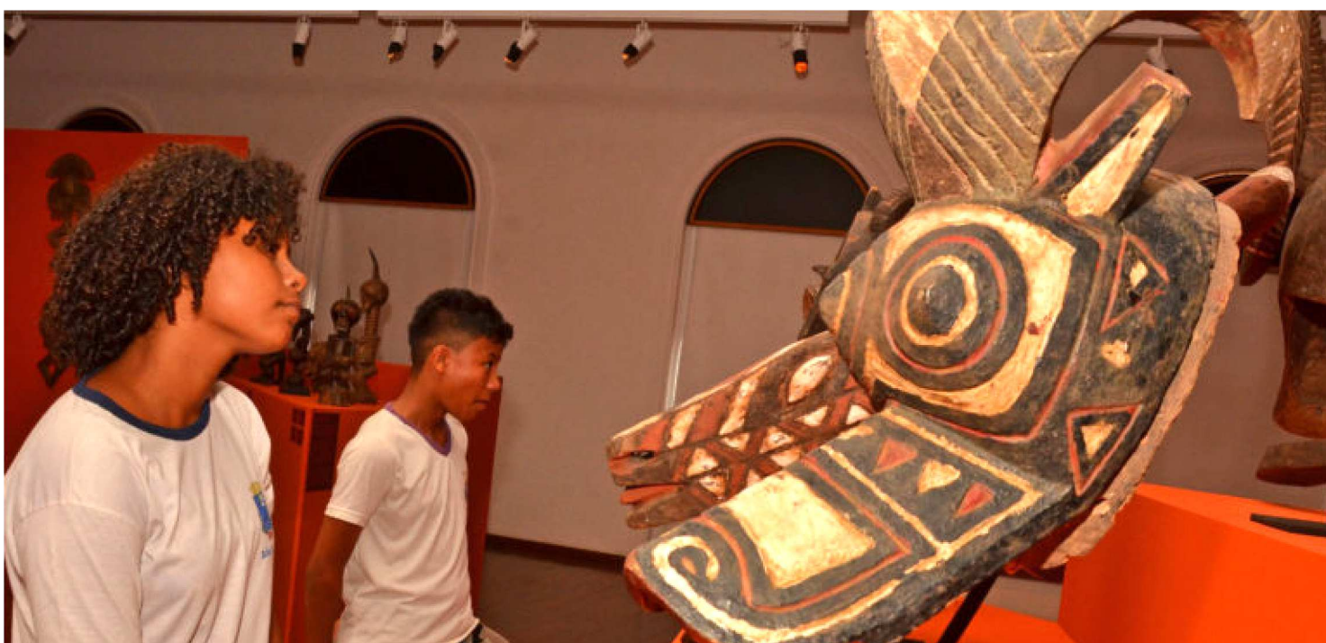
ESTUDANTES DA REDE PÚBLICA DA CAPITAL VISITARAM A EXPOSIÇÃO, QUE CONTA COM 196 PEÇAS REPRESENTANDO 60 POVOS