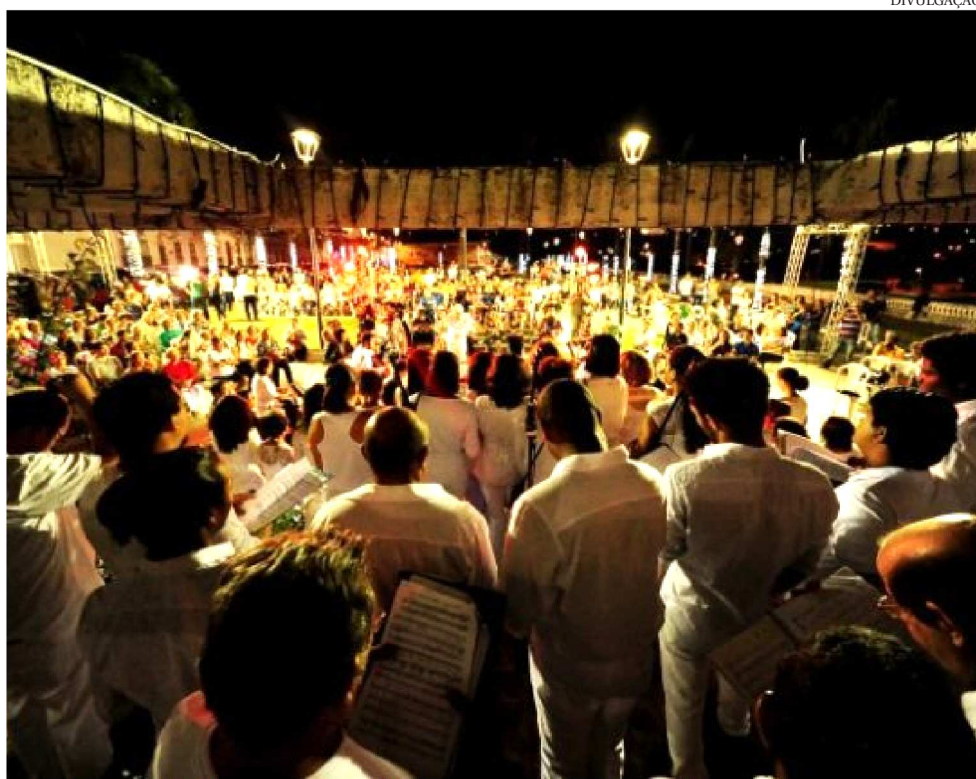
CANTATA VAI REUNIR NOVE GRUPOS DE CORAL NA PRAÇA GONÇALVES DIAS, DIA 18

"A Cantata Natalina 2018 da Ufma é um espetáculo de natal tradicional, muito emocionante, reservado às fa-