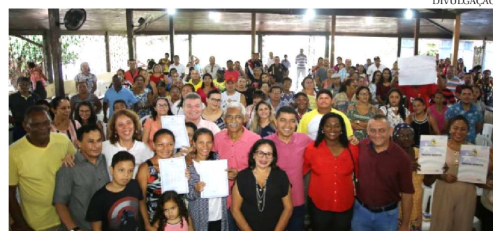
FORAM ENTREGUES MAIS DE 312 TÍTULOS DE PROPRIEDADES

Tendo a regularização imobiliária como uma das prioridades da gestão do Governo do Maranhão, foram entregues mais 312 títulos de propriedade, sábado (15), desta vez para famílias do Residencial Zumbi dos Palmares, em Paço do Lumiar. Ao total, já são aproximadamente 7 mil famílias da região metropolitana de São Luís beneficiadas, que agora já contam com a posse formal da propriedade.