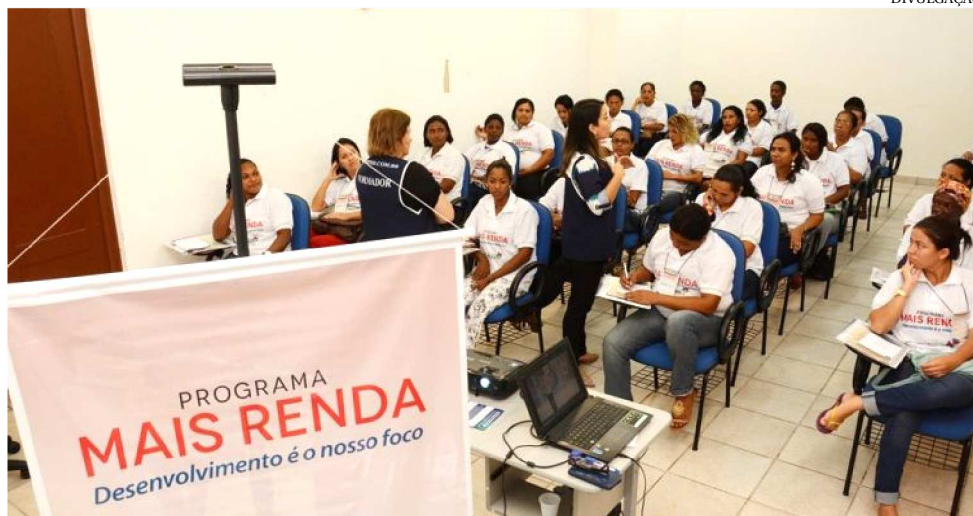
CAPACITAÇÃO PARA GERAÇÃO DE EMPREGO E RENDA À PRODUÇÃO AGRÍCOLA

Garantindo renda para agricultores familiares e alimento para comunidades carentes, o Programa de Aquisição de Alimentos (PAA) Leite já distribuiu, gratuitamente, cerca de três mi-