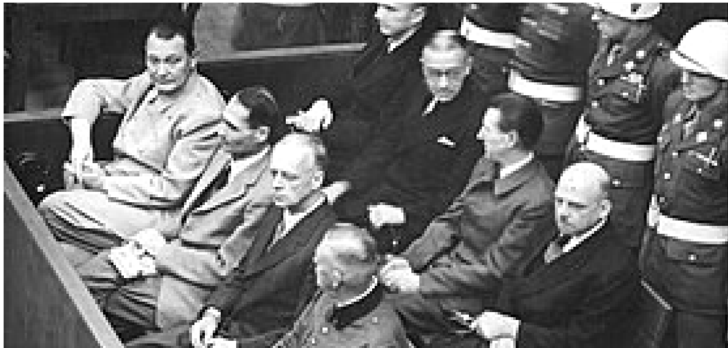
O TRIBUNAL DE NUREMBERG, NA ALEMANHA, FOI RESPONSÁVEL PELO JULGAMENTO DE GRANDES CRIMINOSOS DE GUERRA NAZISTAS