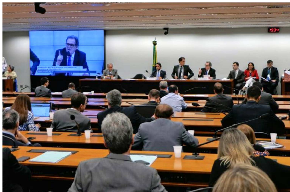
COMISSÃO APROVOU SALÁRIO MÍNIMO DE R$ 1.006 A PARTIR DE 1º DE JANEIRO DE 2019

O relator-geral explicou que foi estabelecido um limite de 40% do que o governo pode cortar de emendas parlamentares ou rubricas orçamentárias para direcionar a outros gastos. “Desta maneira, garantimos que um projeto que foi arduamente negociado dentro do Congresso não seja paralisado por uma manobra do Executivo”, disse Moka. O parecer aprovado traz duas novidades. Primeiro, amplia em R$ 600 milhões os recursos para o custeio da saúde. O dinheiro será usa-