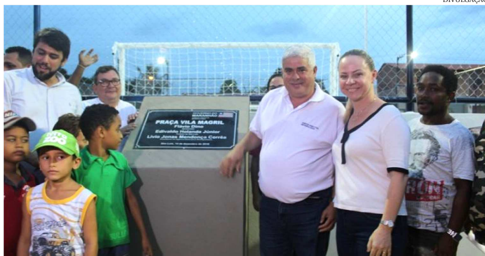
PARA A CRIAÇÃO DA PRAÇA, FOI PROMOVIDO UM ESTUDO PARA ESCOLHA DA ÁREA

A Praça Vila Magril está localizada na Rua São Jerônimo (esquina com as ruas Tamarindo e Laranjeiras), em uma área que, antes, servia como depósito de entulho e até sucatas (ferrovelho), propício ao acúmulo de água parada em períodos chuvosos e, consequentemente, um criadouro de mosquitos transmissores de doenças. “Apesar dessas limitações, o espaço era utilizado para reuniões e encon-