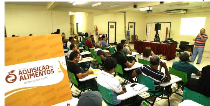
A FEIRA CAPACITOU MAIS DE 30,2 MIL PESSOAS

Conhecimento, orientação técnica e espaço de comercialização foram oferecidos a produtores rurais em 17 edições da Feira da Agricultura Familiar e Agrotecnologias do Maranhão (Agritec). A feira capacitou mais de 30,2 mil pessoas, gerou mais de R$ 1,5 milhão em comercialização da produção e mais de R$ 22 milhões em contratos com instituições financeiras.