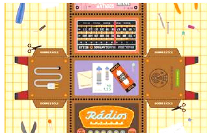
RÁDIOS ANTIGOS INSPIRARAM A ARTE DA EMISSÃO ESPECIAL

Os Correios colocaram em circulação a partir desde a última sexta-feira (14) a emissão especial Rádios Antigos . A peça filatélica tem tiragem de apenas 50 mil selos e traz um diferencial: o bloco, composto por quatro selos, foi idealizado para ser uma dobradura de papel (conhecida como paper toy), na forma de um rádio valvulado. O miniaparelho de rádio pode ser montado com uso de tesoura, cola (ou mesmo a goma do selo) e o próprio picote dos selos, constituindo uma metáfora para a prática do radioamadorismo, e sua tradição de montagem de equipamentos eletrônicos.