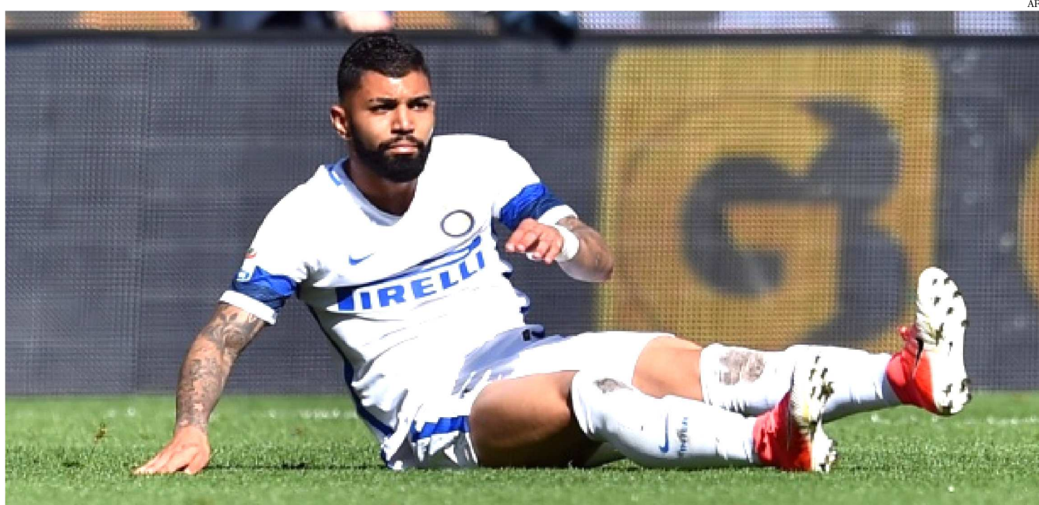
GABIGOL PODE SER ANUNCIADO NAS PRÓXIMAS HORAS COMO A PRIMEIRA GRANDE CONTRATAÇÃO DO FLAMENGO PARA 2019