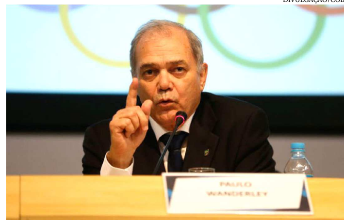
PAULO VANDERLEY, PRESIDENTE DO COMITÊ OLÍMPICO

O Comitê Olímpico do Brasil (COB) definiu a divisão dos repasses de recursos da Lei Agnelo/Piva (LAP) para as Confederações Brasileiras Olímpicas para 2019. Com uma estimativa de arrecadação de R$ 250 milhões (11,1% a mais do que em 2018), o COB repassará às Confederações ou investirá diretamente em atletas e equipes um total de R$ 194,3 milhões, o que significa um aumento de aproximadamente 15,2% em relação a 2018. Com isso, o COB investirá quase 80% da estimativa de arrecadação da LAP em ações esportivas, o mais alto patamar desde a criação da Lei, em 2001.