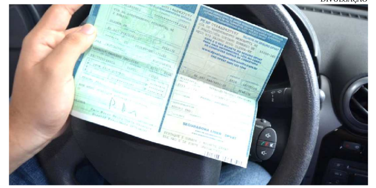
O PAGAMENTO PODE SER PARCELADO EM ATÉ TRÊS VEZES

A Secretaria de Estado da Fazenda lançou os valores do Imposto sobre Propriedade de Veículos Automotores (IPVA) do exercício de 2019 e divulgou o calendário de pagamento do tributo, conforme a Portaria 425/18.