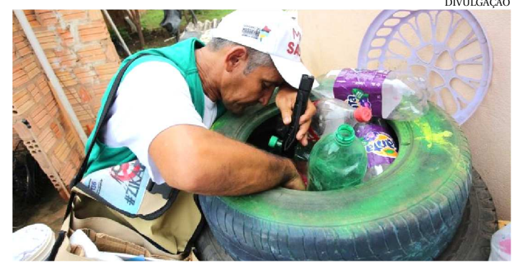
O COMBATE AO MOSQUITO VAI DURAR O ANO TODO

O combate ao mosquito Aedes aegypti deve durar o ano todo. Contudo, no período chuvoso é preciso intensificar os cuidados, principalmente nos imóveis residenciais para evitar que os ovos do mosquito, que necessitam de água parada, proliferem. O alerta é a Secretaria de Estado da Saúde (SES) à população neste período de chuvas. O mosquito é o principal transmissor da dengue, zika e chikungunya.