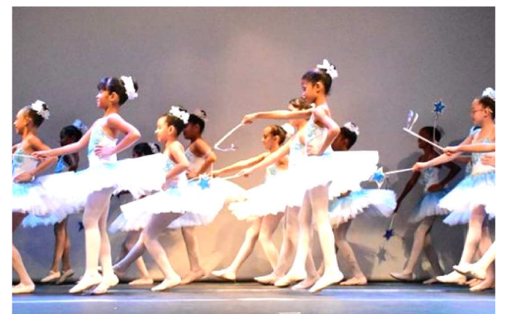
O BALÉ É UMA DAS ATIVIDADES OFERECIDAS PELA INSTITUIÇÃO

Quer iniciar o ano de 2019 aprendendo novos movimentos, se exercitando ou até perdendo a timidez com o desenvolvimento de seu lado artístico? O Sesc, mais um ano, lança vagas para os cursos livres de Teatro e Dança, incluindo: Iniciação Teatral, Dança de Salão, Danças Urbanas, Dança Contemporânea, Ballet e Performance em Dança. Os interessados devem inscrever-se de 14 a 31 de janeiro, na Central de Relacionamento com Clientes, no Sesc Centro, das 7h30 às 12h e das 14h às 18h30. Já para quem pretende se rematricular, o período é de 2 a 11 de janeiro. As vagas são destinadas a crianças, adultos e idosos e as inscrições são gratuitas, exceto para o curso de Dança de Salão.