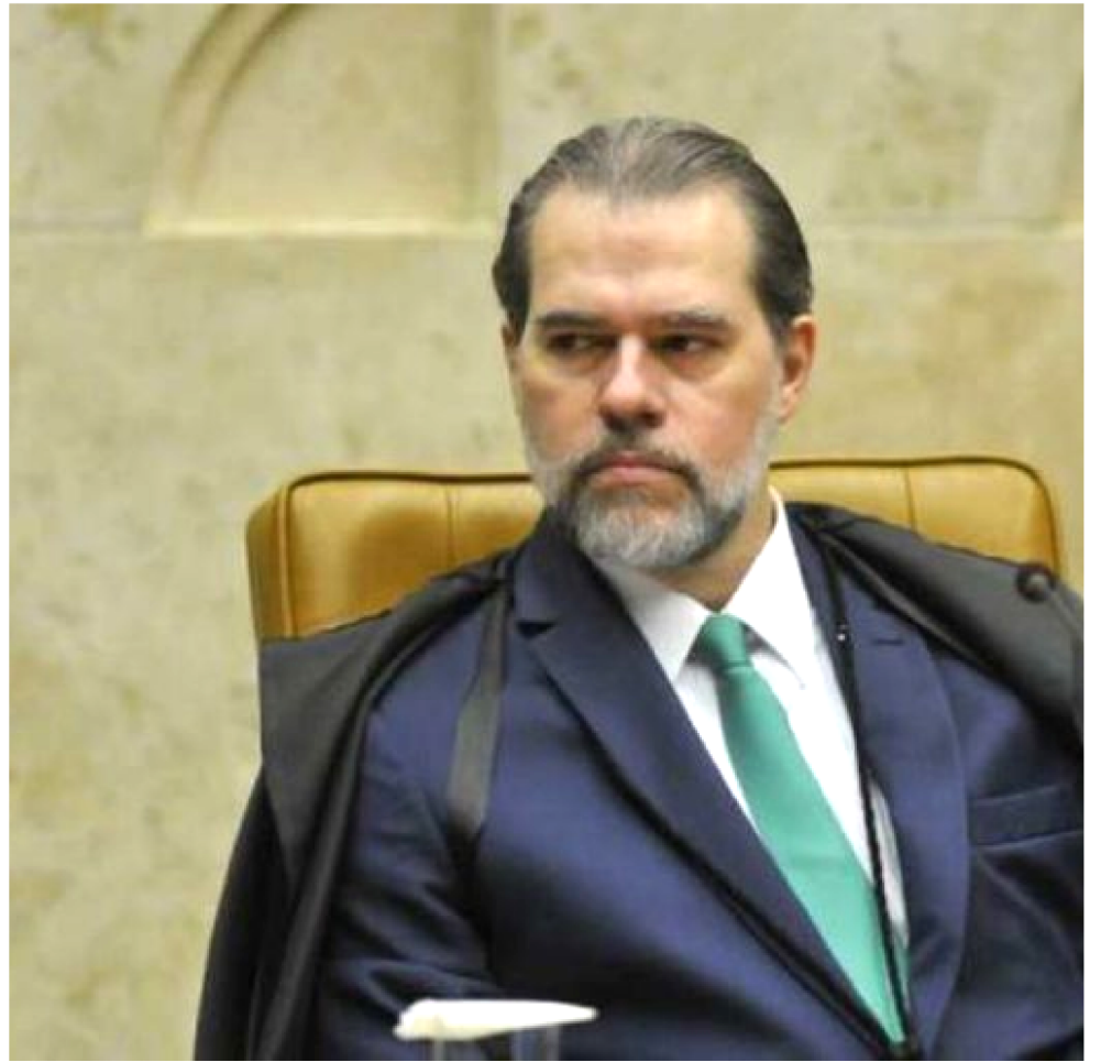
DIAS TOFFOLI DISSE QUE O ASSUNTO JÁ ESTÁ NA AGENDA PARA O PROXIMO ANO

Raquel Dodge afirmou que, se colocada em prática, a soltura de presos poderia ser irreversível. Ela alegou que, em diversas ocasiões, o Supremo já decidiu ser constitucional a execução antecipada da pena.