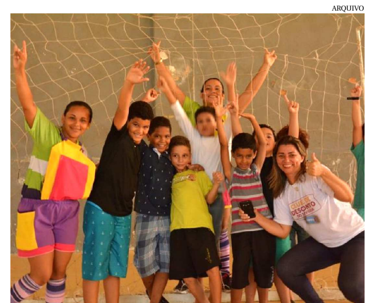
CRIANÇAS DEVEM SER FILHAS DE SERVIDORES DO ESTADO

A 6ª edição da Colônia de Férias para filhos de servidores públicos do Estado está em sua última semana de inscrições. Iniciado no dia 5 de dezembro, o período de inscrição se estende até esta sexta-feira (21), das 9h às 17h, no hall do Edifício Clodomir Milet, no Centro Administrativo do Estado – CAE (Avenida Jerônimo de Albuquerque, s/n, Calhau).