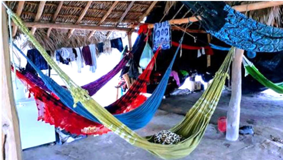
O GRUPO ESTAVA ALOJADO EM BARRACAS DE PLÁSTICO E USAVA A MATA DE BANHEIRO