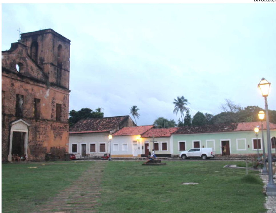
PROJETO TEM SISTEMA MODERNO DE ILUMINAÇÃO QUE RESSALTA O CENTRO HISTÓRICO

Com este projeto, a história de Alcântara já está brilhando ainda mais forte, pois o nível de iluminação aumentou, acarretando uma melhoria nos níveis de segurança e a padronização do sistema de iluminação cênica. Agora a cidade pode comemorar com muita energia os seus 370 anos no próximo dia 22 de dezembro.