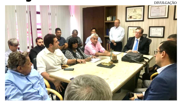
O IMPASSE ENTRE RODOVIÁRIOS E PATRÕES DUROU 4 MESES

Em audiência de negociação realizada ontem no Tribunal Regional do Trabalho, entre rodoviários e empresários, ficou acertado o reajuste de 7%, que será concedido aos trabalhadores, a partir do próximo mês de janeiro. Além disso, a categoria conseguiu a garantia de manutenção da função de cobrador e mais a disponibilização integral do plano de saúde.