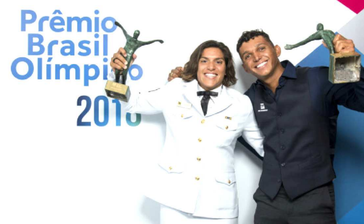
ANA MARCELA E ISAQUIAS FORAM DESTAQUES DO ESPORTE

Campeã do circuito mundial de maratona aquática e eleita pela quinta vez a melhor do planeta na modalidade, Ana Marcela Cunha foi eleita o destaque feminino do Prêmio Brasil Olímpico. No masculino, Isaquias Queiroz foi eleito o melhor atleta masculino pelo terceira vez na carreira. Em 2018, o canoísta conquistou mais três medalhas em Campeonatos Mundiais, chegando a dez na história da competição. Em Montemor-o-Velho, foi ouro no C1 500m e no C2 500 metros, ao lado de Erlon Souza, e o bronze na prova olímpica de C1 1000m.