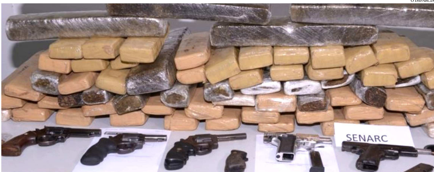
O CENÁRIO DO TRÁFICO, RECEBIDO NA ATUAL GESTÃO, EXIGIU QUE FOSSEM COLOCADAS EM PRÁTICA INTERVENÇÕES MAIS FIRMES

Nos últimos quatro anos, o trabalho articulado da Secretaria de Estado de Segurança Pública (SSP-MA) resultou no controle e prevenção ao tráfico de drogas. Um dos marcos para esse saldo positivo foi a implantação da Superintendência Estadual de Repressão ao Narcotráfico (Senarc) que foi qualificando para se especializar na investigação desse tipo de crime. No período, a Senarc apreendeu mais de 13 toneladas de entorpecentes, o que representa R$ 35,9 milhões de prejuízo aos traficantes.