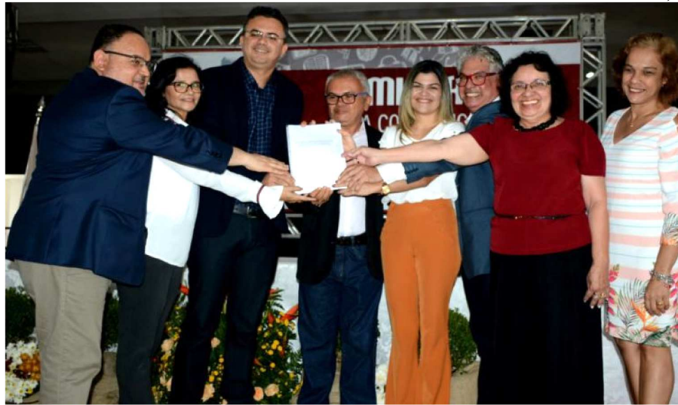
O ATO ACONTECEU DURANTE SEMINÁRIO NO CENTRO DE CONVENÇÕES DA UFMA