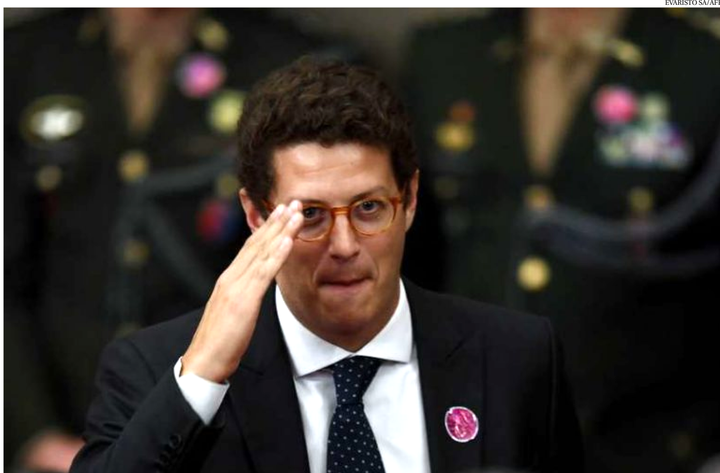
RICARDO SALLES AFIRMOU QUE IRÁ ESTUDAR A DECISÃO COM SEUS ADVOGADOS E, POSSIVELMENTE, RECORRER

O advogado Ricardo Salles (Novo), futuro ministro do Meio Ambiente no governo do presidente eleito, Jair Bolsonaro (PSL), foi condenado por improbidade administrativa no fim da tarde de quarta-feira, 19.