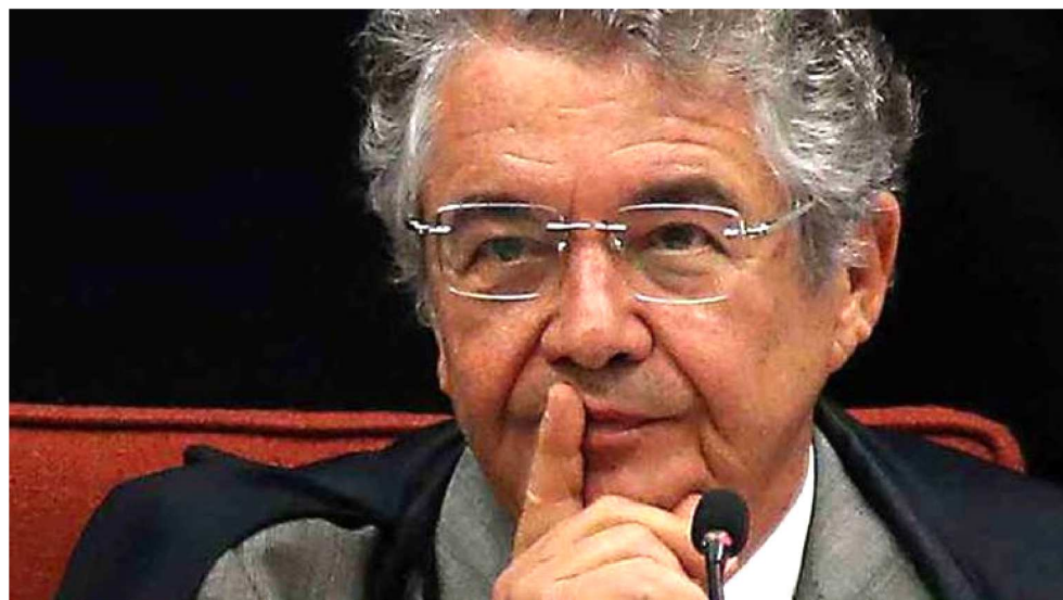
“DEPOIS DE 40 ANOS DE TOGA, NÃO POSSO CONVIVER COM MANIPULAÇÃO DA PAUTA”

Ao Estadão/Broadcast, Marco Aurélio disse que não informou previamente a Toffoli sobre a decisão que suspendeu a possibilidade de prisão após condenação em segunda instância. A liminar concedida abria caminho para a soltura do ex-presidente Luiz Inácio Lula da Silva (PT), preso e condenado no âmbito da Operação Lava-Jato. “Eu tenho de avisar alguém? O que é isso? Vamos respeitar as instituições pátrias, as decisões são autoexplicativas”, afirmou o ministro à reportagem. Indagado sobre a tendência de