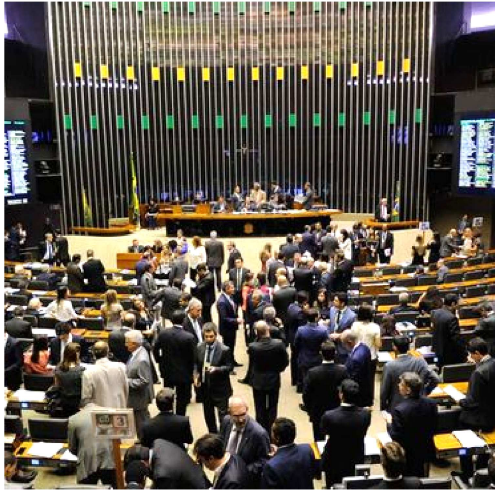
O SENADO FEDERAL AUTORIZOU O MARANHÃO CONTRAIR O EMPRÉSTIMO COM O BID

A carência para o início de pagamento do empréstimo será de 66 meses (cinco anos e meio) e a amortização da dívida será de 234 meses (19