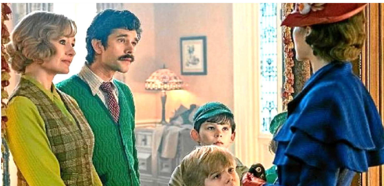
A NOVA VERSÃO DA BABÁ INGLESA MARY POPPINS TEM COMO ATRIZ PRINCIPAL EMILY BLUNT, ALÉM DE UMA TRILHA SONORA ORIGINAL

"Será que as pessoas vão me aceitar?" Essa foi a maior dúvida que desde o início do projeto de O retorno de Mary Poppins acompanhou a atriz Emily Blunt (de O diabo veste Prada ). Ela decidiu abraçar a personagem dos estúdios Disney que é das mais amadas dos cinéfilos com mais de 40 anos: a babá Mary Poppins (eternizada pela ganhadora do Oscar Julie Andrews). A dúvida da aceitação de Blunt começa a ser desfeita pela chegada, hoje, às telas, da senhorita vaidosa, engraçada, estilosa e otimista. Ela convive com uma problemática família inglesa que leva o sobrenome de muitos personagens do clássico filme de 1964 — os Banks.