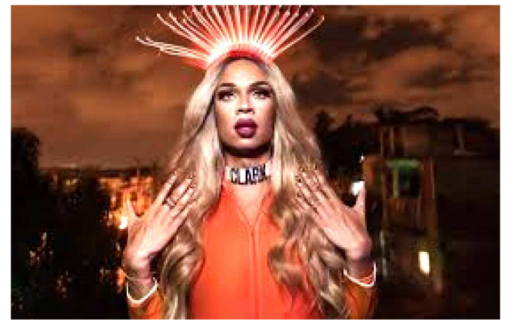
LIA CLARK VOLTA À ILHA APÓS OUTRAS EDIÇÕES DA FESTA

Outra atração confirmada no Réveillon do Vem Pro Rolê é Lia Clark. A cantora ganhou notoriedade nacional após o lançamento do single Trava trava , em 2016, quando ganhou o título de artista revelação pela MTV. Dentre os sucessos, estão as músicas Chifrudo e, mais recentemente, Bumbum no ar , em parceria com a cantora Wanessa. No youtube, a cantora soma milhões de visualizações em seus clipes, conquistando o público por onde passa. Inclusive já participou de outras edições da Hello. "Nunca imaginei que atingiria as pessoas do Brasil inteiro", afirmou a artista, que lançou a canção sem pretensões. Com o sucesso do single, a demanda pelo trabalho de Clark rapidamente cresceu, e a artista tornou-se uma das expoentes do movimento drag no Brasil. Lia tem como sua principal influência a rapper americana Nicki Minaj, tendo ainda outras referências como Britney Spears, Christina Aguilera, Beyoncé, Dev, além das brasileiras Anitta e Kelly Key.