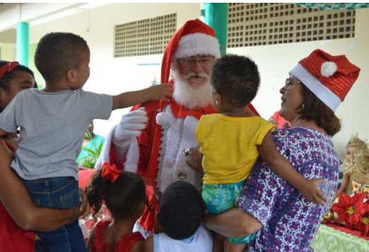
Acolhidos participam de Ceia Natalina VIDA