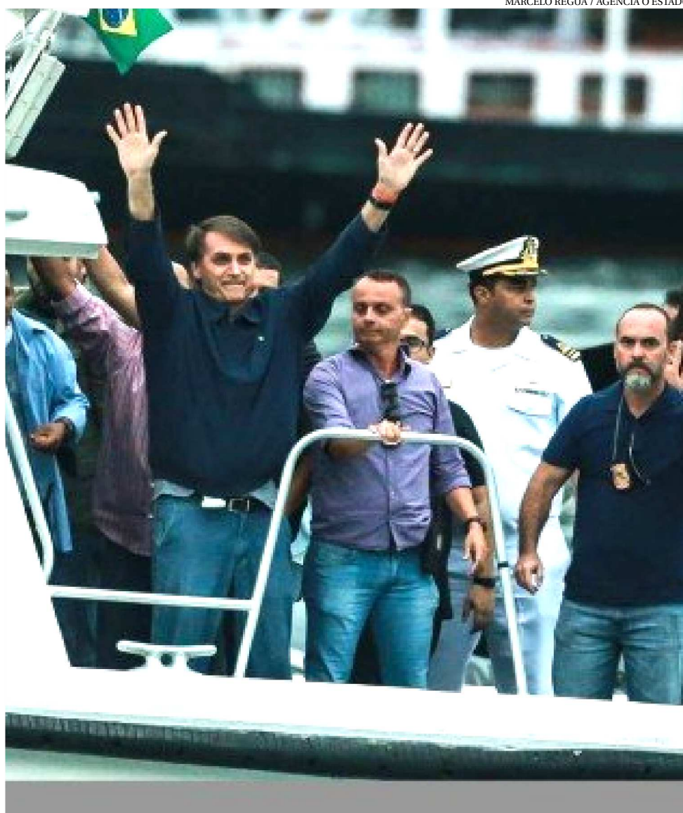
JAIR BOLSONARO VOLTA À BASE MILITAR DA RESTINGA DA MARAMBAIA

Marambaia também foi o destino de Michel Temer e sua família no carnaval deste ano. Já os ex-presidentes