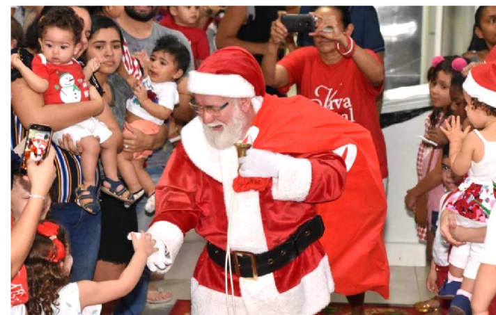
PAPAI NOEL DISTRIBUI PRESENTES PARA AS CRIANÇAS

Um dos eventos do calendário fixo da Academia Viva Água, e que se tornou tradição entre alunos, familiares e funcionários, é o Viva Natal, que aconteceu na última quarta-feira (19), às 17h, nas instalações da academia, no Renascença II.