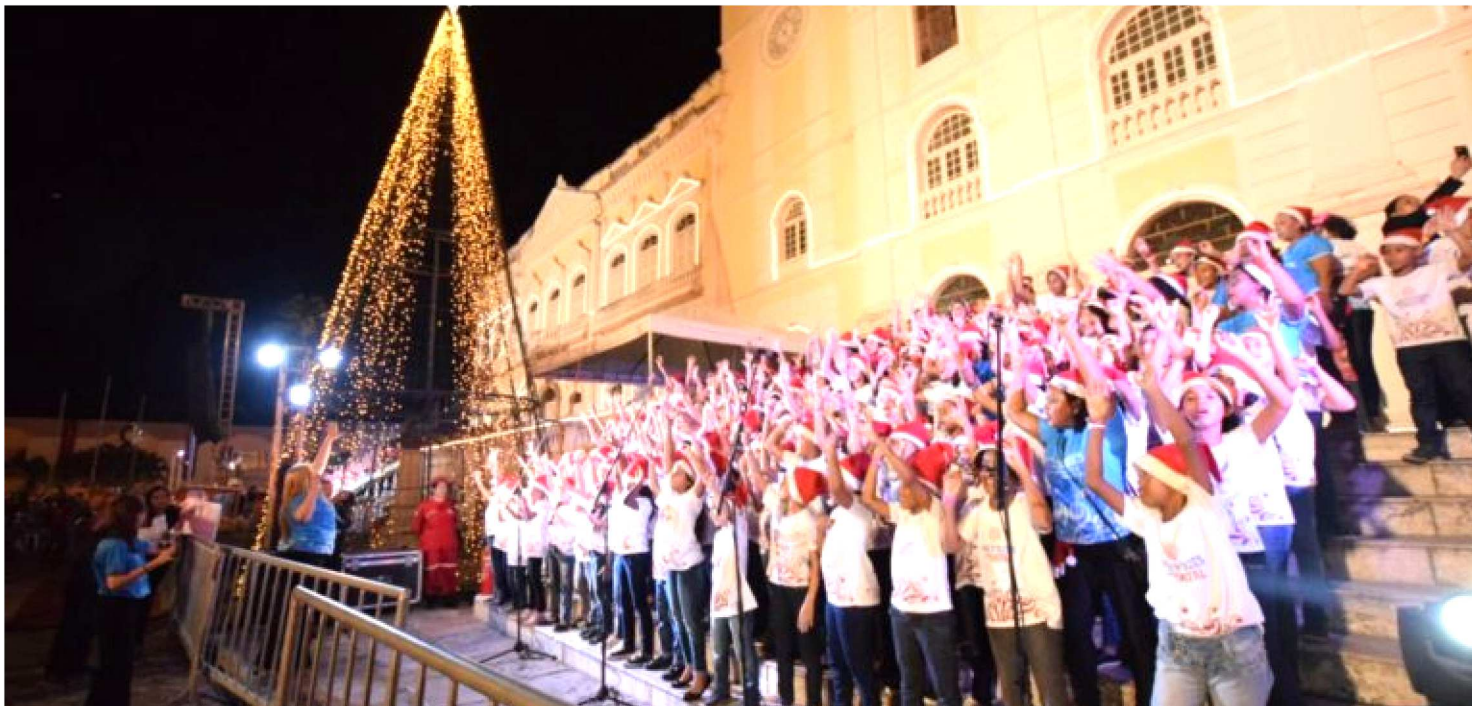
CANTATA NATALINA CONTOU COM A PARTICIPAÇÃO DE ESTUDANTES DA REDE MUNICIPAL DE DIFERENTES ESCOLAS DE SÃO LUÍS