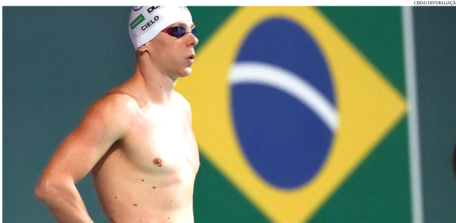
CIELO AINDA VAI PENSAR COM CALMA SOBRE SEU FUTURO, MAS PROVAVELMENTE ADIARÁ APOSENTADORIA DA NATAÇÃO BRASILEIRA

O nadador César Cielo voltou do Mundial de Piscina Curta em Hangzhou, na China, com duas medalhas no peito e chegou a 19 pódios na carreira em Mundiais, um recorde nacional. Apesar do feito, o atleta do Clube Pinheiros explicou que vai pensar com calma sobre seu futuro nas piscinas e ainda não crava aposentadoria.