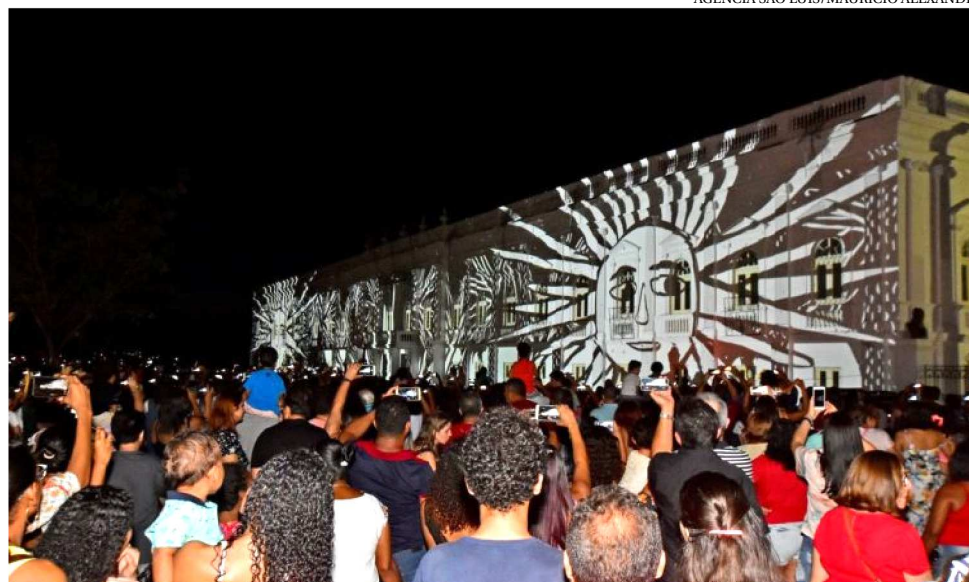
PROGRAMAÇÃO E ATRAÇÕES NA PRAÇA PEDRO II VEM ATRAINDO CENTENAS DE PESSOAS

Na Igreja da Sé, Catedral Metropolitana, a missa do Advento, a 4ª do mês de dezembro, acontece às 10h. Às 19h haverá a solenidade do Natal do Senhor, com presépio vivo. É a tradicional Missa do Galo, a missa do nascimento do Senhor. No dia 25, às 17h30 a solenidade acontece novamente. No dia 2, às 15h, tem Adoração ao Santís-