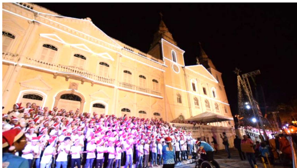
CANTATA NATALINA ACONTECEU EM FRENTE À IGREJA DA SÉ, NA PRAÇA PEDRO II

“O mês de dezembro chegou e com ele a programação natalina e hoje estamos aqui participando desse momento especial, com apresentação de