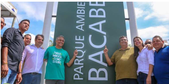
Município de Bacabeira ganha parque ambiental VIDA