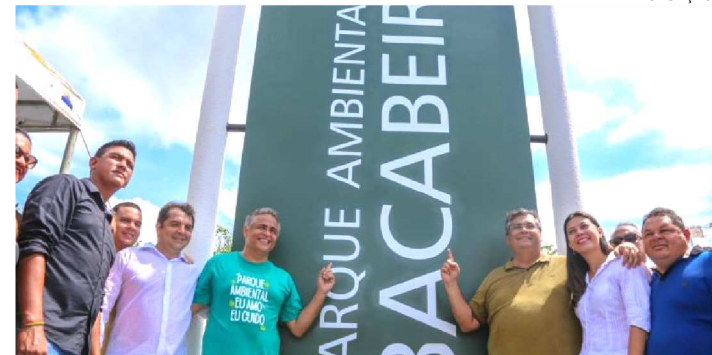
O LOCAL TEM PLAYGROUND, ACADEMIA, PISTA DE CAMINHADA

Bacabeira entrou, sexta-feira (21), para a lista das cidades maranhenses com grandes parques ambientais. A entrega do espaço foi feita pelo governador Flávio Dino e o secretário de Estado de Meio Ambiente, Marcelo Coelho. O parque une preservação, lazer e diversão. Fica ao lado do Centro de Convenções do município.