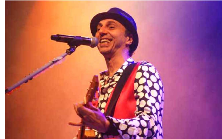
ZECA BALEIRO É ATRAÇÃO DO RÉVEILLON DE TODOS

A programação do Réveillon de Todos 2018 em São Luís ganhou muito mais atrações. Em vez de uma noite, agora vão ser seis noites. O anúncio foi feito pelo governador Flávio Dino, que também revelou que a programação do Natal de Todos vai ser ampliada.