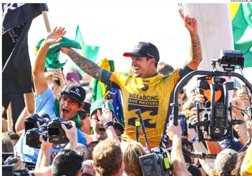
MEDINA É RECEBIDO POR FÃS, FAMILIARES E JORNALISTAS EM GUARULHOS-SP

Primeiro campeão brasileiro na história do Mundial de Surfe, em 2014, Gabriel Medina voltou a repetir o feito em 2018. Nascido em São Sebastião, em São Paulo, o surfista começou a subir nas pranchas aos nove anos de idade e aos 12 já competia em nível nacional e venceu vários campeonatos pelo país. Em 2015 e 2017, Me-