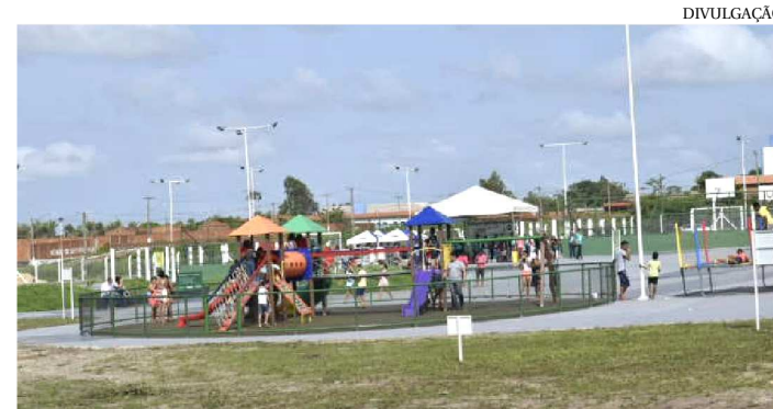
PARQUES SÃO IMPORTANTES ESPAÇOS DE LAZER E ESPORTE

Sociabilidade, integração com o meio ambiente, atividades físicas e práticas esportivas. São algumas das funções dos quatro Parques Ambientais entregues pelo governador Flávio Dino no Maranhão. Eles compõem uma marca de gestão comprometida com a preservação do meio ambiente e a valorização da convivência em espaços públicos.