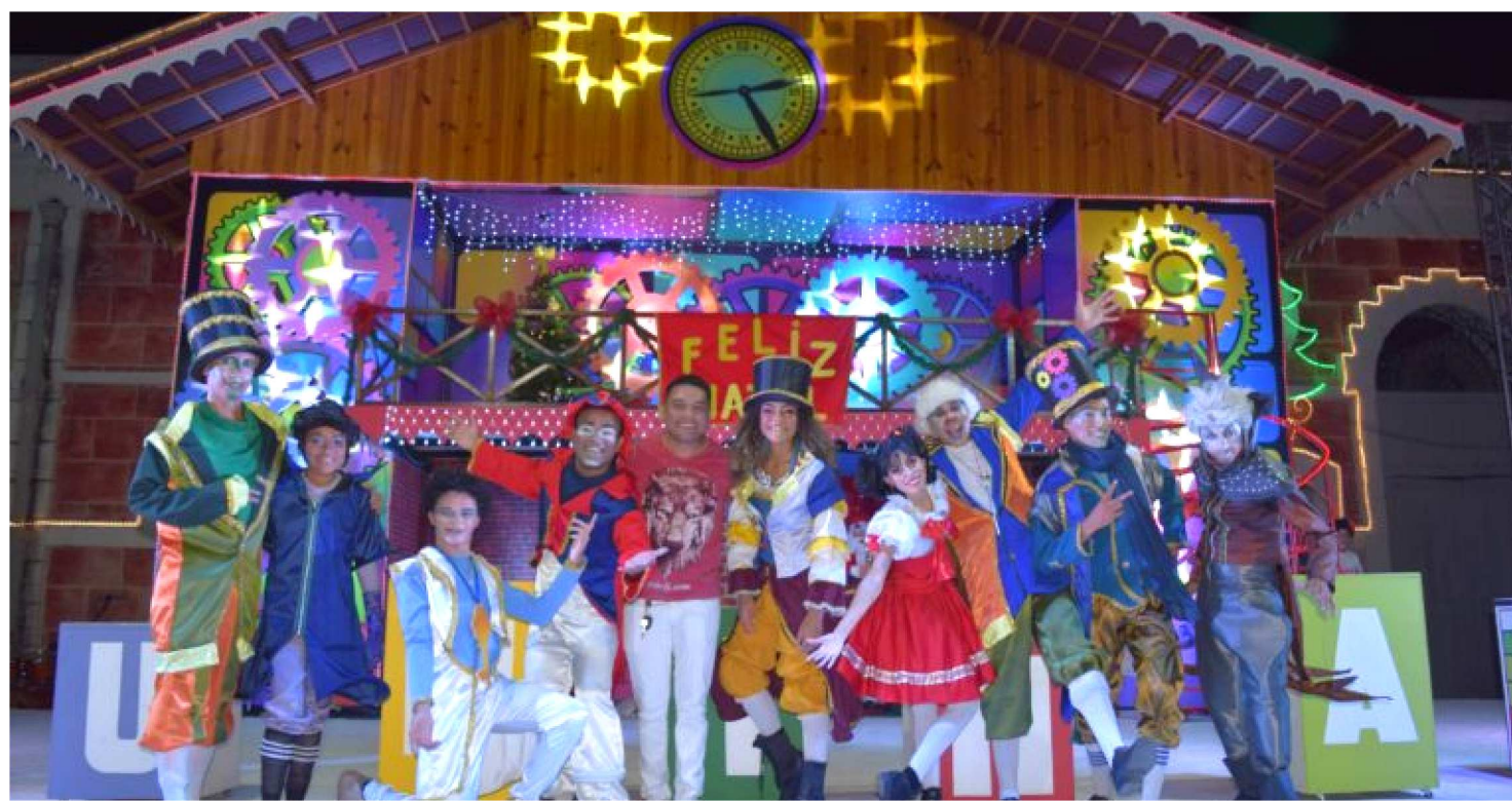
PROGRAMAÇÃO DO NATAL ILUMINADO EM CAXIAS VAI ATÉ O DIA 5 DE JANEIRO COM A PARTICIPAÇÃO DE DIVERSOS ARTISTAS

Quem for a Caxias até 5 de janeiro, vai se contagiar com a atmosfera do Natal, espalhada por toda a cidade, e poder assistir às inúmeras apresentações ainda previstas para a temporada, como parte da programação do Natal Iluminado, maior evento natalino do nordeste a céu aberto, que se estende de novembro a janeiro.