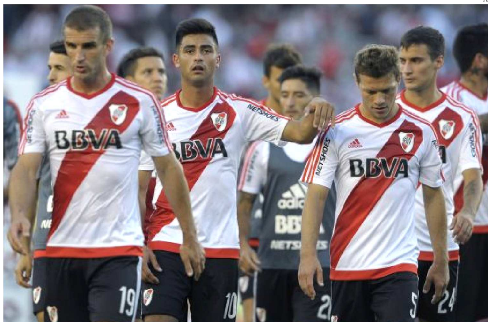
RIVER PLATE FICOU APENAS COM A TERCEIRA COLOCAÇÃO NO MUNDIAL DE CLUBES

A América do Sul não ganha a Copa do Mundo desde 2002. Os últimos campeonos ficaram com Itália (2006), Espanha (2010), Alemanha (2014) e França