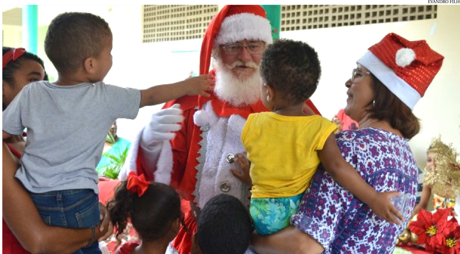
UM DOS PONTOS ALTOS DO EVENTO FOI A PRESENÇA DO PAPAÍ NOEL, QUE FEZ A ALEGRIA DA CRIANÇA COM MUITOS PRESENTES

Muita emoção e solidariedade marcaram as festividades natalinas dos acolhidos nos abrigos da Prefeitura de São Luís. Crianças, adolescentes, adultos e idosos que moram nas Unidades de Acolhimento Institucionais Casa de Passagem, Residência Inclusiva, Casa de Acolhida Temporária e Abrigo Luz e Vida participaram, na quinta-feira (20), de uma Ceia de Natal para celebrar a chegada das festividades de fim de ano. Brincadeiras, show de mágica, poesias e músicas, animaram os acolhidos, que aproveitaram o momento de lazer e diversão para sair um pouco da rotina. Um dos pontos altos do evento, foi a presença do Papai Noel que fez a alegria da criança com muitos presentes.