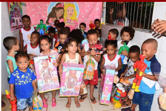
Campanha Natal Feliz do Sesc distribui brinquedos IMPAR