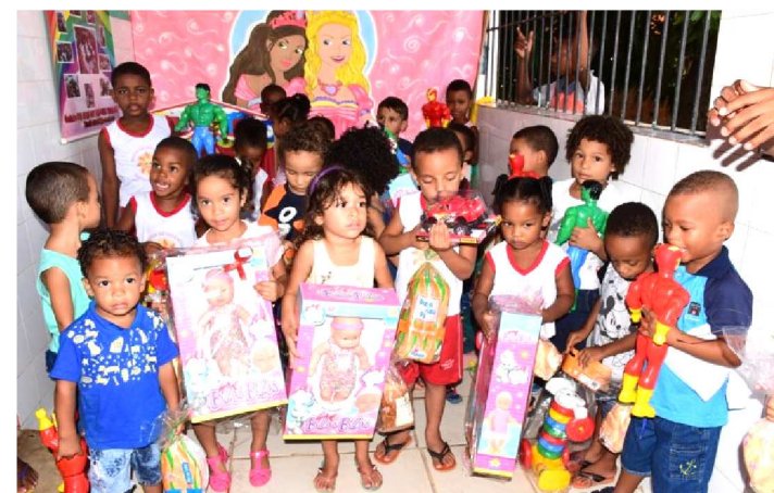
UM TOTAL DE 247 CRIANÇAS RECEBERAM PRESENTE DE NATAL

A solidariedade é o combustível que move o Programa Mesa Brasil durante todo o ano, e neste Natal o Programa contou com apoio de funcionários, clientes e parceiros do Sesc na Campanha Natal Feliz, que angariou brinquedos novos e seminovos para doação a entidades assistidas pelo programa. A distribuição dos 247 brinquedos foi realizada com muita alegria nesta quinta e sexta-feira, dias 20 e 21 de dezembro, em quatro entidades sociais da capital.