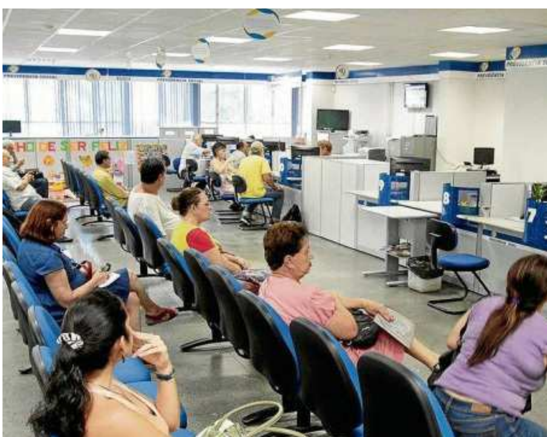
Quem teve o nome publicado no edital deve agendar a perícia pela Central de Atendimento da Previdência

O edital de notificação faz parte do pente-fino que o governo federal realiza, desde agosto de 2016, nos benefícios pagos pelo INSS ao cidadão incapacitado de trabalhar. O programa de revisão está em sua segunda etapa. O MDS, pasta à qual o INSS é vinculado, planeja realizar 1,2 milhão de avaliações médicas até o fim deste ano. Ontem, segundo o ministro Alberto Beltrame (MDS), o governo convocou para perícia beneficiários que precisam passar pelo exame obrigatório e não foram localizados em razão