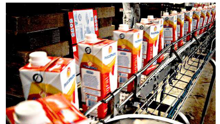
Com a expansão da unidade, outros produtos também serão fabricados