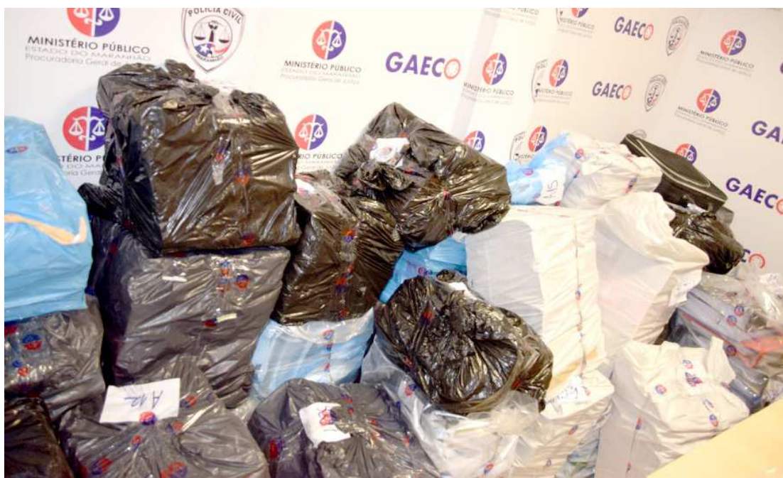
Documentos apreendidos durante operação conjunta do MPMA e da Seccor serão analisados pelo Gaeco