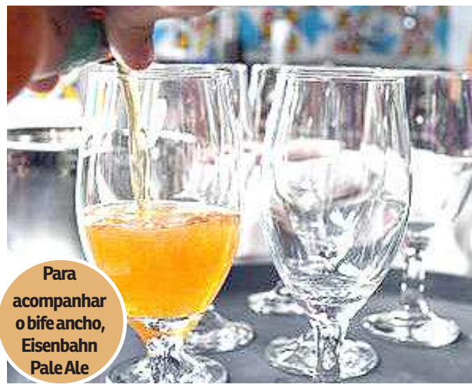
Para acompanhar o bife ancho, Eisenbahn Pale Ale

Saiba combinar a sua carne do churrasco com uma cerveja especial para aproveitar o fim de semana com a família