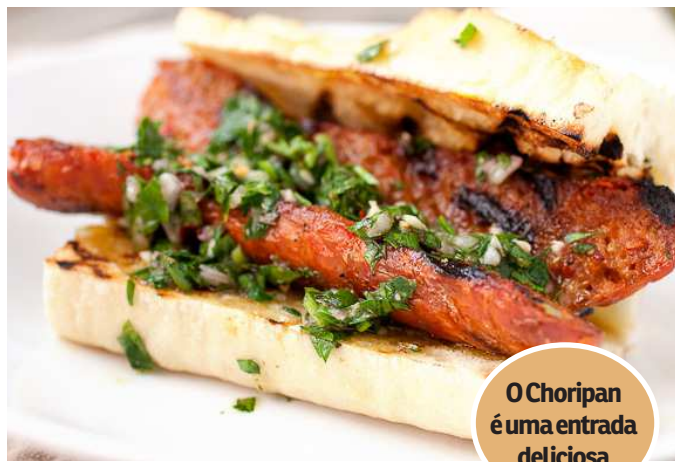
O Choripan é uma entrada deliciosa