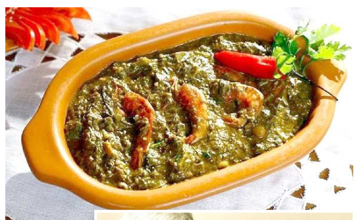
No detalhe, mãe de Caetano Velloso, Dona Canô, preparando o prato típico feito com folhas de taioba

extremamente sofisticadas, as receitas são um retrato da cultura alimentar do recôncavo baiano, onde as moquecas e vatapás não podem faltar. Também não poderiam faltar temperos como o azeite de dendê, pimenta, e, é claro, o sal, um dos protagonistas desse enredo, já que, de acordo com a matriarca, saber usar o sal é um dom.