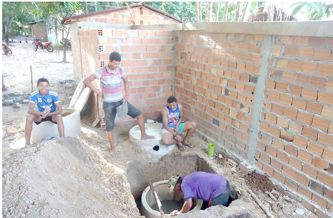
Na capital do estado, 69,7% dos domicílios têm rede geral ou fossa ligada à rede

Em São Luís, esse percentual era de 28%. Os dados sobre esgotamento sanitário neste levantamento na capital apresentaram-se da seguinte maneira: 69,7% dos domicílios (226 mil) têm rede geral ou fossa ligada à rede; 28% (91 mil) têm fossa não ligada à rede; e 2% dos domicílios (7 mil) têm outras formas de esgotamento.