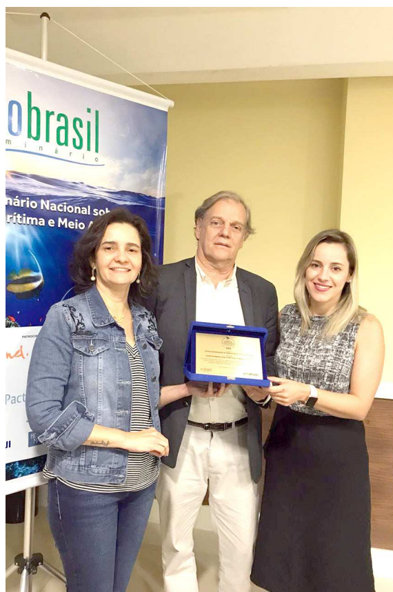
Equipe da Emap com representante da Codesa e Portocel