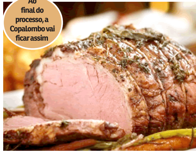
Ao final do processo, a Copalombo vai ficar assim

O último corte a ser consumido é o Copalombo. Como a sua preparação é bem lenta e será já no final do churrasco, o ideal é começar a organizar logo a carne. Antes de envolver em um papel de alumínio, é necessário salgar a carne e selar e depois devolvê-la para a brasa,