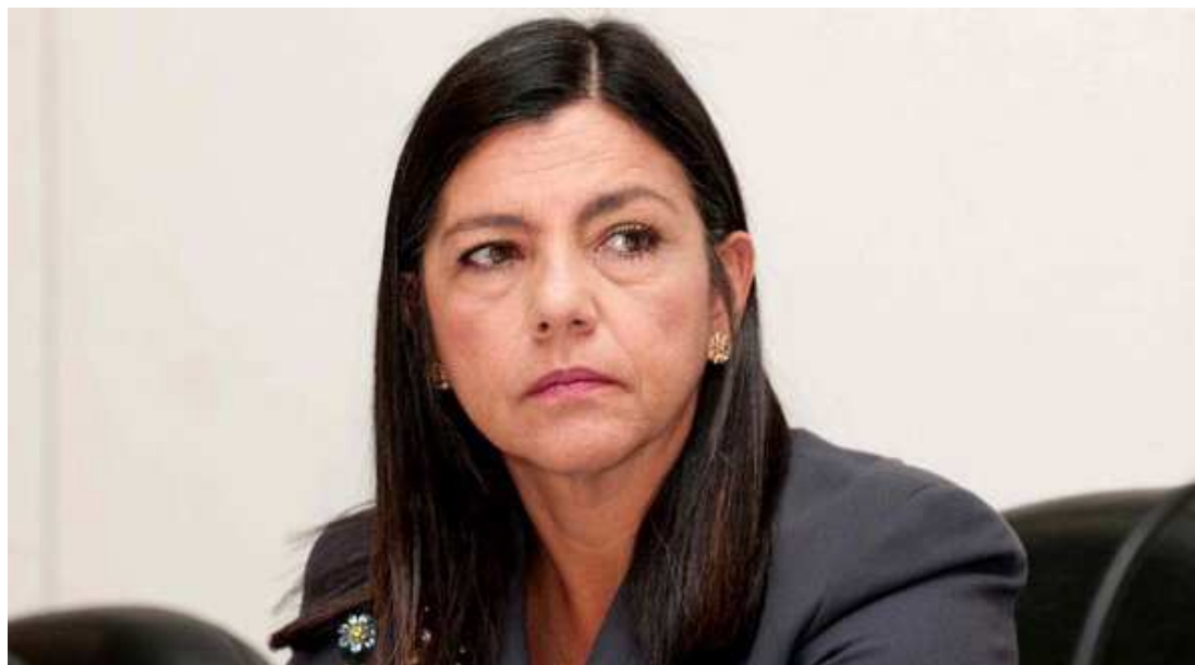
Roseana Sarney está indecisa sobre a decisão de tentar retornar ao comando do Palácio dos Leões

Mas há a possibilidade do grupo não lançar um candidato próprio e formar uma aliança em torno da candidatura do senador Roberto Rocha (PSDB) com Sarney Filho sendo um dos escolhidos pela chapa para a candidatura ao Senado. Ocorre que Rocha está praticamente acertado com sua dupla de candidatos ao Senado: os tucanos José Reinaldo Tavares e José Antô-