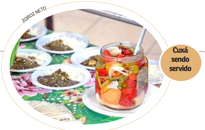
Cuxá sendo servido

Ela contou também que não costuma ter as medidas de quantidades dos ingredientes que usa e que é preciso experimentar a comida antes de servi-la.