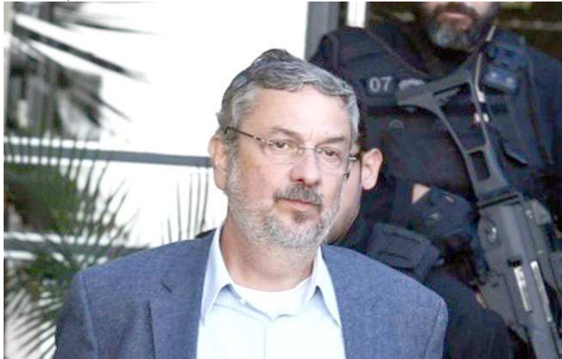
Antônio Palocci firmou acordo de colaboração com a Polícia Federal para diminuir sua pena de prisão