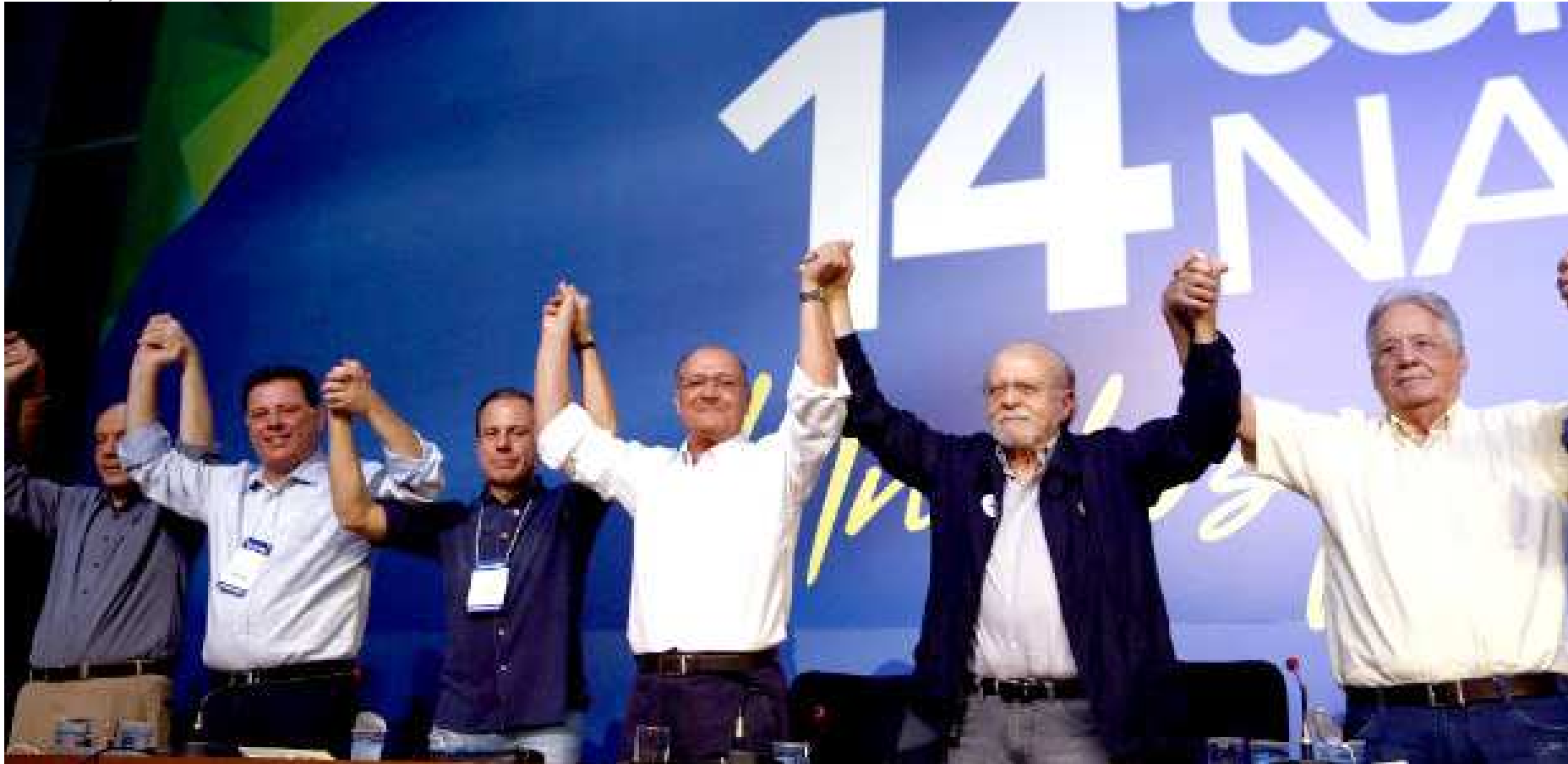
Principais nomes do PSDB comemoram após o resultado da eleição que colocou Geraldo Alckmin na direção nacional do partido no fim do ano passado