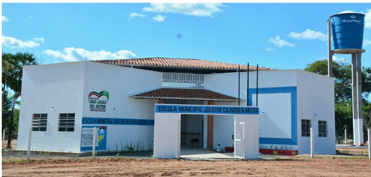
Cidade de São João do Sóter, integrante do Mais IDH, foi uma das contempladas com uma Escola Digna. Mais 72 devem ser entregues este ano

“Somente através de iniciativas como estas é que podemos afirmar que estamos construindo um Maranhão mais justo para todos. Equipar e estrutu-