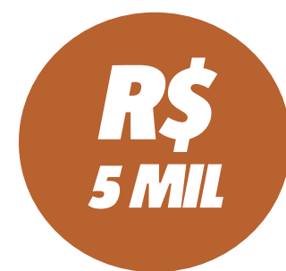
Valor da primeira remessa

Ele foi preso na ação deflagrada pela PF, na última terça-feira, que foi até a Câmara e a endereços ligados a políticos do PP para investigar indícios de obstrução de Justiça. Além de Brasília, foram cumpridos mandados de prisão e de busca e apreensão em Teresina e Boa Vista. Foram recolhidos documentos e arquivos eletrônicos que podem corroborar o depoimento de Expedito.