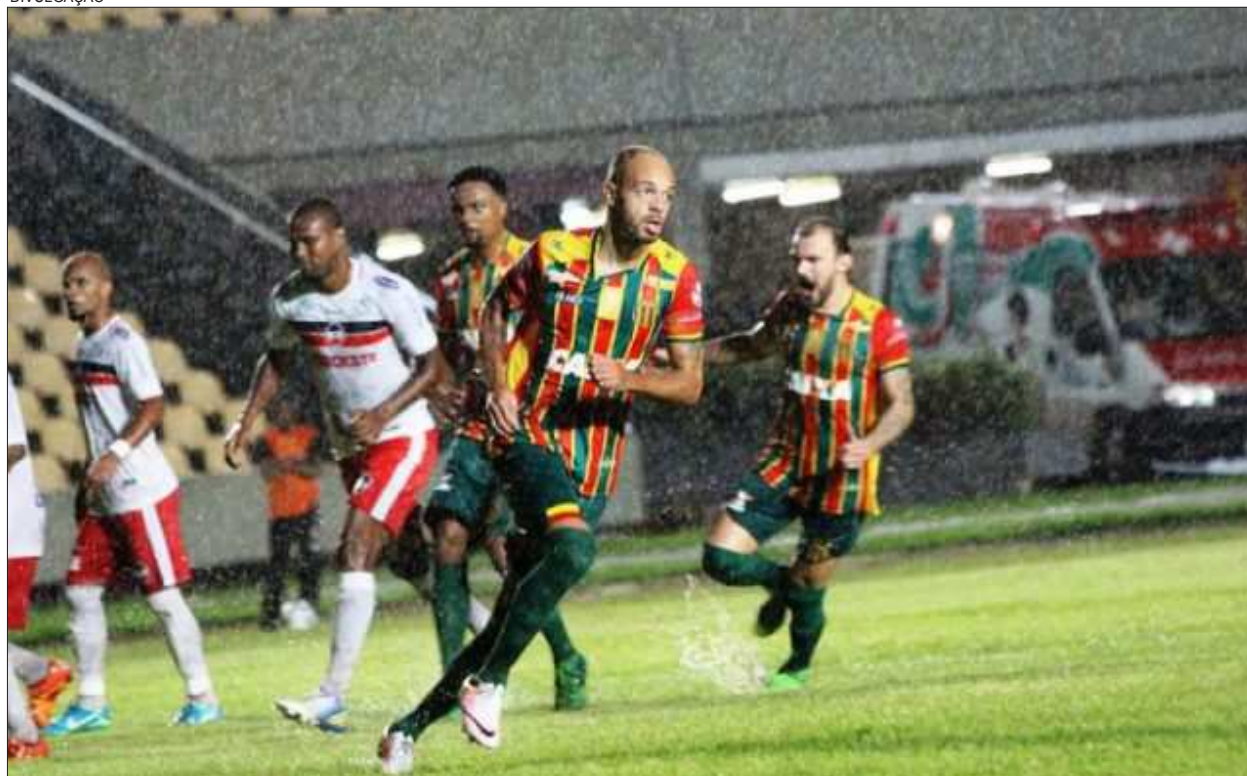
Sampaio faz pausa após jogar quarta e sábado, e só volta na próxima sexta-feira, no Castelão, contra o Bicolor marajoara