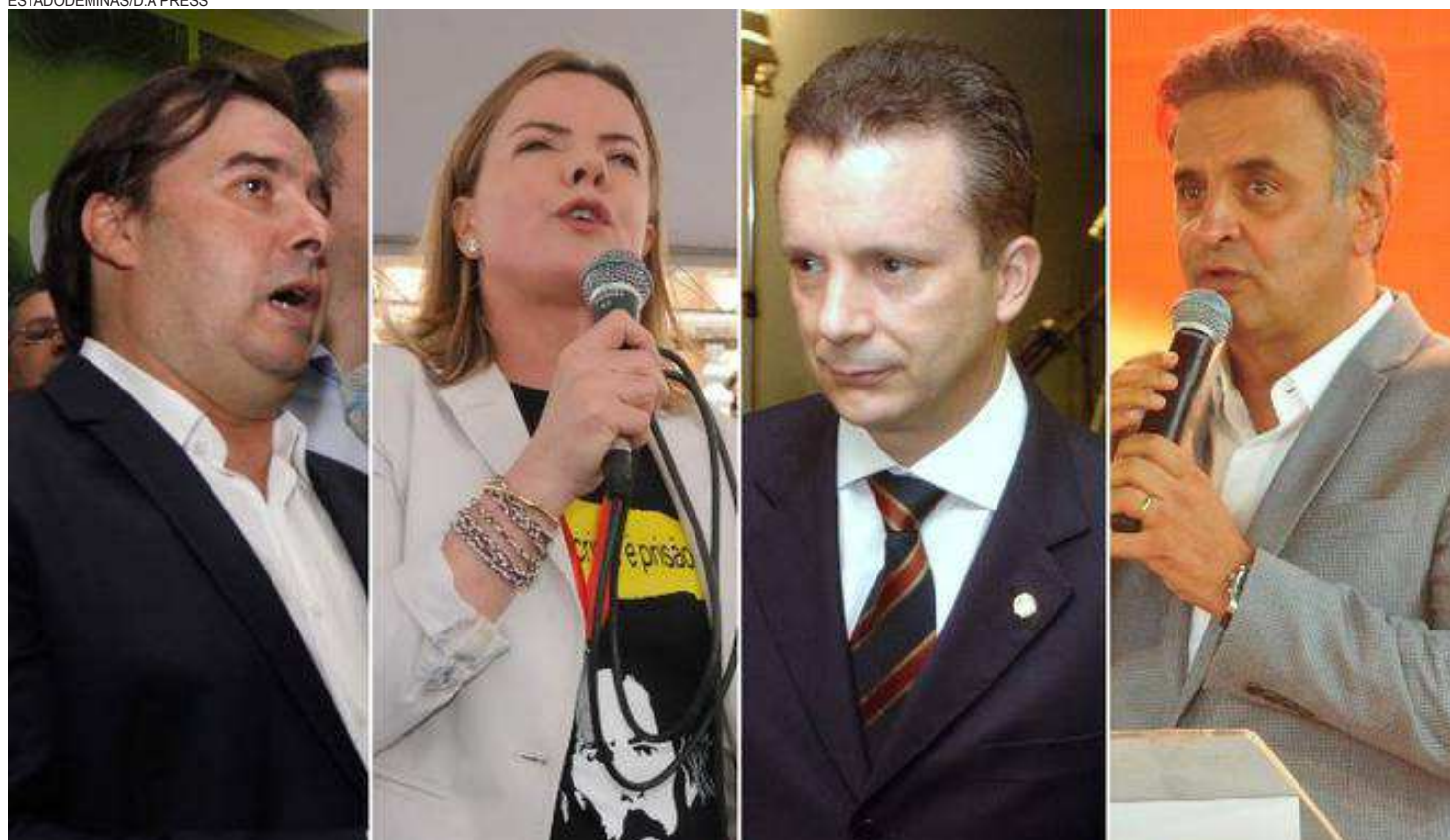
Rodrigo Maia, Gleisi Hoffman, Celso Russomanno e Aécio Neves podem ser atingidos por processos com o fim do foro privilegiado

de imputação de crimes cometidos no atual exercício do cargo e em razão dele. A tese, já seguida por outros sete ministros, deixa claro que um caso de agressão doméstica cometido por um parlamentar, por exemplo, não será mais julgado pelo Supremo, por não ter relação com o cargo. Mas não responde se um deputado em campanha pela reeleição suspeito de receber caixa 2 deve ter seu inquérito encaminhado à 1.ª instância.