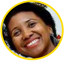
SANDRA VIANA ESPECIAL PARA O IMPARCIAL

Especialistas em direito analisam os principais pontos causados por decisões diversas em julgamentos realizados pela Justiça