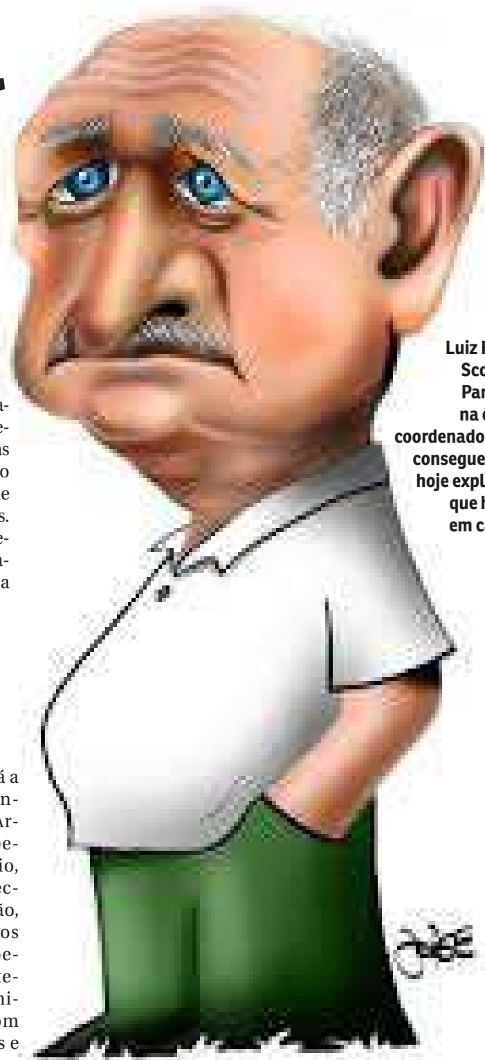
Luiz Felipe Scolari e Parreira, na época coordenador, não conseguem até hoje explicar o que houve em campo

O Flamengo ainda não oficializou a permanência de Barbieri como técnico da equipe, mas os resultados estão começando a agradar. Em sete partidas, ele venceu quatro e empatou três. O Flamengo, no momento, lidera o Brasileiro e está com as vagas na Copa do Brasil e na Copa Libertadores encaminhadas.