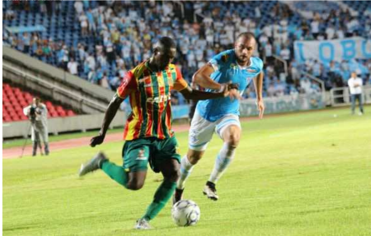
Sampaio Corrêa vai tentar a reabilitação, hoje, diante do CRB, em jogo marcado para as 20h30 no Estádio Castelão

vas alterações a serem feitas na formação inicial do jogo desta segunda-feira. Até porque ficou pouco tempo para treinamento.