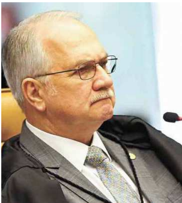
Edson Fachin é o relator do caso da soltura de Luiz Inácio Lula da Silva

Lula apresentou recurso (agravo regimental) contra a decisão do ministro Luiz Edson Fachin, relator da Lava-Jato no STF, de rejeitar pedido do petista para não ser preso. Os advogados argumentaram que a prisão não poderia ter sido decretada em 5 de abril porque ainda havia embargos de declaração pendentes de análise no Tribunal Regional Federal da 4ª Região (TRF-4), a segunda instância da Justiça responsável pela Operação Lava-Jato. Os embargos foram divulgados apenas em 18 de abril. Edson Fachin negou o pedido por entender que os em-