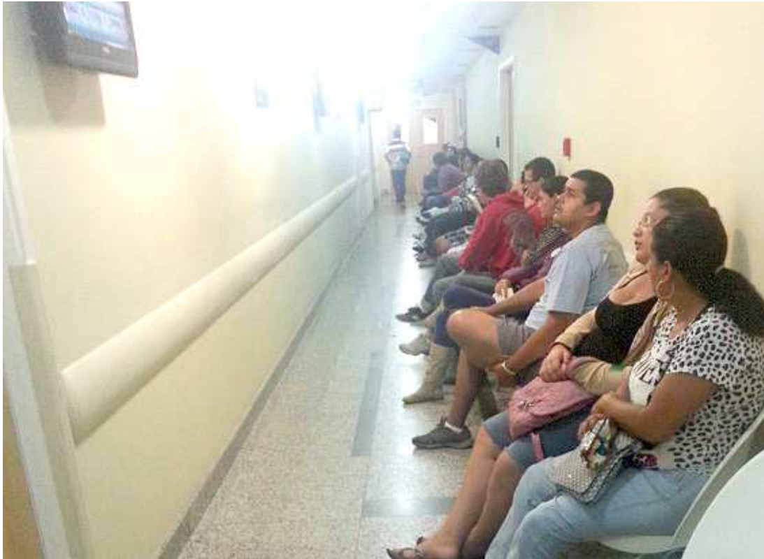
Vírus da gripe é o mais comum entre os casos registrados nas unidades de urgência e emergência de São Luís

“Os vírus que causam infecção do trato respiratório e gastrointestinal tem uma facilidade muito grande de transmissão. E no período de chuvas, onde as pessoas ficam mais aglomeradas, se houver uma ou duas pessoas doentes, é fá-