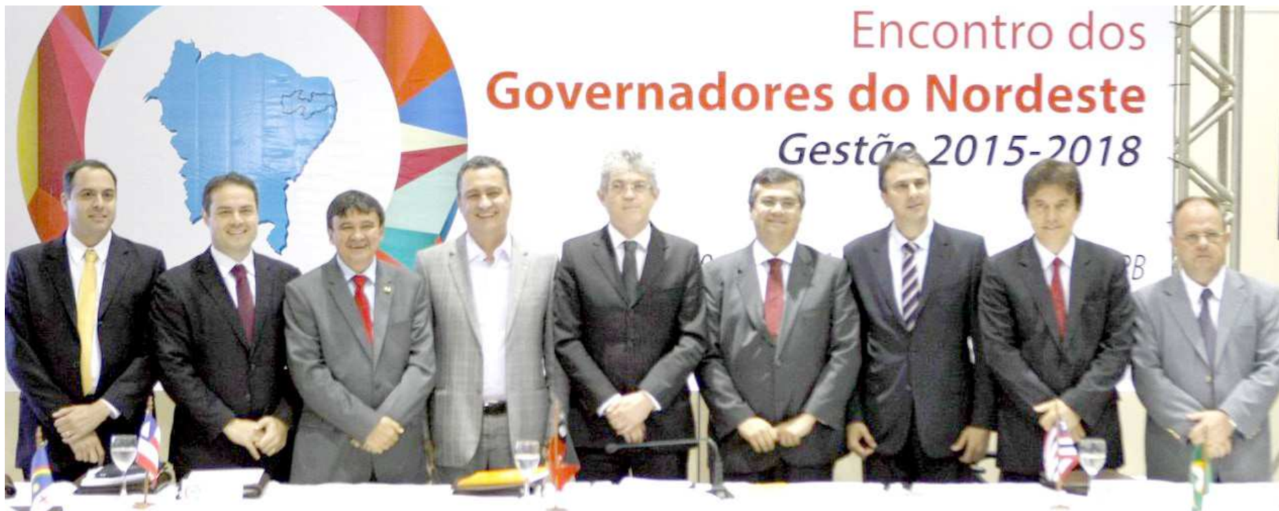
Os nove governadores do Nordeste formaram grupo para fazer reivindicações diretamente ao presidente Michel Temer. Carta aberta foi assinada por apenas seis destes

Os governadores apelam pela liberação da linha de crédito de R$ 42 bilhões anunciada em março deste ano. "Seguimos aguardando, ainda, a definição dos critérios da linha de