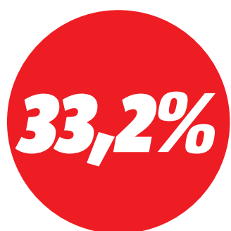
Queda no número de infrações por uso de celular

Um dos fatores que pode ter propiciado essa diminuição foi a instalação de câmeras de monitoramento do trânsito nas principais avenidas da capital, fazendo com que alguns motoristas temam sentir no bolso o peso da infração.