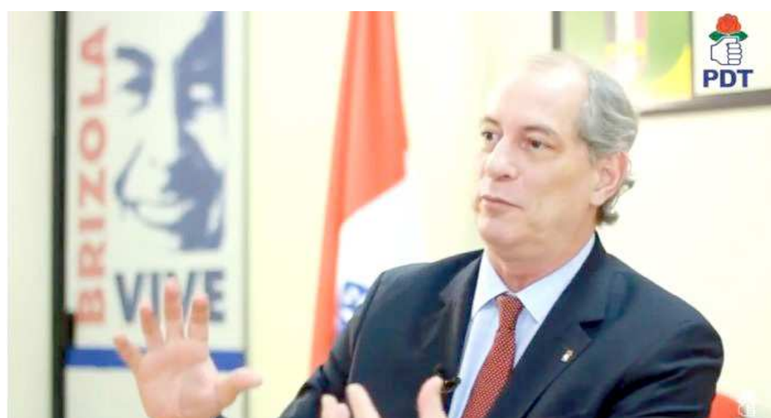
Para superar ponto fraco, campanha do pedetista irá pedir ajuda a artistas e músicos simpáticos a sua candidatura

Para superar o ponto fraco, a campanha do pedetista irá pedir a artistas e músicos simpáticos a sua candidatura e populares no universo online que o ajudem a divulgar seus canais virtuais. “Nós vamos procurar pessoas públicas para que façam uma referência às redes sociais de Ciro, mas sem que elas se comprometam”, explicou o ex-governador do Ceará Cid Gomes, irmão do presidencial. Na lista dos que devem ser procurados, estão os cantores Cetano Veloso, Wesley Safadão e Raimundo Fagner, além dos comediantes Tom Cavalcante e Whindersson Nunes.