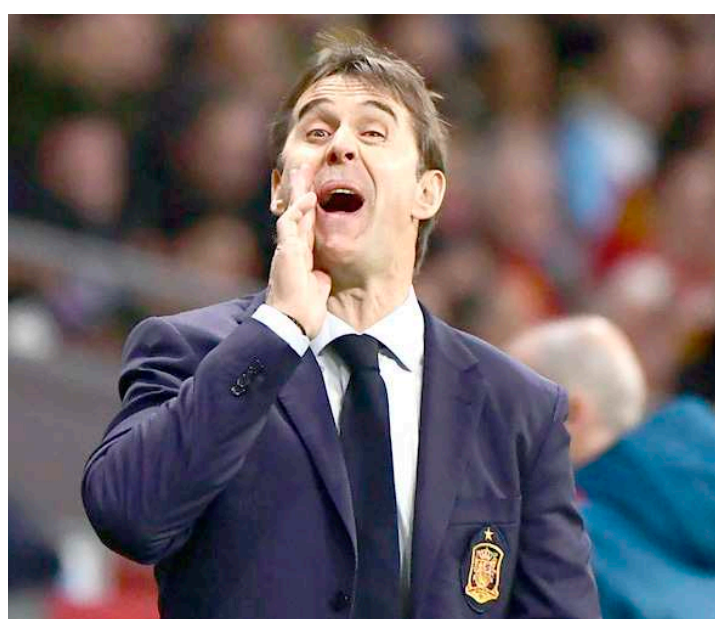
Julen Lopetegui, técnico da Espanha, favorito para ganhar o Mundial

três jogadores nascidos no Brasil: Thiago Alcântara, Rodrigo e Diego Costa, mas lapidou dois