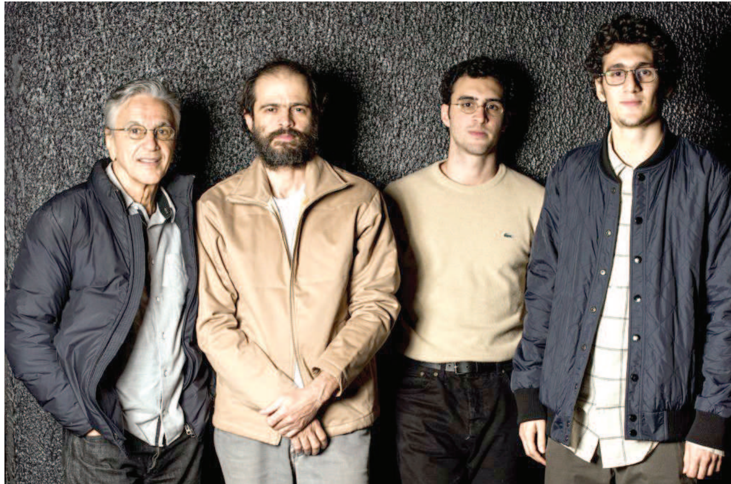
Caetano Veloso, e seus filhos Moreno Veloso, Zeca Veloso e Tom Veloso posam antes do show Ofertório para as lentes do fotógrafo Bob Sousa

Caetano observa, com uma expressão satisfeita, os filhos posarem. Um a um. Olho para o lado e vejo um pai orgulhoso de sua cria. O sorriso no rosto