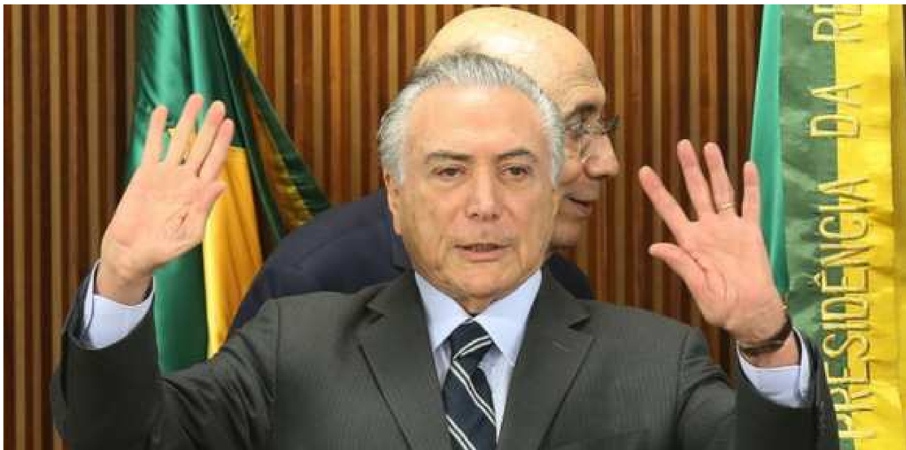
Em nota conjunta, seis líderes opositores cobraram do presidente Michel Temer a revogação do chamado decreto de Garantia da Lei e da Ordem (GLO), que prevê a ação dos militares

“Mesmo um governo fraco e sem credibilidade como o do presidente Michel Temer poderia encontrar uma saída, se tivesse algum respeito pelo povo brasileiro”, emenda a nota. O texto é assinado pelos líderes Weverton Rocha (PDT-MA),