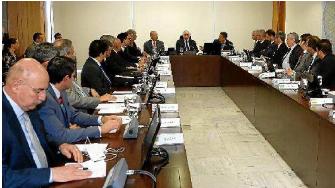
Reunião do Confaz no Planalto contou com a presença de 13 dos 27 secretários estaduais de Fazenda

“A causa da escalada dos preços dos combustíveis, notadamente do óleo diesel, nos últimos meses no Brasil se deve exclusivamente à política de flutuação dos preços praticada pela Petrobras, que os vincula à variação do petróleo no mercado internacional”, destacou o documento. Os estados signatários informaram que, para não prejudicar a recuperação fiscal e a execução de políticas