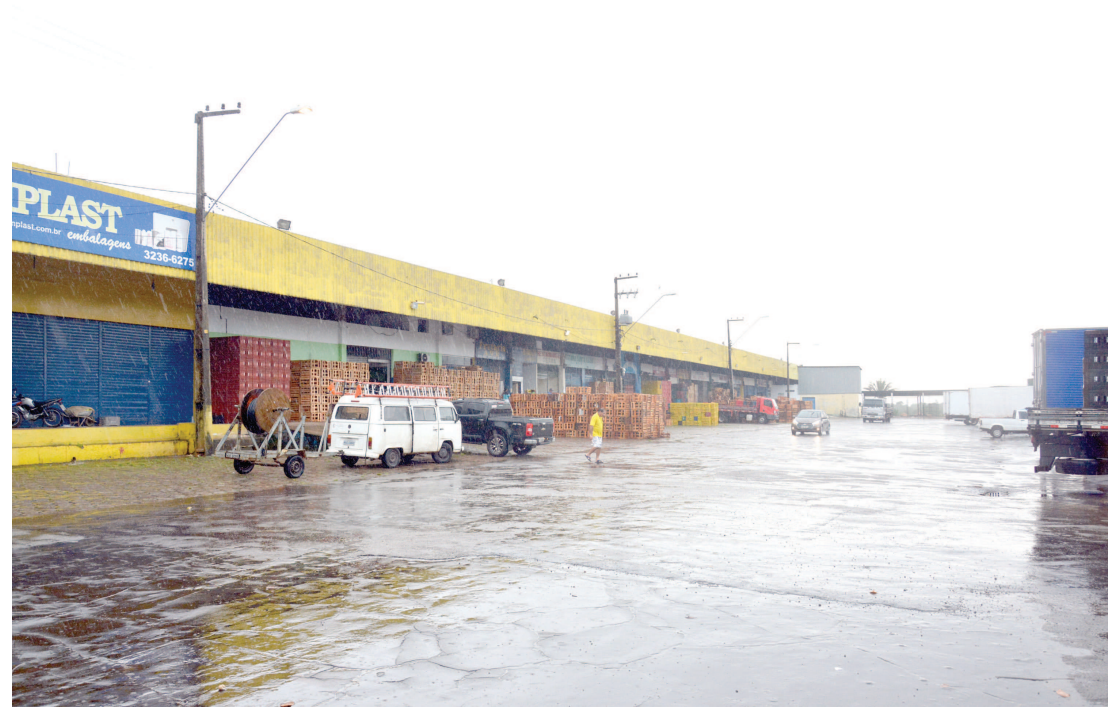
Os boxes da Cooperativa dos Hortifrutigranjeiros do Maranhão permaneciam sem movimentação até ontem à tarde. Na parte externa, também não foi registrada a presença de caminhões para fazer o abastecimento na Ilha