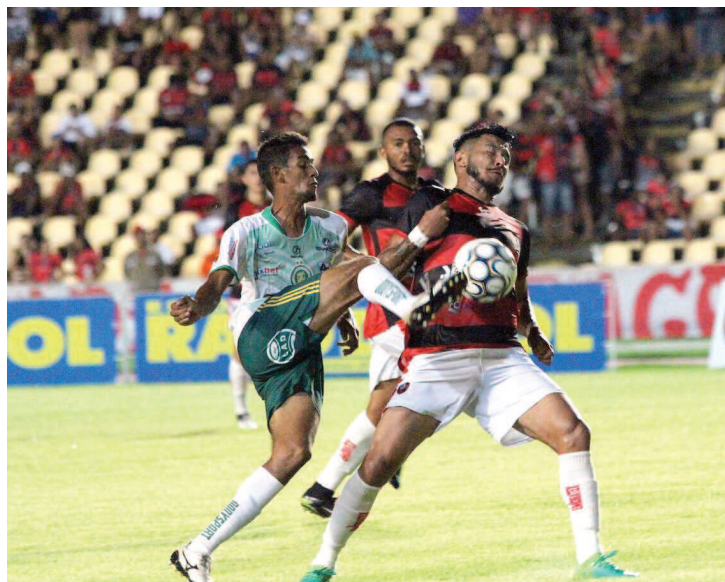
Vitória diante do modesto Assu-RN garantiu Moto em primeiro lugar

bem, apesar do gol logo no início. Esperávamos uma atuação bem melhor no segundo tempo, mas isso não ocorreu. Agora temos uma semana para corrigir essas falhas, pois agora a situação é outra. Precisamos fazer um bom resultado na casa do adversário para conseguir a classificação em São Luís”, comentou após o jogo.