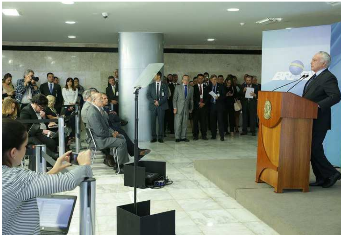
Em entrevista coletiva, Michel Temer disse ter “absoluta convicção” de que paralisação encerrará hoje