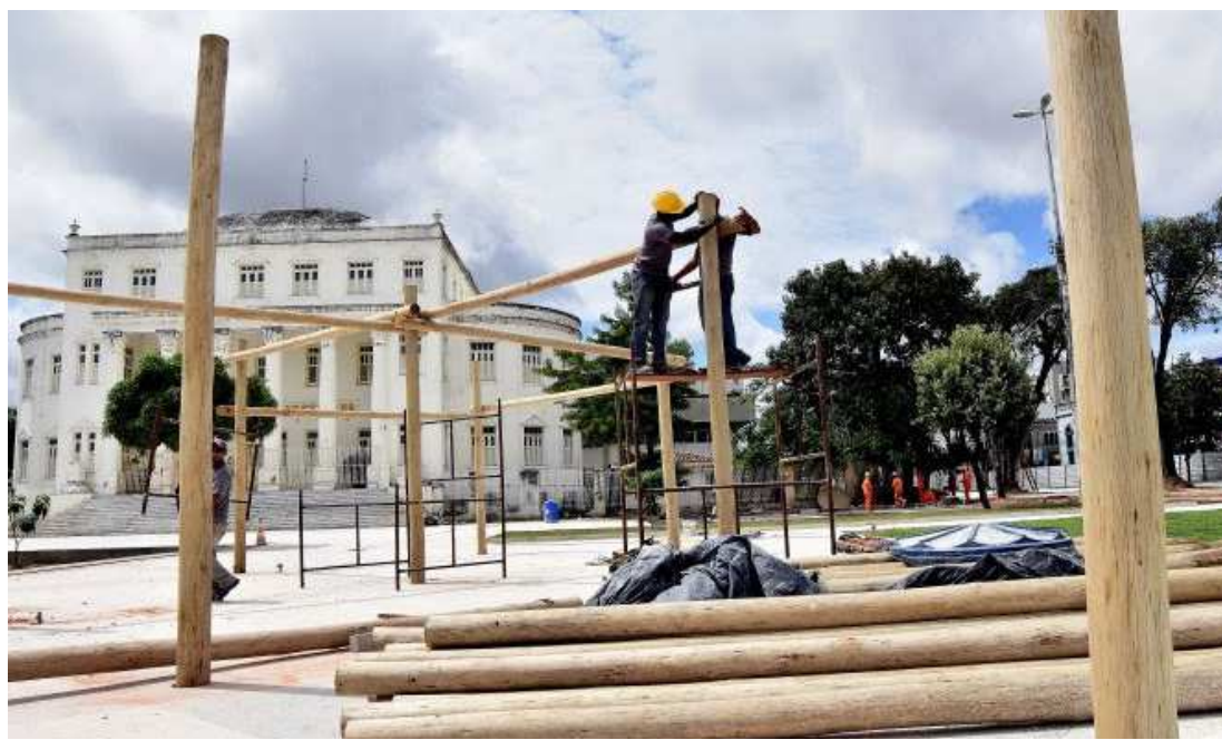
Os caramanchões estão sendo erguidos com hastes de eucalipto autoclavado e medem 16 metros quadrados