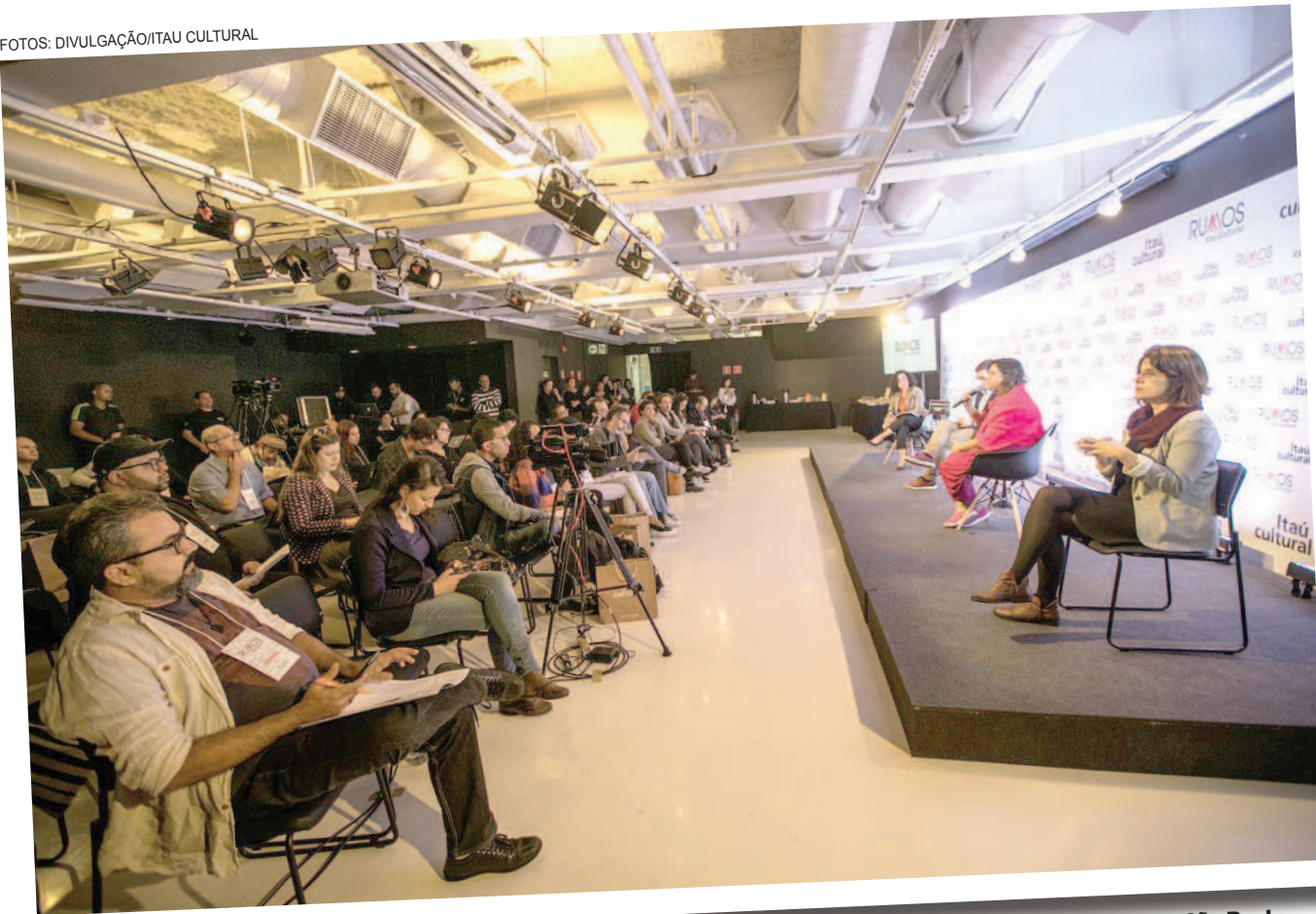
Coletiva para o anúncio dos projetos selecionados do Rumos do Itaú Cultural 2017/2018, realizada ontem em São Paulo