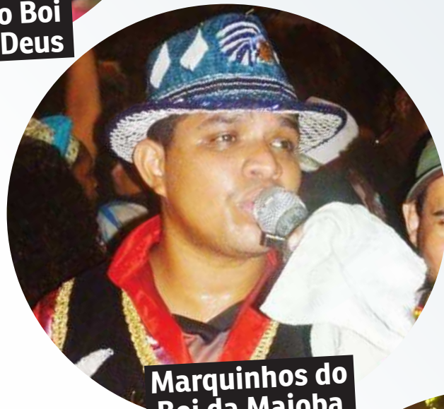
Marquinhos do Boi da Maioba

Após longo período de apresentações em outros espaços, o Encontro de Gigantes de 2018 marca o retorno da festa ao bairro de origem. Isso só foi possível graças à recuperação da região sob a Ponte Bandeira Tribuzzi, entregue no ano passado pelo Governo do Maranhão.