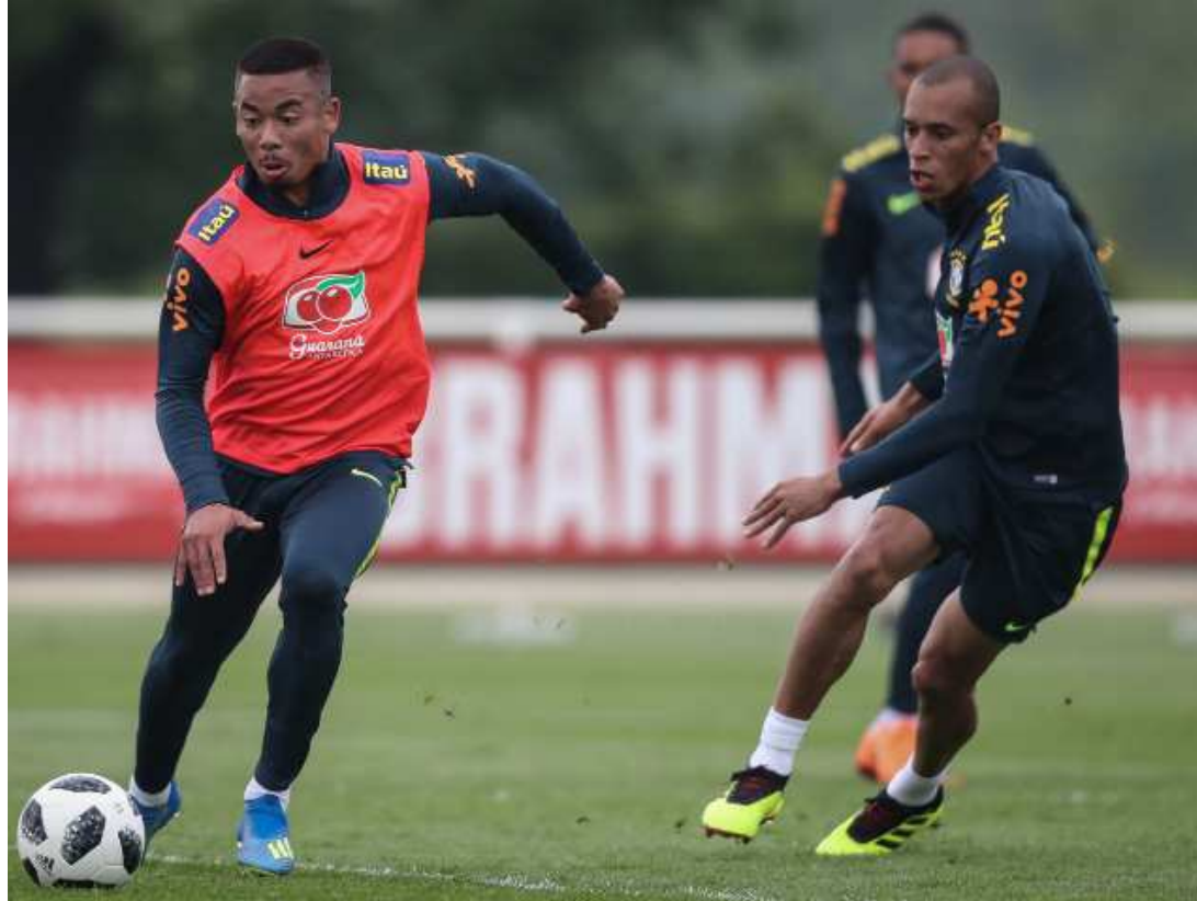
Seleção voltou aos treinamentos ontem, preparando-se para o amistoso contra a Croácia

tos da atividade. Depois disso, deixaram o local e o treinador comandou uma atividade tática. Começa aí a definir a escalação titular.