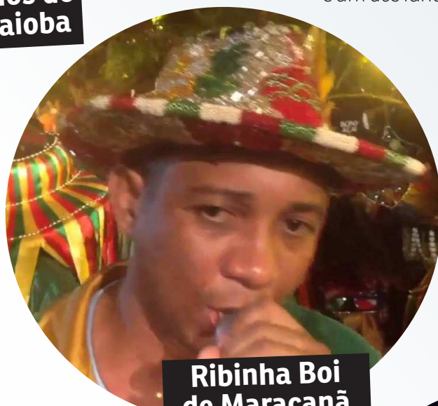
Ribinha Boi de Maracanã

O quê? 26º Encontro de Gigantes Quando? Hoje, a partir das 20h Onde? Embaixo da Ponte Bandeira Tribuzzi Quanto? Aberto ao público