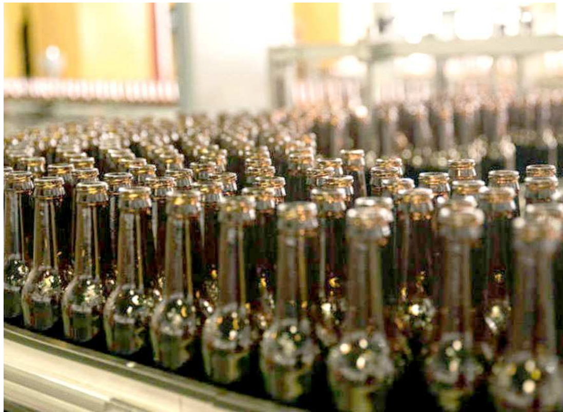
Consumidores poderão ficar sem cerveja e outros produtos por conta da greve dos caminhoneiros no estado