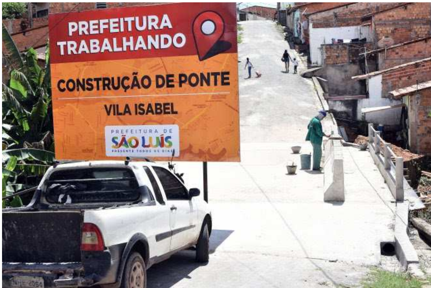
Ponte vai possibilitar mobilidade no bairro que, há mais de 40 anos, sofria com as dificuldades de acesso a motoristas e pedestres

Esperada pela população do bairro há mais de quatro décadas, ponte é mais um investimento da gestão do prefeito Edivaldo para a melhoria da infraestrutura dos bairros da região Itaqui-Bacanga