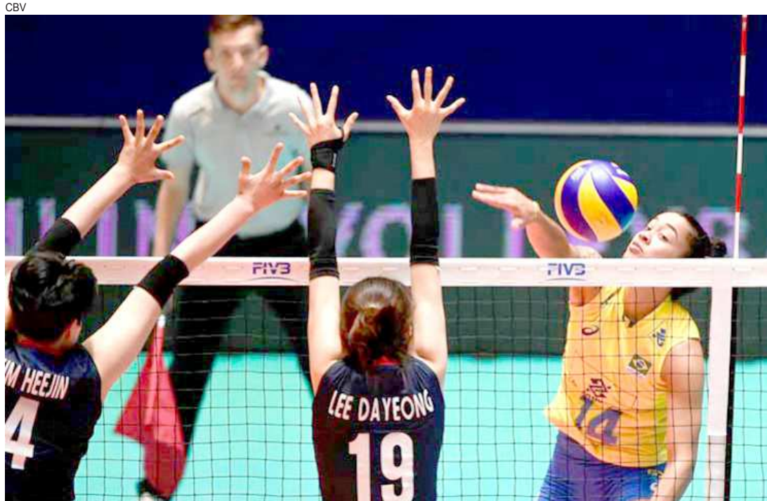
De nada adiantaram as tentativas de bloqueio das coreanas diante do Brasil, que venceu fácil a partida

O Brasil retorna à quadra hoje contra a Polônia, às 11h30. Enquanto a Coreia enfrenta a anfitriã Holanda, às 14h30. As brasileiras venceram o primeiro set com facilidade, por 25 a 11. No segundo set, porém, a Coreia demonstrou seu tradicional volume de jogo, fechando o set em 25 a 14.