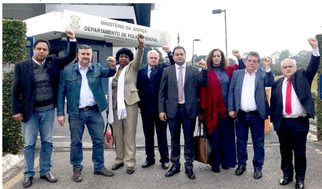
Comissão formada por diversos parlamentares de partidos de oposição que posaram com punho fechado