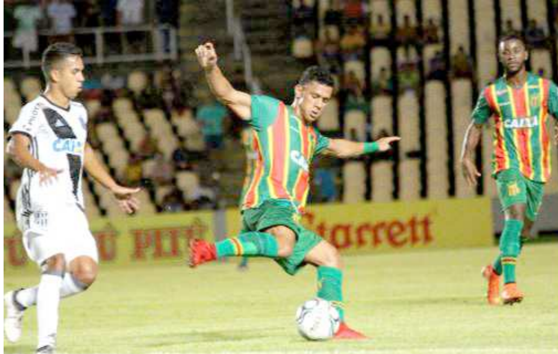
Tricolor mostrou que a fase é boa e voltou a jogar bem, derrotando a Ponte Preta-SP no Estádio Castelão