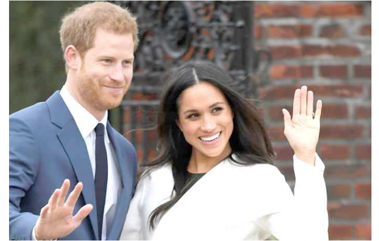
O protocolo impede que eles recebam presentes de desconhecidos