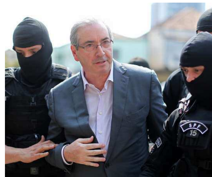
Ex-deputado foi condenado por desvio de dinheiro