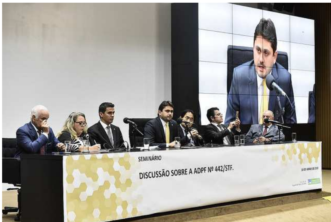
Câmara dos Deputados promoveu seminário para discutir decisões do STF sobre o tema do aborto

"Em primeiro lugar, quero ressaltar a importância do tema em debate. É fundamental destacar o protagonismo do Congresso Nacional, especialmente o da Câmara dos Deputados, que coloca o tema em sua agenda estratégica, de forma ampliada, oportuna, em parceria de várias comissões. Reafirmo aqui o apoio e a disposição para dar andamento ao assunto na CSSF, com es-