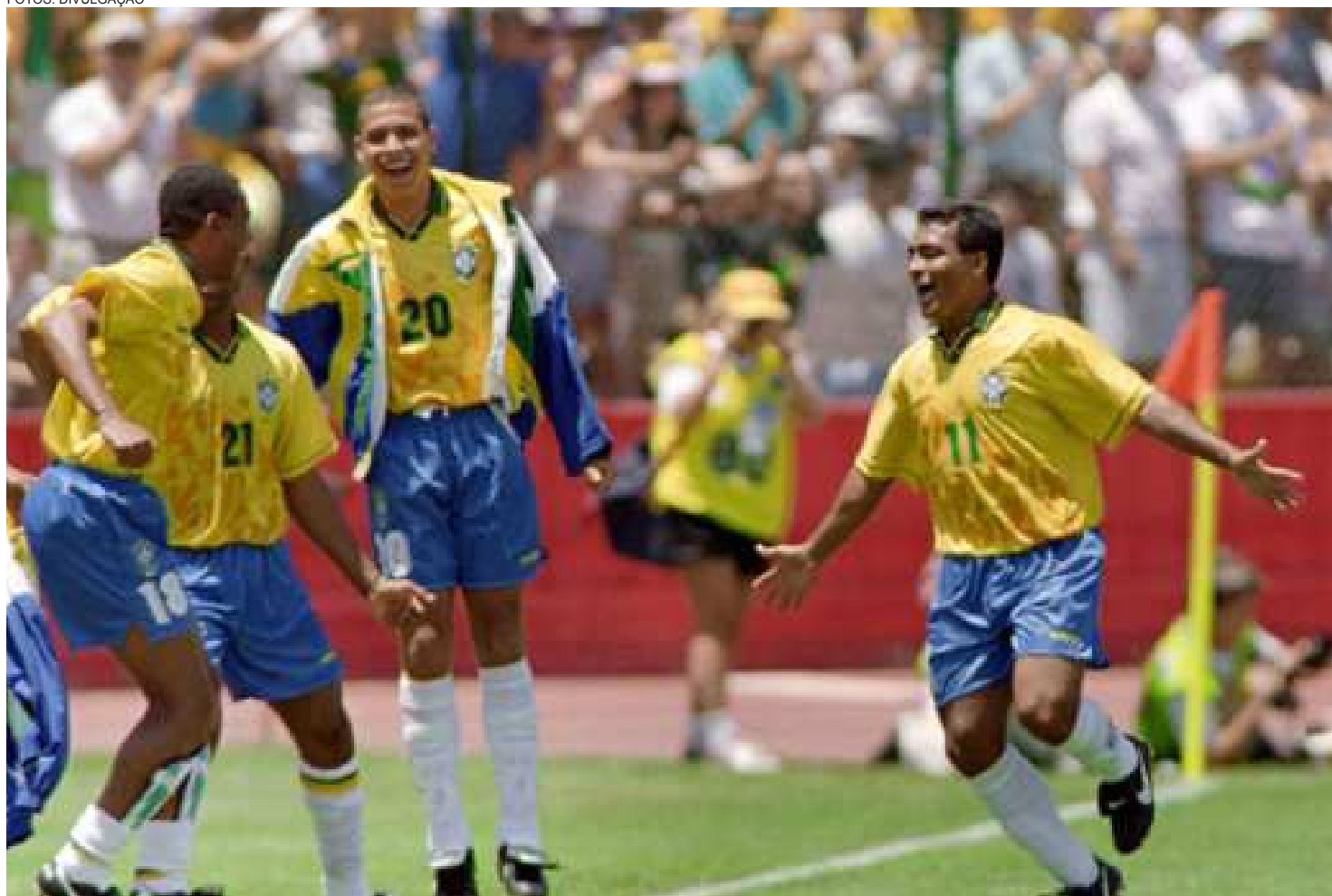
Na Copa do Mundo dos Estados Unidos, Brasil sofreu, mas eliminou os anfitriões, com destaque para atuação dos atacantes Romário e Bebeto

de 17 anos. O menino, que seria "coroador Rei", fez dois na decisão, mesmo número de Vavá. O outro foi de Zagallo. Quatro anos mais tarde, o bi seria conquistado com a assinatura de Mané Garrincha, içado a astro da equipe após lesão de Pelé ainda na primeira fase. Na semifinal, os anfitriões chilenos foram as vítimas, derrotados por 4 a 2. O ponta direita fez dois e Vavá (mais uma vez) também balançou as redes em duas oportunidades.