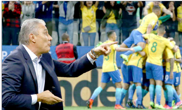
Treinador Tite modificou marcação e conquistou grandes vitórias

Em média, faz 7,5 ações defensivas por jogo contra 2,7 de Oliveira. Mas não é só isso. Todos os atacantes passaram a colaborar mais com a marcação. O principal exemplo é que, com Dunga, tentava roubar 4,7 bolas por jogo, contra 8,7 sob o comando de Tite. Com a ajuda dos atacantes na marcação, Tite pôde dar mais liberdade para os volantes. Os jogadores mais recuados do meio de campo finalizam mais e chegam mais perto da área adversária, como elemento surpresa.