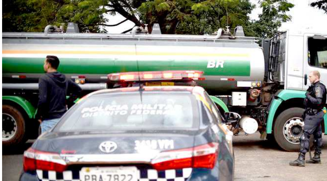
Outra forma de acelerar a decompressão sobre os preços dos combustíveis seria a concorrência no setor