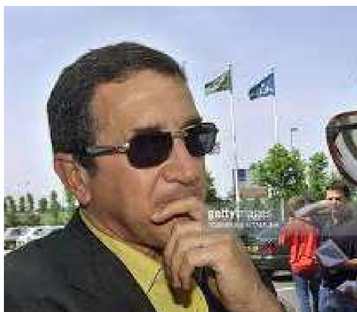
Parreira dirigiu a Arábia Saudita, perdeu dois jogos e foi eliminado

Naquele Mundial, os sauditas caíram no grupo do país-sede, que tinha também África do Sul e Dinamarca. Na estreia, perderam por apertado 1 a 0 para os dinamarqueses. Na sequência, levaram goleada dos franceses de 4 a 0. As duas derrotas deixaram os árabes sem chances de classificação e enfureceram o príncipe Faisal Bin Fahd, filho do rei e que presidia a federação local. Ele não teve pudores em demitir Parreira e colocar Mohamed Al-Kharashy na direção do time contra a África do Sul - empate por 2 a 2. Além de Brasil, que voltaria a treinar em 2006, e Arábia Saudita, Parreira comandou outras três seleções em Mundiais: Kuwait (82), Emirados Árabes (90) e África do Sul (2010), sempre parando na fase de grupos. Em 2014, foi coor-