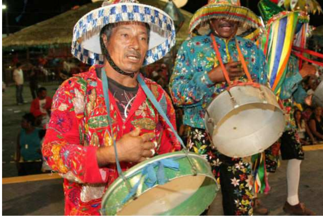
O São João de Todos deu início à sua programação na última sexta-feira, com a realização das prévias juninas