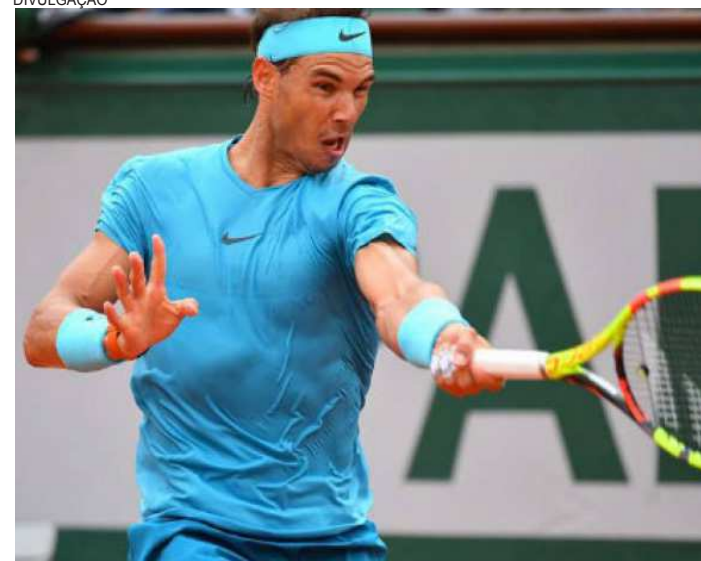
Rafael Nadal está cada vez mais próximo de um grande feito