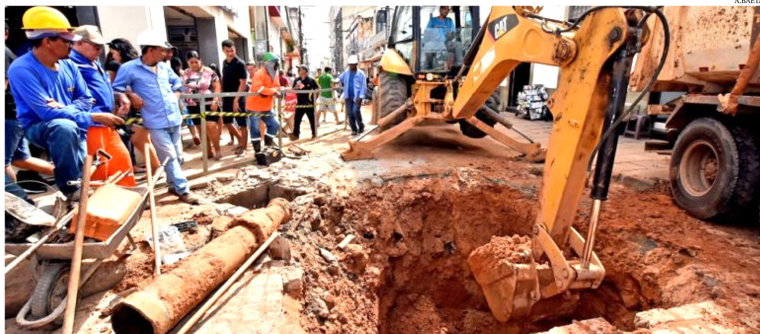
O TRABALHO QUE ESTÁ SENDO REALIZADO ESTA SEMANA COMPREENDE A PAVIMENTAÇÃO E EMBUTIMENTO DA FIAÇÃO ELÉTRICA

Depois da primeira etapa concluída e entregue pelo Instituto do Patrimônio Histórico e Artístico Nacional (Iphan) e Prefeitura de São Luís, no último dia 22, as obras da Rua Grande avançam na segunda fase. Enquanto na quinta quadra os trabalhos estão sendo concluídos, os serviços estruturais já foram iniciados na sexta quadra com as instalações dos sistemas de esgoto, água, drenagem pluvial e elétrica. O trabalho de requalificação da via segue conforme o cronograma de execução da obra e beneficiará ainda mais os comerciantes e as mais de 100 mil pessoas que circulam diariamente pelo maior centro comercial da cidade.