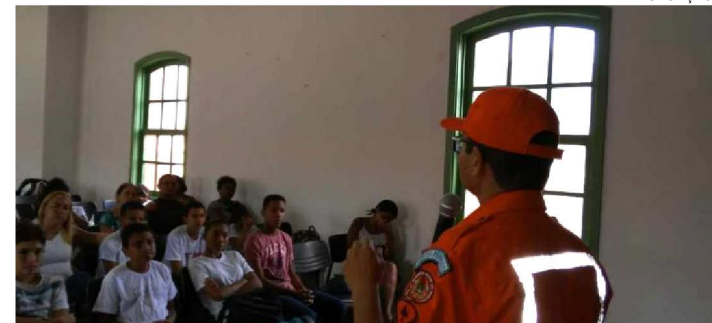
A CERIMÔNIA FOI REALIZADA NO CONVENTO DAS MERCÊS

O primeiro curso de Bombeiro Mirim realizado do Convento das Mercês foi concluído no último sábado (5), quando foi realizada a solenidade de formatura. A capacitação é resultado de parceria entre a Fundação da Memória Republicana Brasileira (FMRB) e o Corpo de Bombeiros Militar do Maranhão (CBMMA). As 40 crianças participantes, moradoras do bairro do Desterro e de outras comunidades da área do Centro Histórico de São Luís, receberam treinamentos nas áreas de prevenção a acidentes e primeiros socorros.