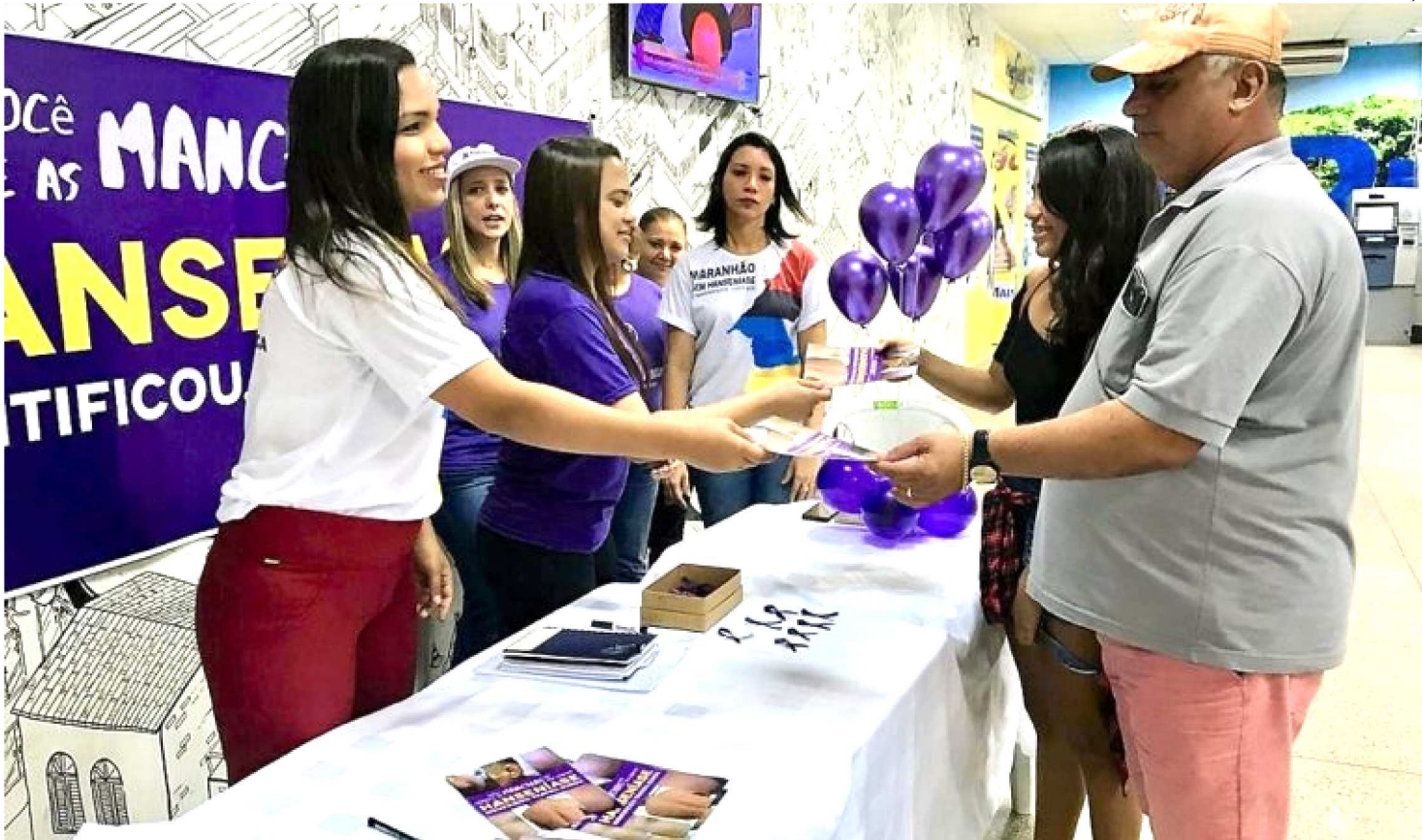
ASSISTENTES SOCIAIS DA SES INFORMAM COMO IDENTIFICAR E PREVENIR A DOENÇA, DISTRIBUINDO MATERIAL EDUCATIVO

O Departamento Estadual de Trânsito do Maranhão (Detran-MA) disponibilizou um espaço, na área do atendimento da sede do órgão, no bairro Vila Palmeira, em São Luís, para a Secretaria de Estado da Saúde (SES) alertar os cidadãos e servidores do departamento sobre os riscos da hanseníase. A ação é realizada pela equipe do Programa Estadual de Controle da Hanseníase, em apoio à campanha nacional Janeiro Roxo, mês dedicado à conscientização e combate a essa doença.