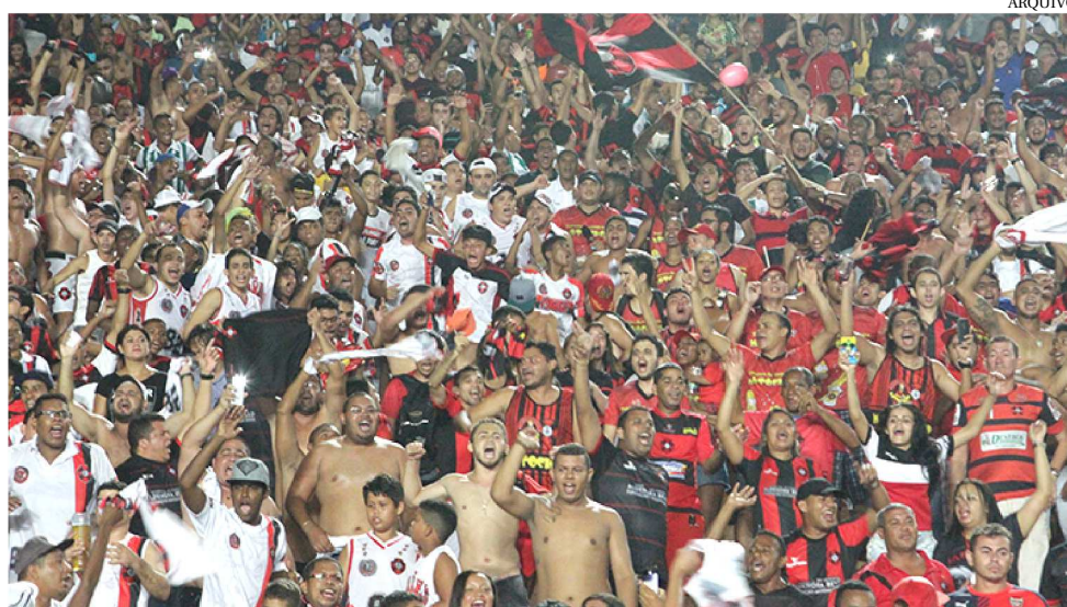
TORCIDA MOTENSE DEVERÁ COMPARECER EM BOM NÚMERO AO ESTÁDIO CASTELÃO