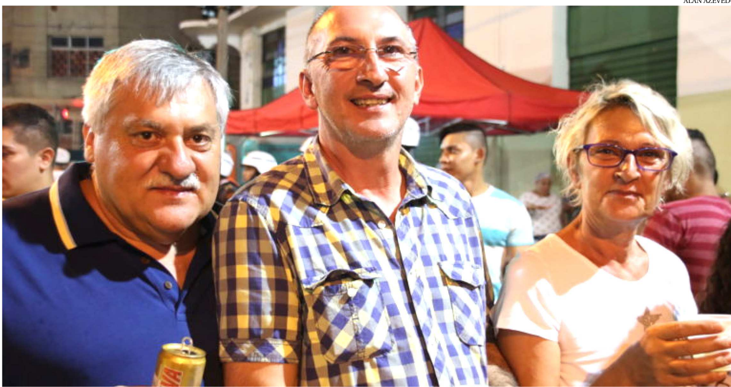
TURISTAS ESTRANGEIROS FORAM PRESTIGIAR A BICICLETINHA, QUE ESTÁ SE CONCENTRANDO AOS SÁBADOS NA RUA DO EGITO