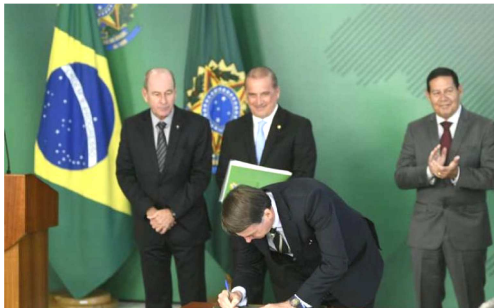
PRESIDENTE JAIR BOLSONARO ASSINA DECRETO LIBERANDO POSSE DE ARMAS