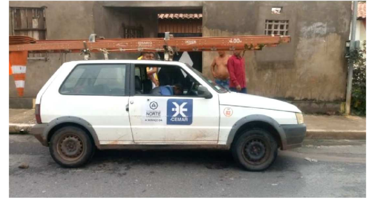
TRABALHADORES FORAM MORTOS EM PAÇO DO LUMIAR