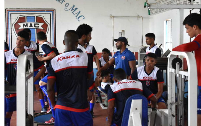
MAC TREINOU NA ACADEMIA E DEPOIS NO CAMPO DO PARQUE