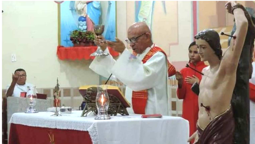
IGREJA DE SÃO SEBASTIÃO DO CRUZEIRO DO ANIL COMEÇOU PROGRAMAÇÃO DIA 11

“Essa é só uma das novidades. Para o ano que vem, vamos fazer crescer essa corrida e teremos muito mais