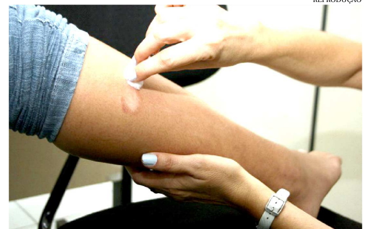
O DIAGNÓSTICO PRECOCE AUMENTA AS CHANCES DE CURA

O mês de janeiro é dedicado à conscientização e combate à hanseníase. Por ano, no Brasil, são diagnosticados perto de 30.000 casos novos de hanseníase. Mas a Sociedade Brasileira de Hanseníase alerta para uma epidemia oculta da doença e estima que o Brasil tenha entre 3 e 5 vezes mais casos do que apontam os dados oficiais da doença. Segundo a Secretaria de Estado da Saúde, em 2018, foram notificados 3.079 novos casos, 650 deles em São Luís.