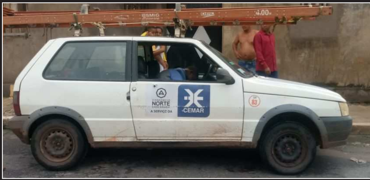
OS COLABORADORES LEVARAM VÁRIOS TIROS DENTRO DO VEÍCULO QUE TRABALHAVAM