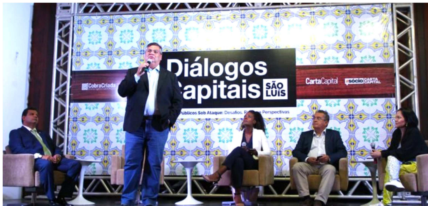
GOVERNADOR FLÁVIO DINO CONSIDERA DE GRANDE IMPORTÂNCIA OS BANCOS PÚBLICOS PARA O DESENVOLVIMENTO DOS ESTADOS

Os riscos das privatizações desenfreadas e a importância da manutenção de bancos e fontes públicas de incentivo ao desenvolvimento do país foram alguns dos temas defendidos pelo governador Flávio Dino na edição maranhense do Diálogos Capitais. O evento, que já passou por cidades como São Paulo (SP), Belo Horizonte (MG), Teresina (PI), Rio de Janeiro (RJ), Salvador (BA) e Natal (RN), foi realizado em São Luís nessa segunda-feira (14), no Convento das Mercês.