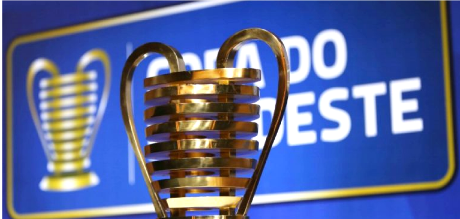
O TROFÉU QUE SERÁ EXIBIDO PELO CAMPEÃO DA TEMPORADA 2019, UM DOS PRINCIPAIS TORNEIOS REGIONAIS DO PAÍS

A Copa do Nordeste teve seu início ontem com jogos que se encerraram após o fechamento desta edição: Náutico x Fortaleza, Botafogo x Santa Cruz e CSA x Vitória. O torneio é disputado pelos principais clubes da região e terá clássicos estaduais praticamente em toda a rodada. Fortaleza, de Rogério Ceni, Ceará, Bahia e CSA são os participantes da Série A do Brasileiro. O Nordestão dará uma boa premiação aos times.