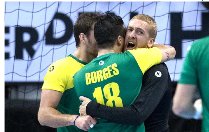
BRASILEIROS COMEMORAM VITÓRIA SOBRE SELEÇÃO RUSSA