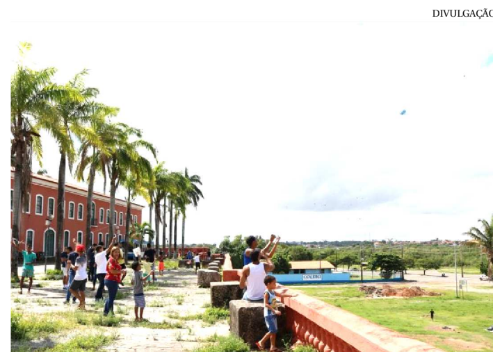
CONVENTO DAS MERCÊS SE TRANSFORMA EM CAMPO DE PIPAS

O Convento das Mercês se transformou no maior campo de pipas do Desterro, durante o Festival de Papagaios, realizado pela Fundação da Memória Republicana Brasileira (FMRB), em parceria com a Secretaria de Estado de Educação (Seduc). O evento que aconteceu no sábado (19) reuniu adultos e crianças no pátio externo da Fundação num momento de lazer e confraternização.