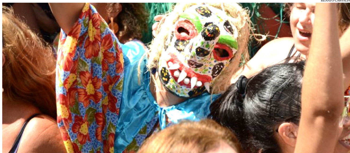
COM PROGRAMAÇÃO CULTURAL DE CARNAVAL, A PREFEITURA DE SÃO LUÍS ANTECIPA A FESTA MOMESCA NA FEIRINHA SÃO LUÍS