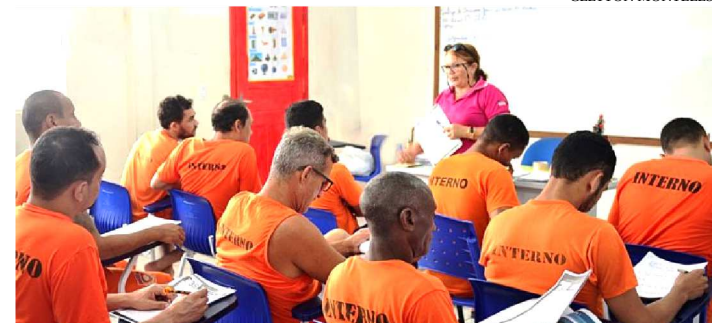
EM TODO O ESTADO, FORAM 838 PRESOS INSCRITOS NO EXAME

Investimentos do Governo do Estado na educação prisional resultaram na aprovação de 431 internos no Exame Nacional do Ensino Médio (Enem) para Pessoas Privadas de Liberdade (PPL) 2018. Em São Luís, a Unidade Prisional de Ressocialização São Luís 2 (UPSL2) foi a que mais aprovou, chegando a 69. A UPR de Balsão foi a que obteve melhor êxito no interior do Maranhão, com 23 aprovações.