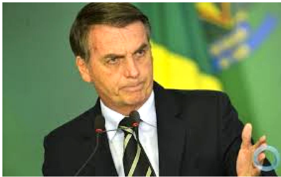
PRESIDENTE JAIR BOLSONARO SEGUIU PARA DAVOS, NA SUÍÇA

Bolsonaro saiu de Brasília domingo, por volta das 22h30, com destino a Las Palmas, na Espanha, onde faria escala antes de seguir para Zurique, na Suíça, e, então, para Davos, sede do Fórum. A distância entre as duas cidades suíças é de 150km. A viagem ocorre em meio às suspeitas de lavagem de dinheiro que cercam Flávio Bolsonaro, outro filho do presidente. Assim que Bolsonaro saiu do espaço aéreo brasileiro, o vice-presidente, Hamilton Mourão, assumiu a Presidência da República interinamente. Ele fica no cargo até a madrugada de sexta-feira, quando o presidente retornará ao Brasil. Na última sexta-feira, Mourão se reuniu com Bolsonaro e assessores