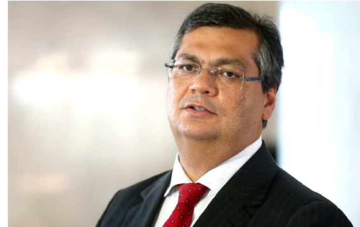
GOVERNADOR VAI ASSINAR A ORDEM DE SERVIÇO ÀS 16H

O governador Flávio Dino assinará nesta terça-feira (22), às 16h, na Ponta do São Francisco, Avenida Ferreira Gullar, ordem de serviço para início das obras integrantes do projeto denominado PAC Ponta do São Francisco. Tratam-se de obras de urbanização com investimentos na ordem de R$ 7.267.094,53 (sete milhões duzentos e sessenta e sete mil e noventa quatro reais e cinquenta e três centavos).