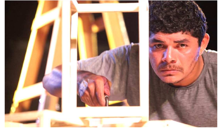
O MIOLO DA HISTÓRIA É UM DOS ESPEÁCULOS DO GEMA