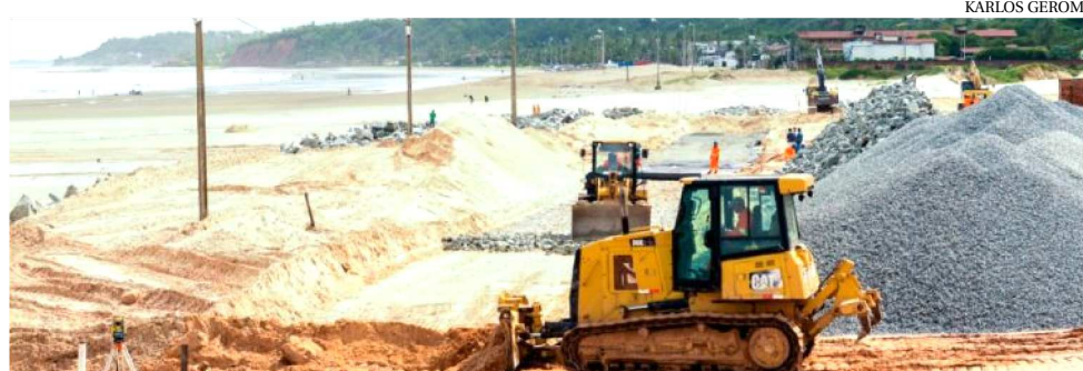
AS OBRAS DA AVENIDA LITORÃNEA JÁ ENTRARAM EM UMA NOVA ETAPA

A requalificação das Avenidas Litorânea e Holandeses para implantação do BRT deverá encurtar em mais de 40 minutos as viagens diárias de milha-