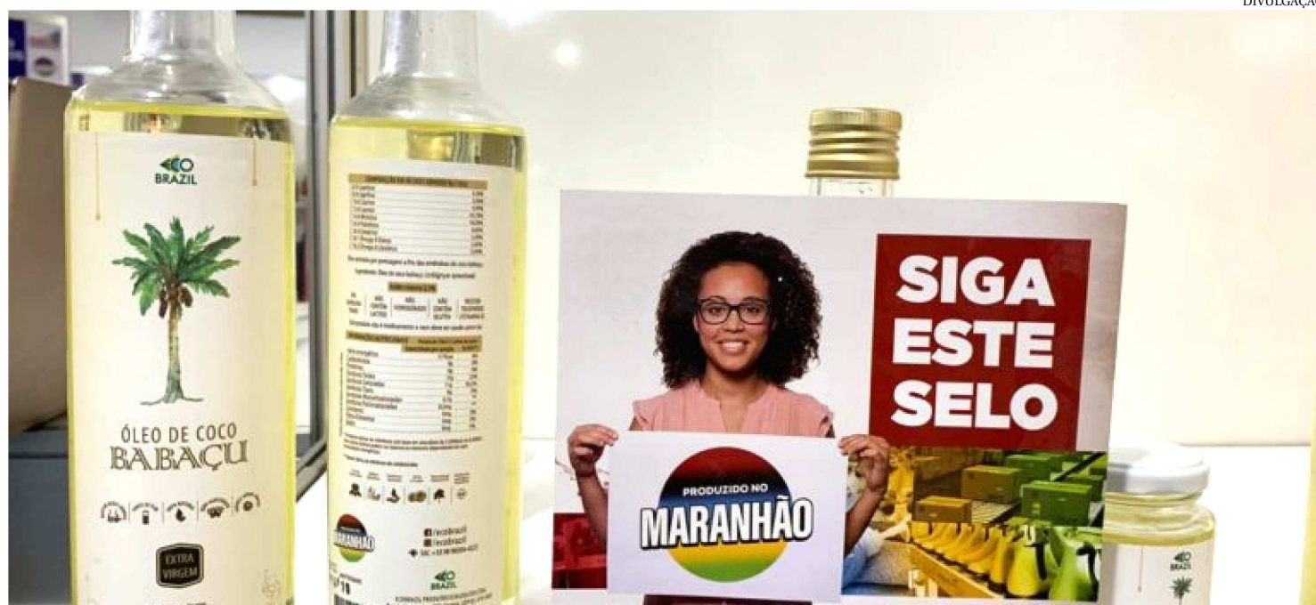
O SELO PRODUZIDO NO MARANHÃO CONTA ATUALMENTE COM 65 EMPRESAS DOS MAIS VARIADOS SEGMENTOS

Cerca de 40 empresas maranhenses tiveram a oportunidade de expor seus produtos ao público, a grandes atacadistas e varejistas e realizar tratativas comerciais durante a realização do Seminário Oportunidades para a Cadeia Produtiva do atacado e varejo supermercadista, realizado semana passada, em São Luís.