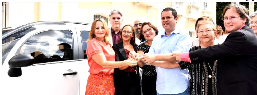
NO ATO DA ENTREGA DOS EQUIPAMENTOS, AUTORIDADES MARCARAM PRESENÇA

“A criação do abrigo será mais uma iniciativa planejada e executada por nossa gestão, como parte da política de valorização da pessoa idosa em nossa cidade. Isso denota o cuidado e o respeito com que temos tratado as questões relativas ao bem-estar dos idosos, para que vivam com mais dignidade. Para isso, temos desenvolvido um trabalho muito bem articulado com as instituições e órgãos de apoio a esse público, o que nos tem possibilitado instrumentalizar melhor o trabalho dessa rede de apoio e avançar significativamente na área. E com a criação da nova instituição de longa permanência para acolhermos e abrigarmos idosos em situação de vulnerabilidade e abandono daremos mais um grande passo em nossa política em atenção a esse público”, afirmou o