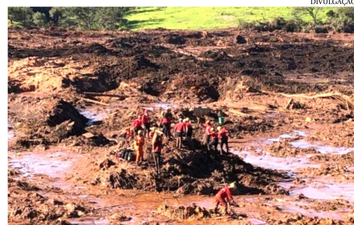
A EQUIPE DE SETE BOMBEIROS FORAM NO DOMINGO, 27

Os sete bombeiros militares enviados pelo Governo do Maranhão para dar apoio às buscas avançadas em Brumadimho (MG) começaram a compor as equipes de resgate na manhã desta terça-feira (29).