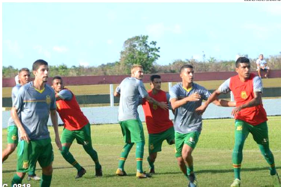
SAMPAIO ESTÁ TENDO POUCO TEMPO PARA TREINAR E MUDA O TIME A CADA JOGO

Ontem, o treinador boliviano reuniu o time no último treino antes de enfrentar o Cavalo de Aço, mas fechou