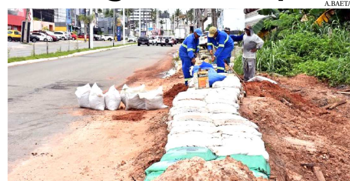
SACOS DE CIMENTO COM AREIA EVITAM O DESBARREIRAMENTO