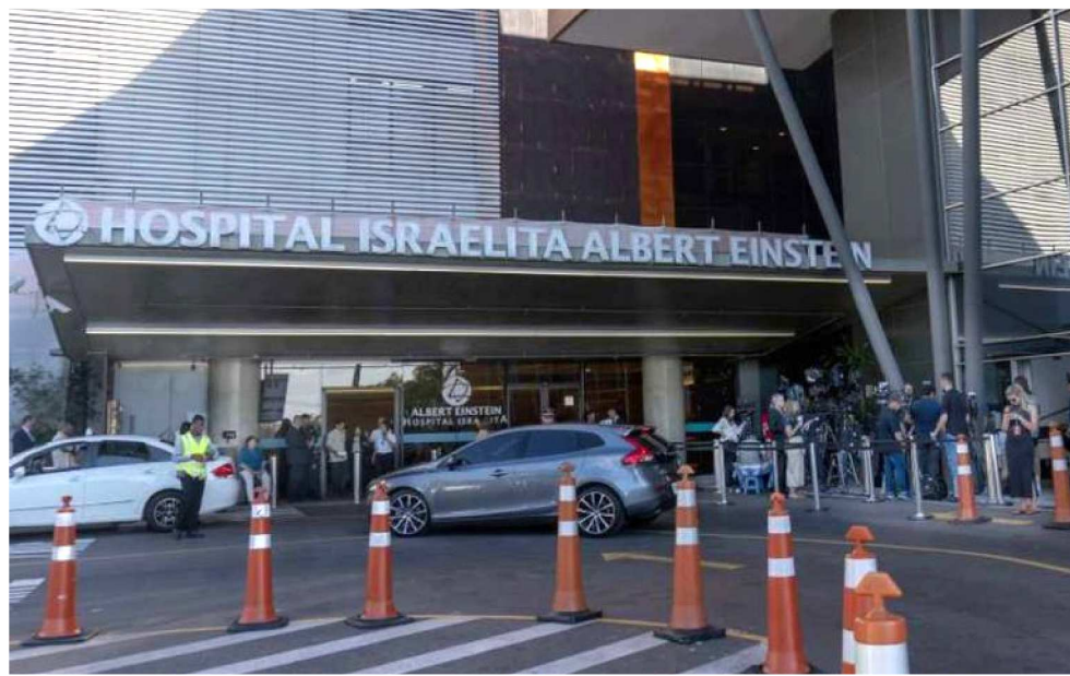
É GRANDE A MOVIMENTAÇÃO NO HOSPITAL ALBERT EINSTEIN

Até a noite de segunda, o presidente estava consciente e sem dor. Não há informação que altere a situação até o momento, de acordo com a assessoria de imprensa do Planalto. Após sete horas de cirurgia, o presidente Jair Bolsonaro teve a bolsa de colostomia retirada, e o trânsito intestinal finalmente reconstruído quase cinco meses após ser atingido por uma facada. Segundo boletim médico divulgado pelo Hospital Albert Einstein, a operação ocorreu sem complicações e, após a cirurgia, o presidente foi encaminhado para a UTI do hospital onde, até a noite desta segunda, seguia em condição estável, consciente e sem dor. Uma hora depois de concluída a cirurgia, o presidente manifestou em seu Twitter que estava bem. Postou três emojis: um com a bandeira do