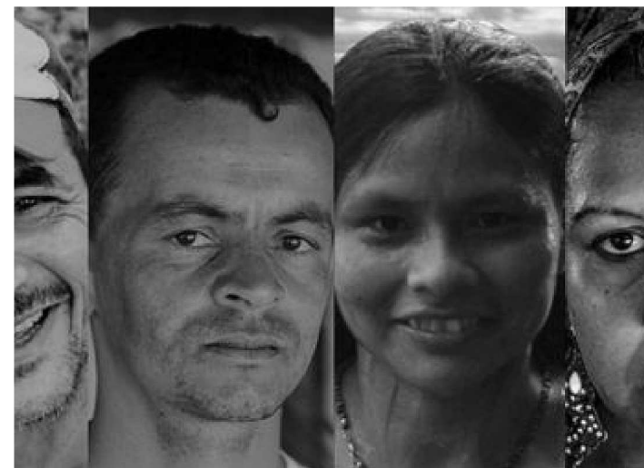
ROSTOS DO CERRADO MOSTRA A RESISTÊNCIA DOS POVOS

A Revista Cerrados analisa ainda a expansão do agro e hidronegócio na região denominada pelo governo federal de Matopiba (que engloba áreas de Cerrado dos estados do Maranhão, Tocantins, Piauí e Bahia) e a relação com outras Savanas na África e na América do Sul, como modelo de “desenvolvimento” a ser implementado em outras localidades. Todavia, em contraponto a esse cenário conflituoso, a publicação mostra a auto-organização e as resistências dos povos dos Cerrados na defesa de seus territórios, dos bens comuns e a construção contínua do Bem Viver.