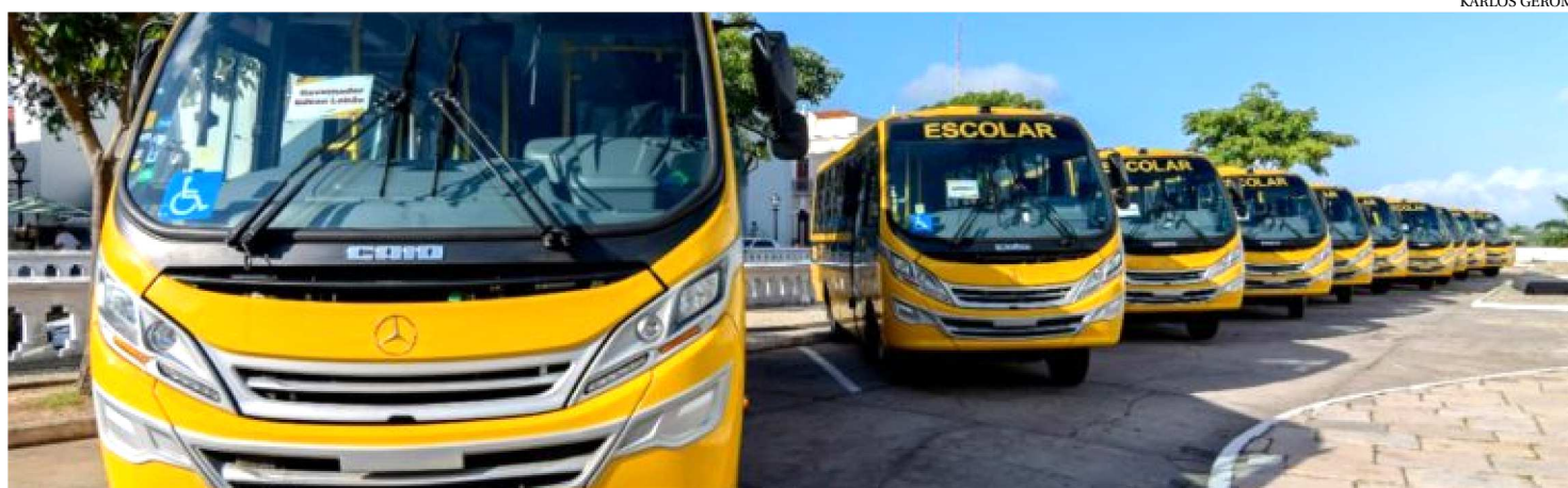
ALÉM DOS ÔNIBUS, O GOVERNO ENTREGOU LANCHAS QUE CONTEMPLAM COMUNIDADES ESTUDANTIS COM O TRANSPORTE AQUÁTICO

Um total de 3,5 mil estudantes da rede pública de 11 cidades do Maranhão terão mais qualidade, conforto e segurança na ida à escola. Na manhã desta terça-feira (29), no Palácio dos Leões, o governador Flávio Dino fez a entrega de ônibus escolares novos e equipados. Com esta entrega, totalizam 104 os veículos doados pelo Governo do Estado, via Secretaria de Estado de Educação, a municípios maranhenses, entre estes, duas lanchas. Para as aquisições, foram investidos recursos de R$ 2,4 milhões.