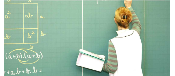
AS INSCRIÇÕES ESTARÃO ABERTAS ATÉ DIA 22 DE FEVEREIRO

A Secretaria de Estado da Educação (Seduc) informa aos interessados que encontram-se abertas até o dia 22 de fevereiro (sexta-feira) as inscrições para a bolsa de estudos MEXT de Treinamento de professores oferecida pelo governo japonês.