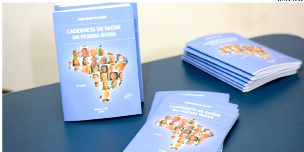
A CADERNETA TRAZ INFORMAÇÕES RELEVANTES SOBRE A SAÚDE DA PESSOA IDOSA

“A evolução da adesão a caderneta da pessoa idosa no estado se iniciou no final de 2015 e foi sendo feita de forma gradativa. Tivemos adesão dos primeiros 30 municípios em 2016, 151 em 2017 e 217 adesões em 2018, fa-