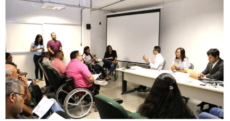
A REUNIÃO FOI A PRIMEIRA ETAPA DO DIÁLOGO

A Secretaria de Estado da Saúde (SES) e movimentos sociais iniciaram, na segunda-feira (29), as discussões para a criação da Coordenação de Atenção à Saúde da Pessoa com Deficiência, que integrará a estrutura da Secretaria Adjunta da Política de Atenção Primária e Vigilância em Saúde da SES. O setor ficará responsável, dentre outras coisas, por articular e acompanhar a política de saúde da pessoa com deficiência, observados os princípios e diretrizes do SUS.