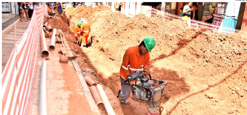
OBRAS CHEGAM À OITAVA QUADRA. NA QUINTA ESTÃO SENDO COLOCADOS OS POSTES

A requalificação urbanística da Rua Grande no sentido Deodoro – João Lisboa, a partir da Rua do Passeio, foram iniciadas em abril de 2018. “As