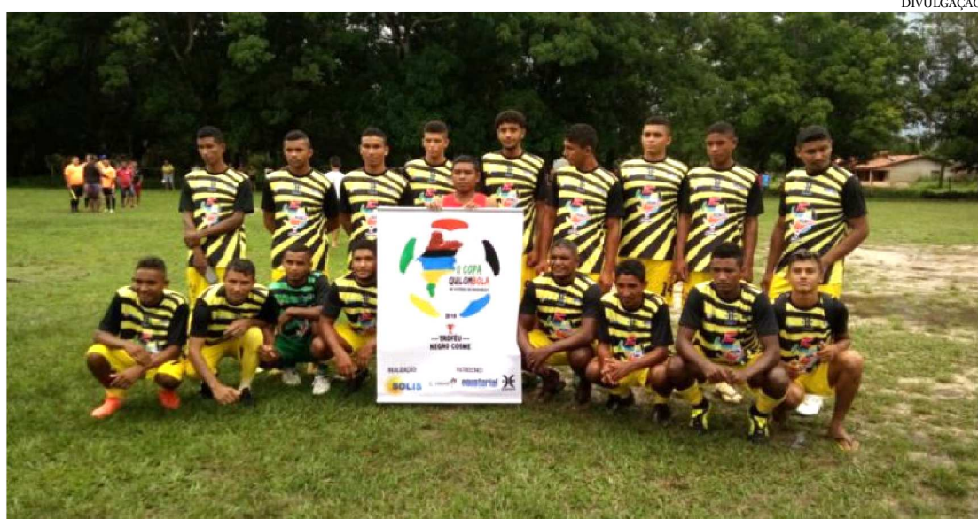
QUILOMBOLAS PRESTIGIAM EVENTO ESPORTIVO EM CLIMA DE FESTA DE CONFRATERNIZAÇÃO

Começou mais uma etapa da Copa Quilombola de Futebol, envolvendo quilombos de 16 cidades do Maranhão. Os jogos acontecem nos campos das próprias comunidades e os atletas são moradores destes quilombos.