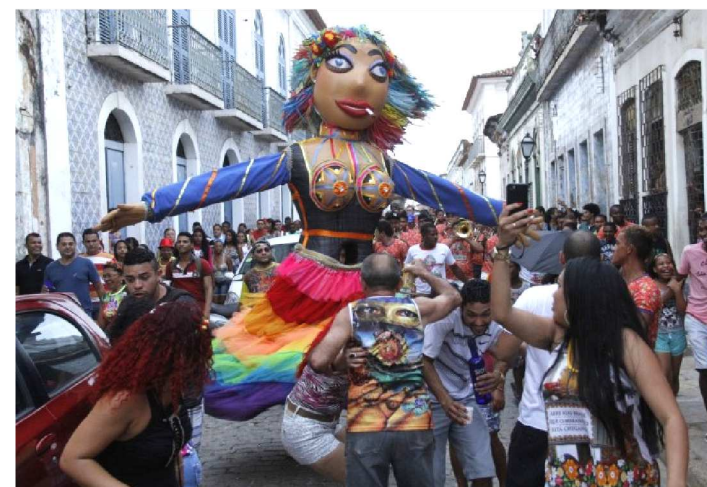
A CONCENTRAÇÃO SERÁ ÀS 16H, NA FONTE DO RIBEIRÃO

Neste fim de semana, a Banda Bandida volta às prévias carnavalescas com o primeiro cortejo de 2019. Todos os fins de semana até o carnaval, a Bandida pretende reunir um grupo de foliões que preferem o carnaval das antigas e com a cara do Maranhão.