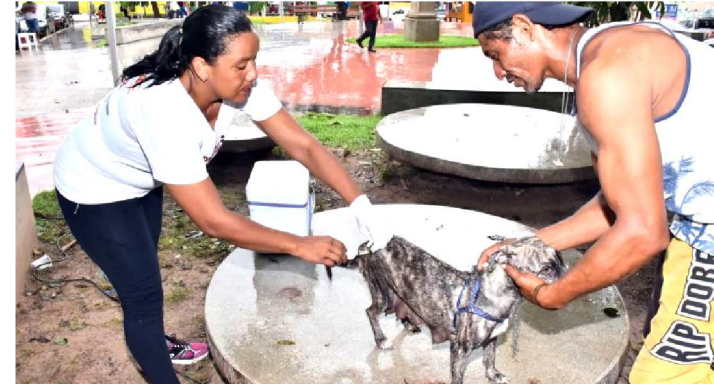
VACINADORA IMUNIZA CÃO NO PRIMEIRO DIA DA CAMPANHA

Mais de 160 mil animais devem ser imunizados durante a Campanha de Vacinação Antirrábica, iniciada nesta sexta-feira (8), na capital. A ação leva agentes de saúde da Prefeitura de São Luís de casa em casa para vacinar cães e gatos e, assim, manter a cidade livre da raiva e garantir a saúde do animal e da população. Coordenada pela Secretaria Municipal de Saúde (Semus), a campanha integra a política pública de saúde da gestão do prefeito Edivaldo Holanda Júnior. A vacinação prossegue até o mês de abril, sempre às sextas e aos sábados.