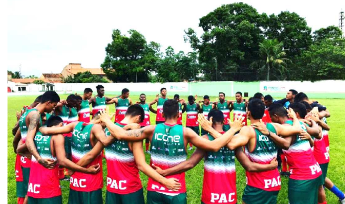
TIME DO PINHEIRO ESTÁ UNIDO EM BUSCA DA CLASSIFICAÇÃO