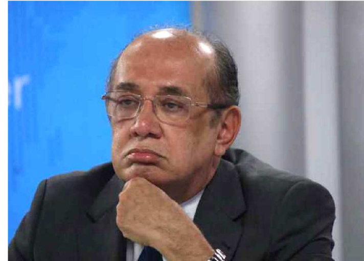
GILMAR MENDES É INVESTIGADO PELA RECEITA FEDERAL

Em ofício enviado ao presidente do Supremo Tribunal Federal (STF), Dias Toffoli, o também ministro da Corte Gilmar Mendes alega ser alvo de “abuso de autoridade” e pede atitude por parte de seus pares. Mendes é alvo de um procedimento da Receita Federal que apura “focos de corrupção, lavagem de dinheiro, ocultação de patrimônio e tráfico de influência”.