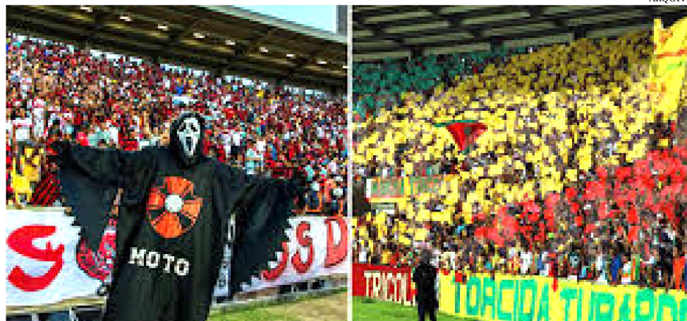
CASTELÃO ESTÁ PRONTO PARA RECEBER AS DUAS MAIORES TORCIDAS DO ESTADO

Tanto Moto quanto Sampaio Corrêa tinham dúvidas na escalação de