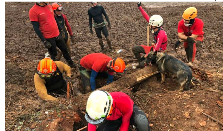
OS MARANHENSES SE MANTÊM EM DUAS EQUIPES NO LOCAL

A tragédia de Brumadinho completou o 15º dia nesta sexta-feira (8). O corpo de Bombeiros de Minas Gerais já contabilizou 157 mortos e outros 182 continuam desaparecidos. Nesta semana, a equipe do Maranhão recebeu mais quatro bombeiros, que já reforçam o trabalho de buscas por todo o caminho de lama e destruição provocado pelo rompimento da barragem.