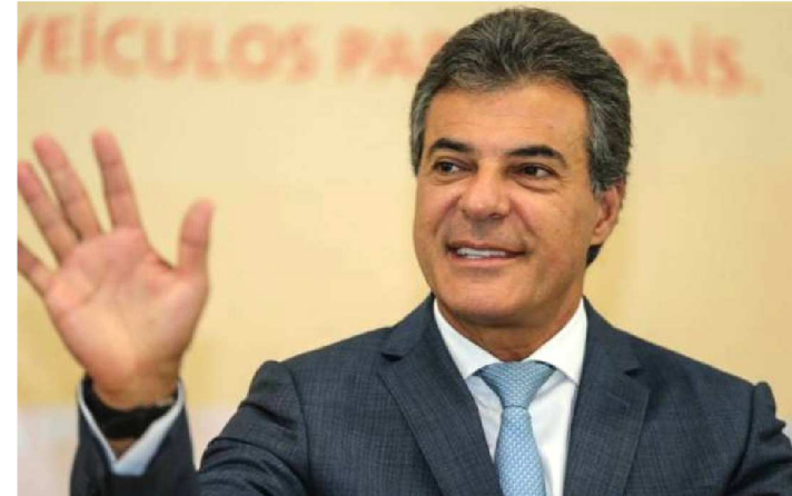
BETO RICHA FOI BENEFICIADO POR HABEAS CORPUS