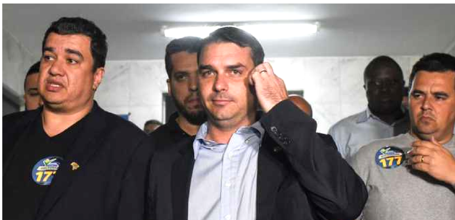
FLÁVIO BOLSONARO TEVE NOVA INVESTIGAÇÃO ABERTA PELO NÚCLEO DE COMBATE À CORRUPÇÃO DO MINISTÉRIO PÚBLICO

Uma nova investigação sobre o senador Flávio Bolsonaro (PSL-RJ) foi aberta, desta vez no Núcleo de Combate à Corrupção do Ministério Público Federal (MPF). Neste procedimento, o órgão vai analisar a evolução patrimonial do senador. A investigação foi aberta depois de um advogado ter enviado uma denúncia contra o parlamentar.