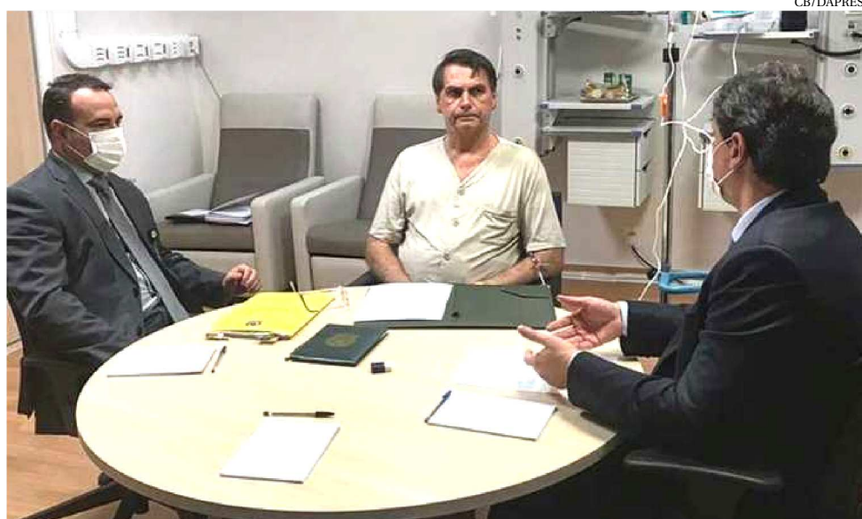
PRESIDENTE BOLSONARO APRESENTA QUADRO DE MELHORA E JÁ RETIROU A SONDA

O presidente continuou sem compromissos oficiais na agenda de ontem (sexta-feira). Ele está internado desde o dia 27 de janeiro para fazer