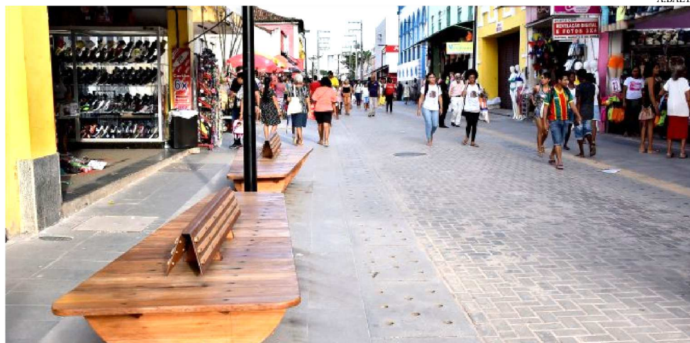
EM REFORMA, A RUA GRANDE VAI RECEBER QUATRO BANCOS EM CADA QUADRA