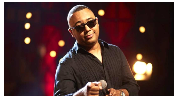
DUDU NOBRE É UMA DAS GRANDES ATRAÇÕES DO CARNAVAL

O Governo do Maranhão anunciou a programação oficial do Carnaval de Todos 2019. O evento promovido pelo Governo do Maranhão, por meio da Secretaria de Estado de Cultura e Turismo (Sectur), em parceria com a Prefeitura de São Luís, foi divulgado nesta semana.