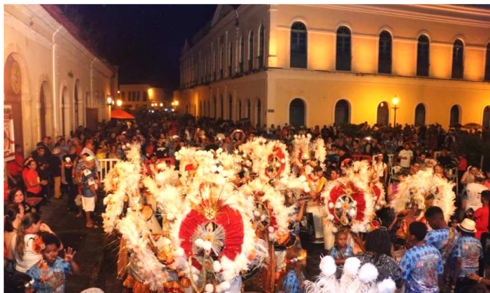
A FESTA COM MUITO SAMBA COMEÇA ÀS 18H COM O GRUPO FEIJOADA COMPLETA

Em parceria com a Secretaria de Estado da Cultura e Turismo do Governo do Maranhão – responsável pelas atrações culturais, palco, som, iluminação e segurança –, o Bloco da Imprensa apresenta o tema 'Vamos Colorir!'. Os profissionais da comunicação devem usar camisas brancas, pois as mesmas recebem um colorido especial, por artistas grafiteiros que vão