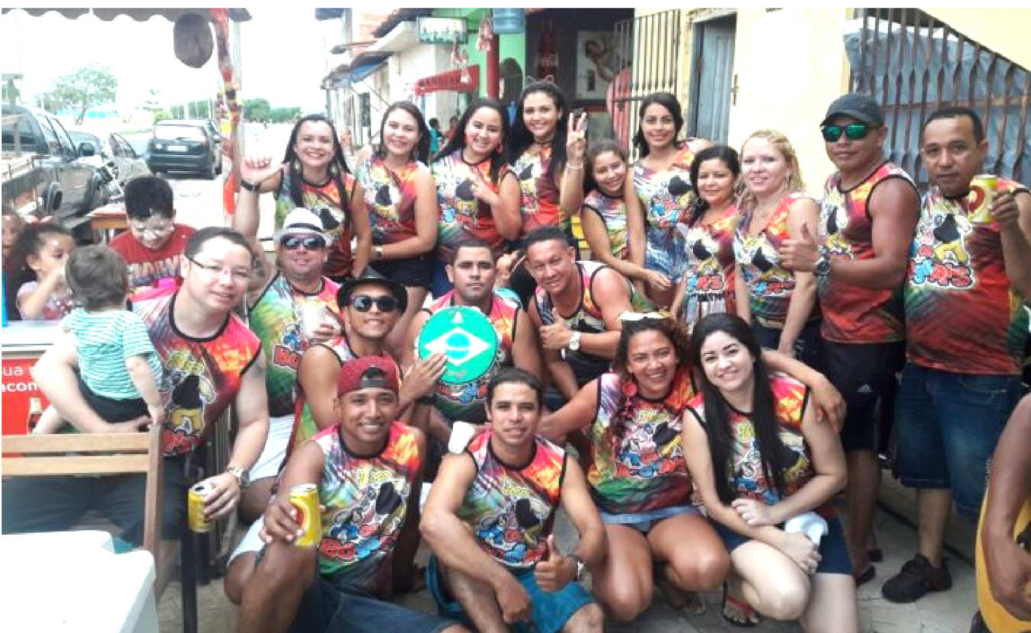
BLOCO "OS BOSSAIS" FAZ SUA PRÉVIA NA AVENIDA FERREIRA GULLAR, PRÓXIMO À OFICINA MARTELINHO DE OURO, NO SÃO FRANCISCO