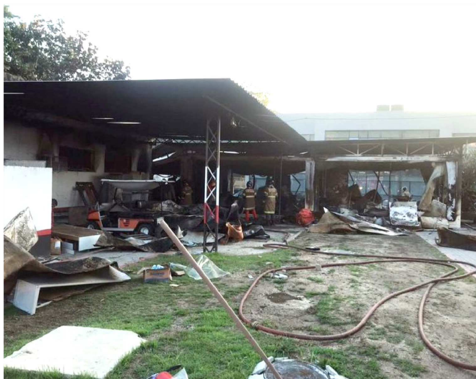
PARTE DAS INSTALAÇÕES DO NINHO DO URUBU DESTRUÍDAS PELO INCÊNDIO

O certificado de aprovação atesta a existência e o funcionamento dos dispositivos contra incêndio previstos pela legislação vigente. A documentação