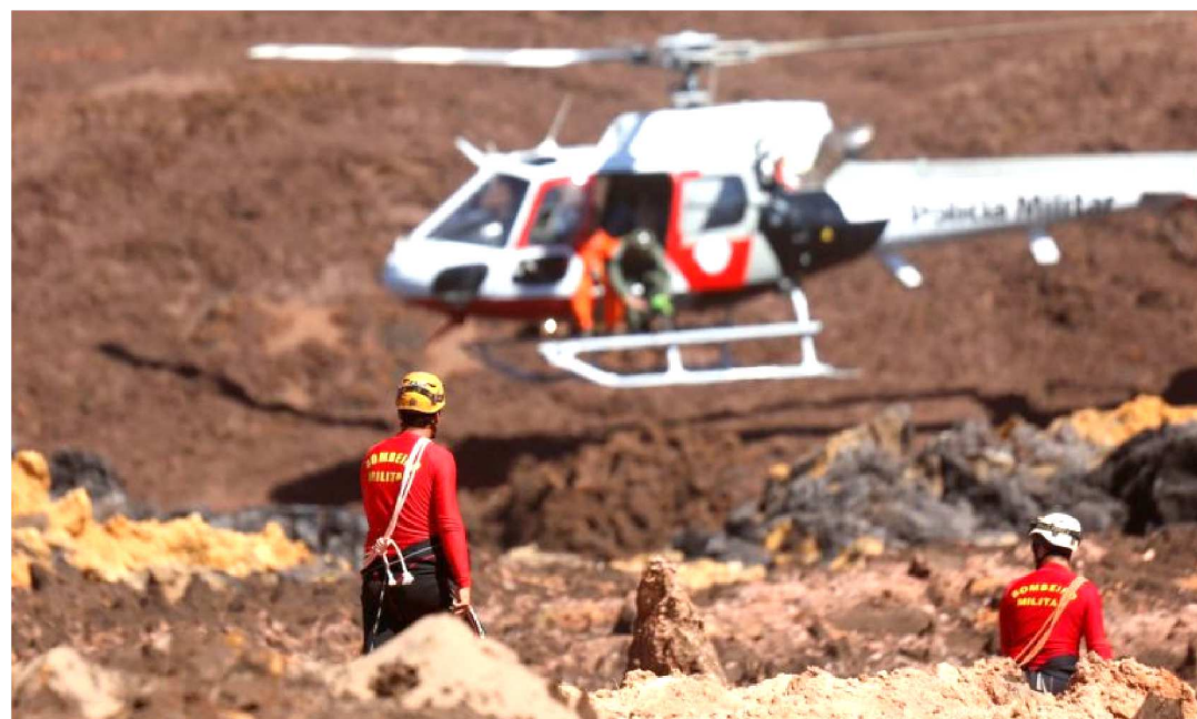
A TRAGÉDIA DEIXOU CERCA DE 165 MORTOS E 155 PESSOAS QUE AINDA ESTÃO DESAPARECIDAS

Oito funcionários da mineradora Vale foram presos temporariamente, ontem, sexta-feira (15), em uma operação deflagrada pelo Ministério Público de Minas Gerais (MPMG), com o apoio das polícias civis e militares dos estados de Minas Gerais, São Paulo e Rio de Janeiro.