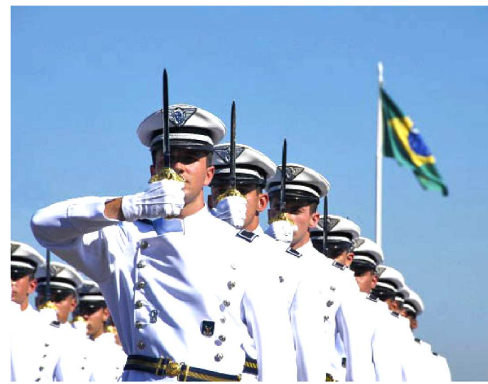
AS CHANCES SÃO DISTRIBUÍDAS EM VÁRIAS ESPECIALIDADES

Já foi oficializada a abertura do concurso da Aeronáutica de 2019 para admissão ao curso de formação de sargentos. No total, o edital oferece 227 vagas.