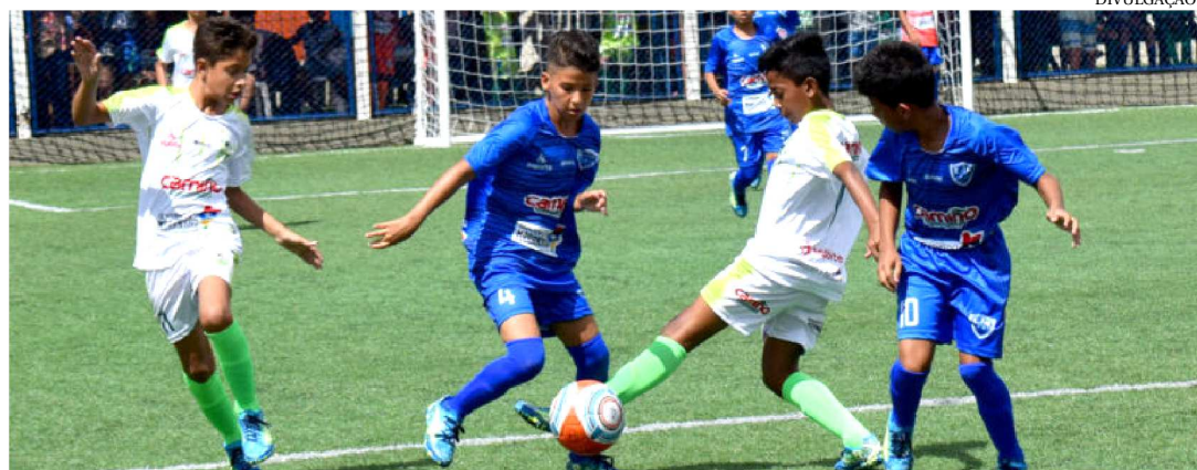
GAROTADA TEM JOGOS DECISIVOS NESTE SÁBADO PELA MANHÃ, NA COPA INTERBAIRROS

Chegou o grande dia. Neste sábado (16), serão conhecidos os campeões da primeira edição da Copa Interbairros de Futebol 7, competição patrocinada pelo governo do Estado e pelo El Camiño Supermercados por meio da Lei de Incentivo ao Esporte e que possui o apoio da Federação Maranhense de Futebol 7. As decisões das categorias Sub-11 e Sub-13 serão realizadas a partir das 9h40, no campo da A&D Eventos, no bairro do Turu.