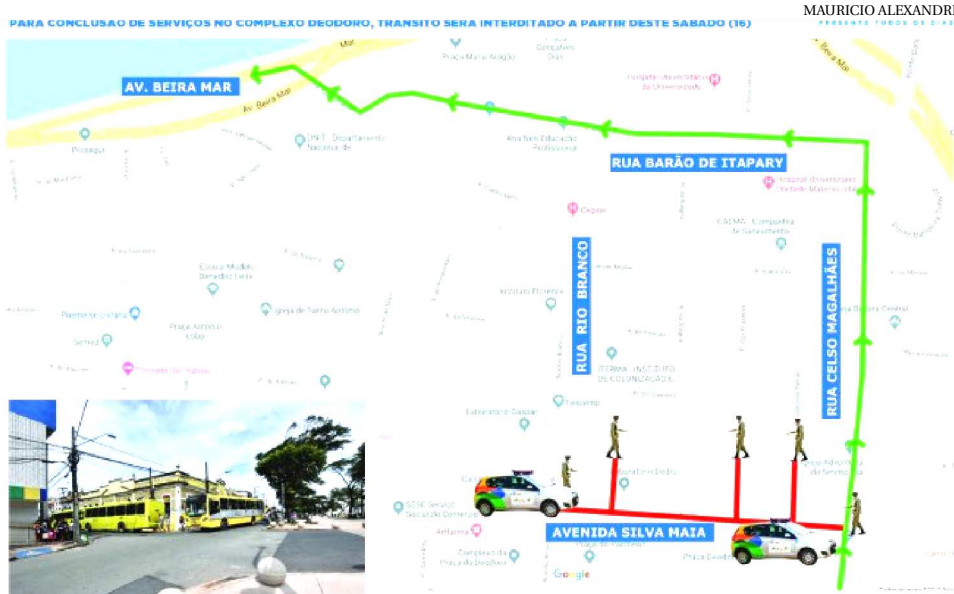
AVENIDA SERÁ INTERDITA NESTE SÁBADO, ÀS 13H, PARA REALIZAÇÃO DE OBRAS

Para facilitar embarque e desembarque de passageiros, os ônibus que antes circulavam pela Rua Rio Branco