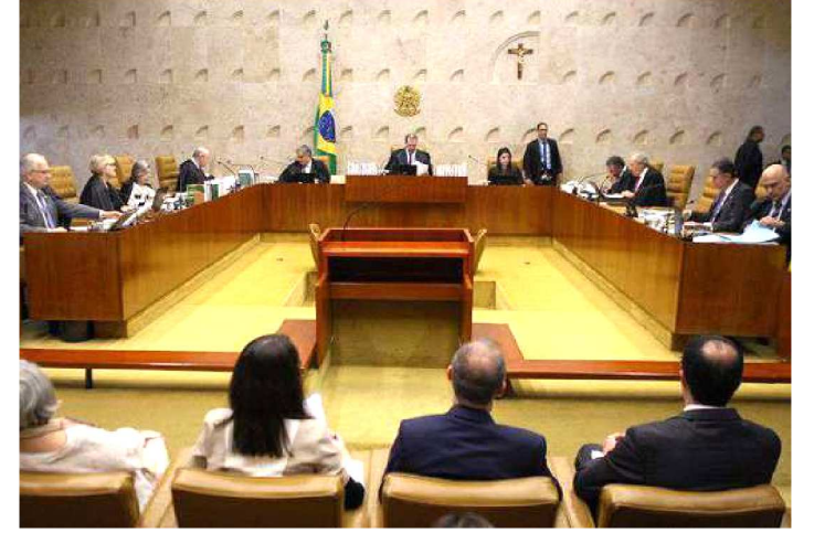
TRIBUNAL REJEITOU HC POR UNANIMIDADE DE VOTOS