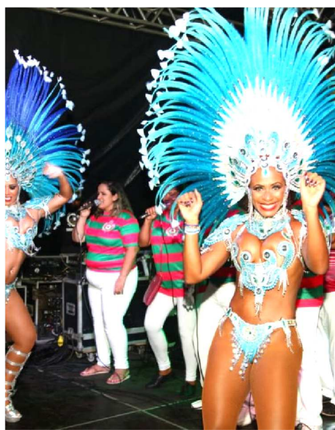
No roteiro musical deste sábado

Atrações: Grupo Madrilenus, Bloco Tradicional 'Os Feras', Banda do Bicho Terra, Bateria 'Explosão', da Turma do Quinto e Banda Makina do Tempo.