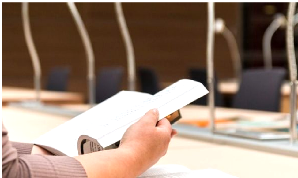
UMA DAS CONDIÇÕES PARA CERTAMES É A DIGITALIZAÇÃO DOS SERVIÇOS OFERTADOS

estão os do INSS (Instituto Nacional de Seguridade Social), IBGE (Instituto Brasileiro de Geografia e Estatística) e TCU (Tribunal de Contas da União). A lei 13.808, sancionada em 16 de janeiro pelo presidente Jair Bolsonaro, que estabelece o orçamento federal de 2019, prevê nada menos do que 48.224 vagas, sendo 43.373 para preenchimento e 4.851 para novos cargos que estão sendo criados. A expectativa é de que estes concursos passem a ser autorizados gradualmente, assim que publicado o novo decreto e comprovadas as condições necessárias, pelos respectivos órgãos.