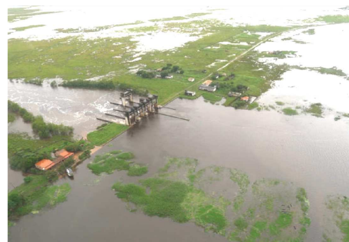
BOMBEIROS FIZERAM VISTORIAS NA BARRAGEM