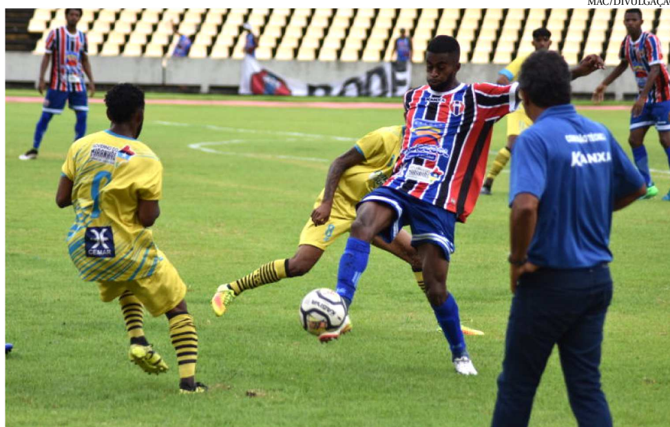
DEPOIS DE GOLEAR O SANTA QUITÉRIA, MAC SE PREPARA PARA ENCARAR IMPERATRIZ