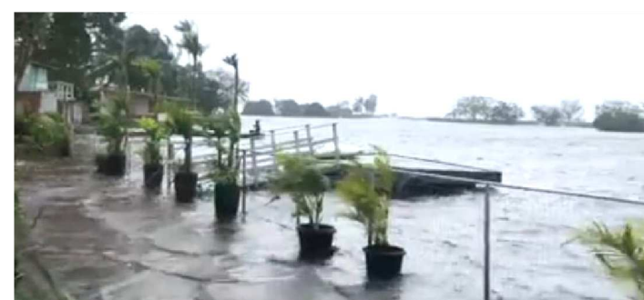
VÁRIOS BAIRROS DE PINHEIRO FORAM INUNDADOS PELO RIO