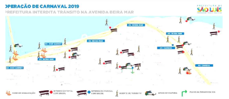
A ALTERAÇÃO SERÁ REALIZADA EM VÁRIAS RUAS DA CIDADE

Como vem fazendo desde o dia 2 de fevereiro, a Prefeitura de São Luís realizará, neste fim de semana, mais uma operação para orientar os condutores durante as prévias carnavalescas. Organizado pela Secretaria Municipal de Trânsito e Transportes (SMTT), o trabalho de interdição no Centro visa garantir a mobilidade urbana, a manutenção do transporte coletivo e o espaço para a realização dos eventos. A mudança no trânsito acontece aos sábados (dias 16 e 23), das 14h às 20h e altera as rotas dos ônibus e demais veículos que descem para a Praça Maria Aragão utilizando a Rua Rio Branco. Já nos domingos (17 e 24) o entorno da Praça Benedito Leite, onde ocorre a Feirinha São Luís, também será interditado.