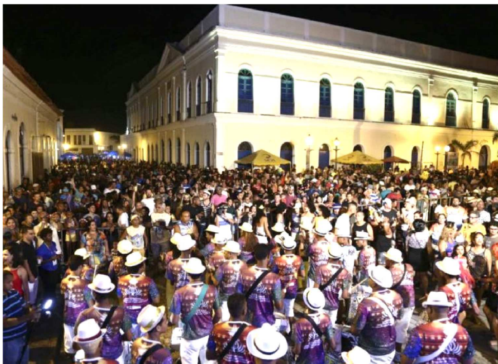
MUITA FOLIA PROGRAMADA PARA O ÚLTIMO FIM DE SEMANA DO BLOCO DA IMPRENSA

Para oferecer o melhor da rica diversidade cultural maranhense aos profissionais da comunicação, turistas e foliões, o Governo do Maranhão, por meio da Secretaria de Cultura e Turismo (Sectur), e o Bloco, em parceria, selecionaram mais uma programação musical de primeiríssima qualidade para animar os foliões de todas as tribos e idades.