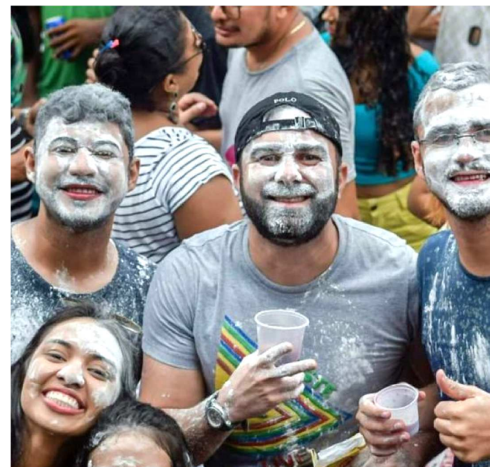
PRÉ-CARNAVAL AGITA CENTRO HISTÓRICO DE SÃO LUÍS