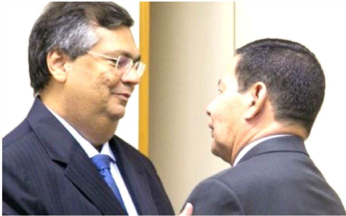
O FATOR IDEOLÓGICO NÃO IMPEDIU O GOVERNADOR DO PCDOB DE MANTER ENCONTRO COM O VICE-PRESIDENTE HAMILTON MOURÃO