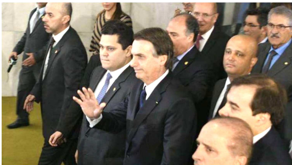
PRESIDENTE BOLSONARO FOI PESSOALMENTE AO CONGRESSO ENTREGAR A PROPOSTA

Já na sede do Ministério do Trabalho, o detalhamento da proposta ficou