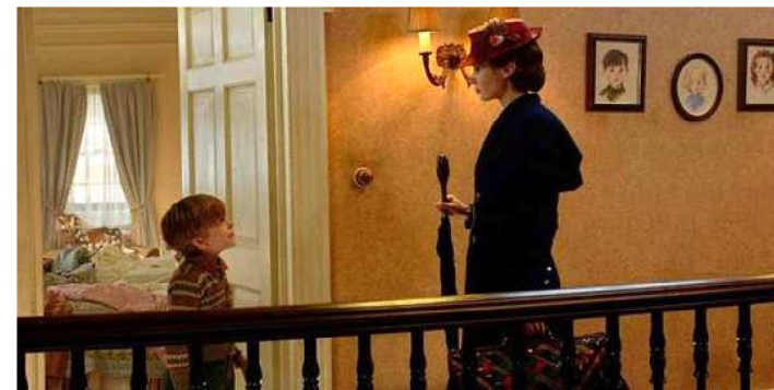
O RETORNO DE MARY POPPINS: ATRIZ FOI ESQUECIDA

Contra a acentuada queda de audiência que tem acompanhado a festa do Oscar, com os espectadores mais jovens ressentidos de uma maior representação dos filmes que julgam bons, a Academia de Artes e Ciências Cinematográficas, por meio de comitê, teve uma ideia que, fragilizada na mídia e nas redes sociais, não emplacou: queriam criar uma categoria que acolhesse o gosto da maioria dos pagantes de bilheterias. A resistência porém não limitou a projeção de um fenômeno de audiência que, com mensagem poderosa, foi incluído entre os dez finalistas a melhor filme: Pantera Negra .