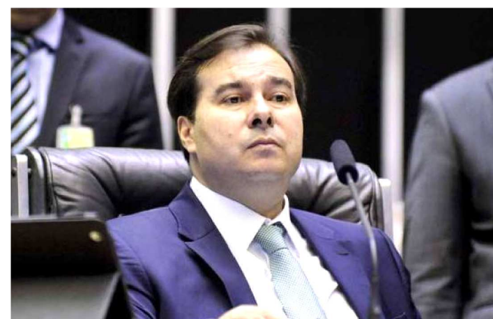
RODRIGO MAIA VAI CONDUZIR OS DEBATES

Os principais pontos da Reforma da Previdência proposta pelo governo Bolsonaro