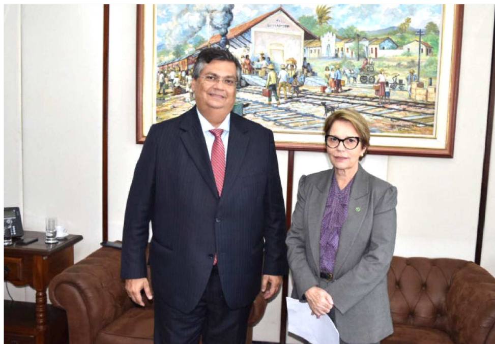
“O GOVERNADOR ME TROUXE ALGUNS PLEITOS INTERESSANTES”, DISSE A MINISTRA

A medida visa o aumento do número de postos de trabalho e da renda das famílias rurais, diminuição das