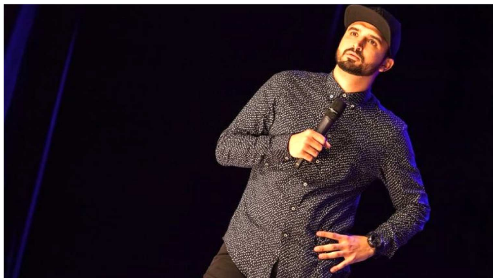
THIAGO VENTURA SE APRESENTA NO DIA 29 DE MARÇO NA CAPITAL MARANHENSE

Em seu terceiro show solo Pokas , Thiago Ventura faz piadas e conta histórias engraçadas sobre os seus últimos anos como comediante de stand up. Fala da liberdade de expressão, livre arbítrio, sexualidade, drogas, dogmas e da vida pessoal, sempre com seu inconfundível estilo da quebrada.