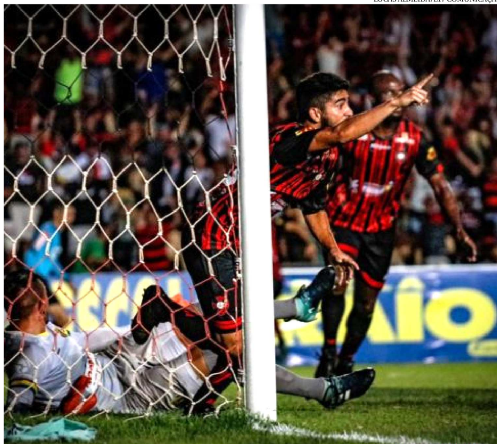
TIME DO MOTO CLUB É O LÍDER DA COMPETIÇÃO COM 100% DE APROVEITAMENTO

Já a equipe do Santa Quitéria, time que está bem próximo da Onça na tabela, também vem mal e somou só um ponto. Após demorar para estreiar