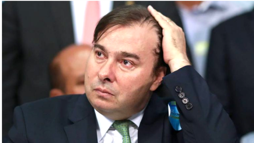
RODRIGO ESTÁ SOB AMEAÇA DOS CONGRESSISTAS

"O problema é que esse governo não tem traquejo político e é muito enrolado", afirmou o líder do PP,