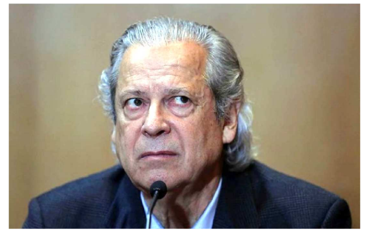
TRIBUNAL FEDERAL NEGA RECURSOS DE ZÉ DIRCEU

Os desembargadores da 4ª Seção do Tribunal Regional Federal da 4ª Região (TRF-4) negaram provimento nesta quinta-feira (21/2) por maioria, aos embargos infringentes do ex-ministro José Dirceu (Casa Civil/governo Lula) nos autos da Operação Lava Jato, mantendo a pena de 8 anos, 10 meses e 28 dias de reclusão imposta ao petista. Ainda cabe recurso de embargos de declaração nos embargos infringentes, informou o TRF-4.