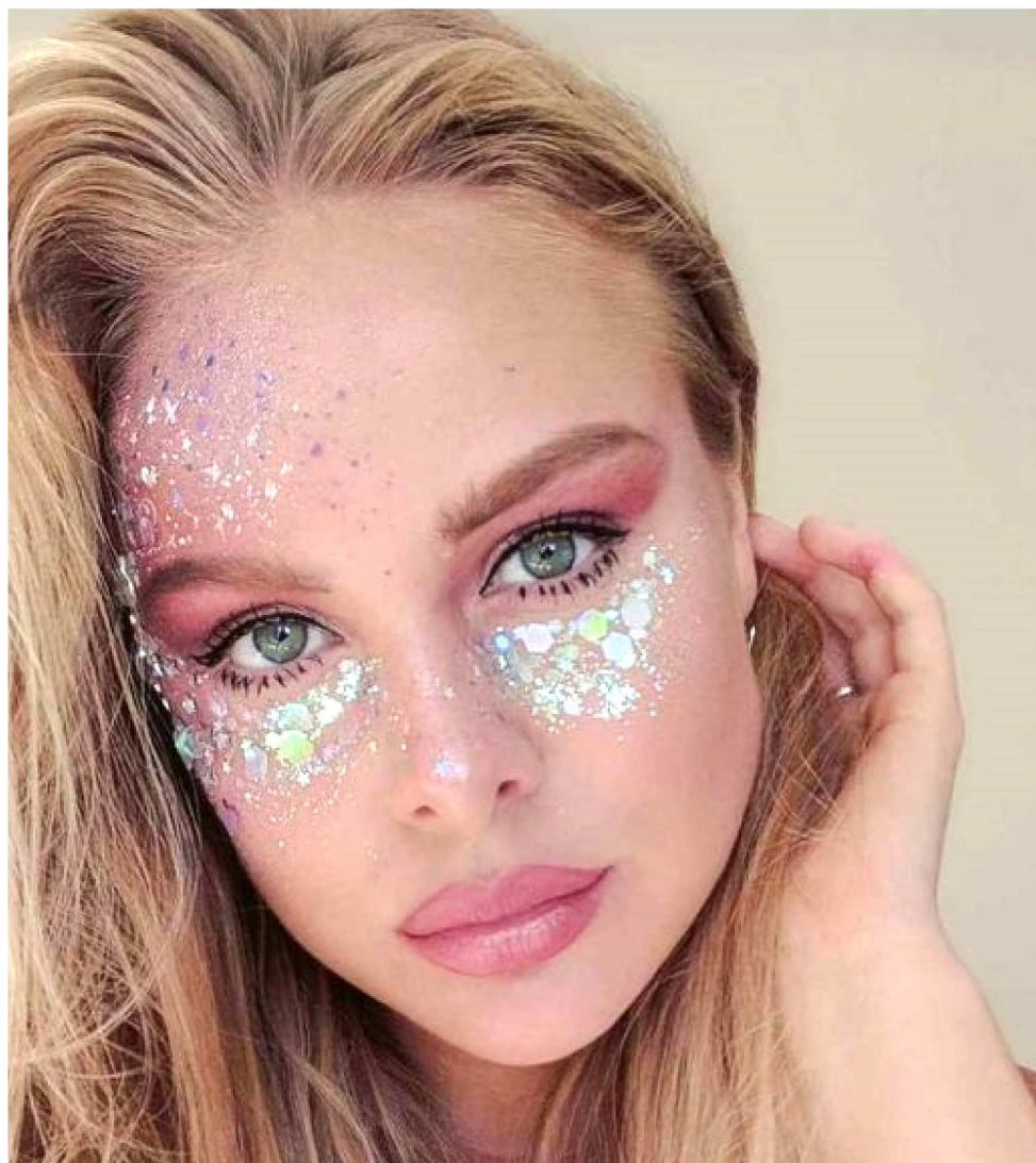
ARRANHAR A CÓRNEA É UM DOS PROBLEMAS MAIS RECURRENTES E PRECUPANTES

Neves também chama atenção para um tipo de conjuntivite relacionado a produtos de beleza que não são armazenados da maneira correta ou que já passaram do prazo de validade. “A maioria dos itens de maquiagem