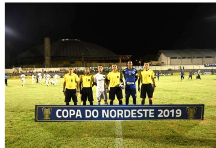
ÁRBITROS DO MARANHÃO NA COPA DO NORDESTE DESTA ANO

Apesar das várias reclamações durante o Campeonato Maranhense por parte das equipes, a arbitragem maranhense está prestigiada no cenário nacional. Na próxima rodada da Copa do Nordeste, dois jogos serão comandados por árbitros locais.