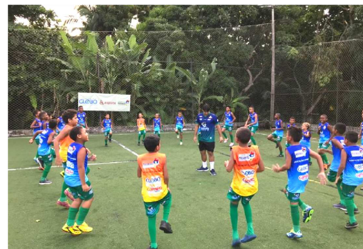
ESCOLINHA DE FUTEBOL CHEGA À SUA TERCEIRA EDIÇÃO

Com o objetivo de utilizar a prática esportiva como ferramenta de inclusão social, o Projeto Educação e Esporte – Escolinha de Futebol chega à sua terceira edição. Patrocinado pelo Governo do Estado, por meio da Lei de Incentivo ao Esporte, a escolinha é destinada a crianças carentes da região da Vila Conceição, em São Luís. O lançamento da escolinha ocorrerá, hoje, sábado (23), às 10h, na Associação dos Médicos, localizada no Altos do Calhau.