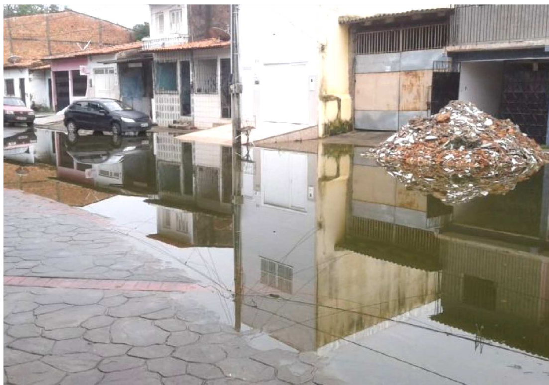
VIAS DE ACESSO PARA A PRAÇA MARECHAL LOTT ESTÃO COMPLETAMENTE ALAGADAS

Com o acúmulo de água, em decorrência das fortes chuvas na capital, moradores do bairro Monte Castelo sofrem com o período de chuvas. São dejetos espalhados, ruas esburacadas e alagamentos.