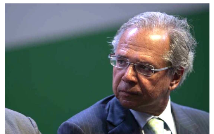
PAULO GUEDES ESTÁ OTIMISTA

O ministro da Economia, Paulo Guedes, afirmou nesta sexta-feira (22/2), que está otimista com a tramitação da Proposta de Emenda Constitucional (PEC) de reforma da Previdência no Congresso Nacional. Segundo ele, a aprovação do projeto deve vir ainda no primeiro semestre.