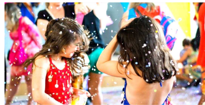
PARA CRIANÇAS, A FESTA SERÁ COM O BLOQUINHO DO JUBA

A pré-temporada carnavalesca está chegando ao fim e abrindo espaço para o carnaval. A folia também pede passagem no Rio Anil Shopping, que preparou uma programação para a família inteira se divertir unida – incluindo os cachorrinhos de estimação – hoje, sábado (23).