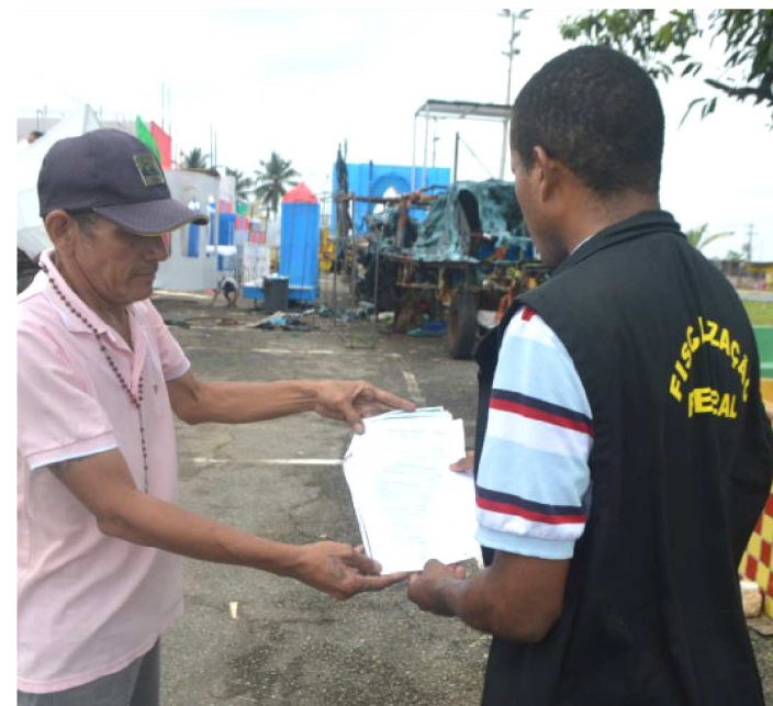
VISTORIA DO CREA OCORREU EM TODA A ESTRUTURA DA FESTA

O Crea, com a Operação Folia, está fiscalizando nos barracões das escolas a existência de responsáveis técnicos pela manutenção, montagem e proteção contra incêndio dos carros alegóricos que irão desfilar no Carnaval 2019. Também faz parte da Operação Folia, a fiscalização de clubes, a passarela do samba e casas de shows que realizarão bailes de carnaval.