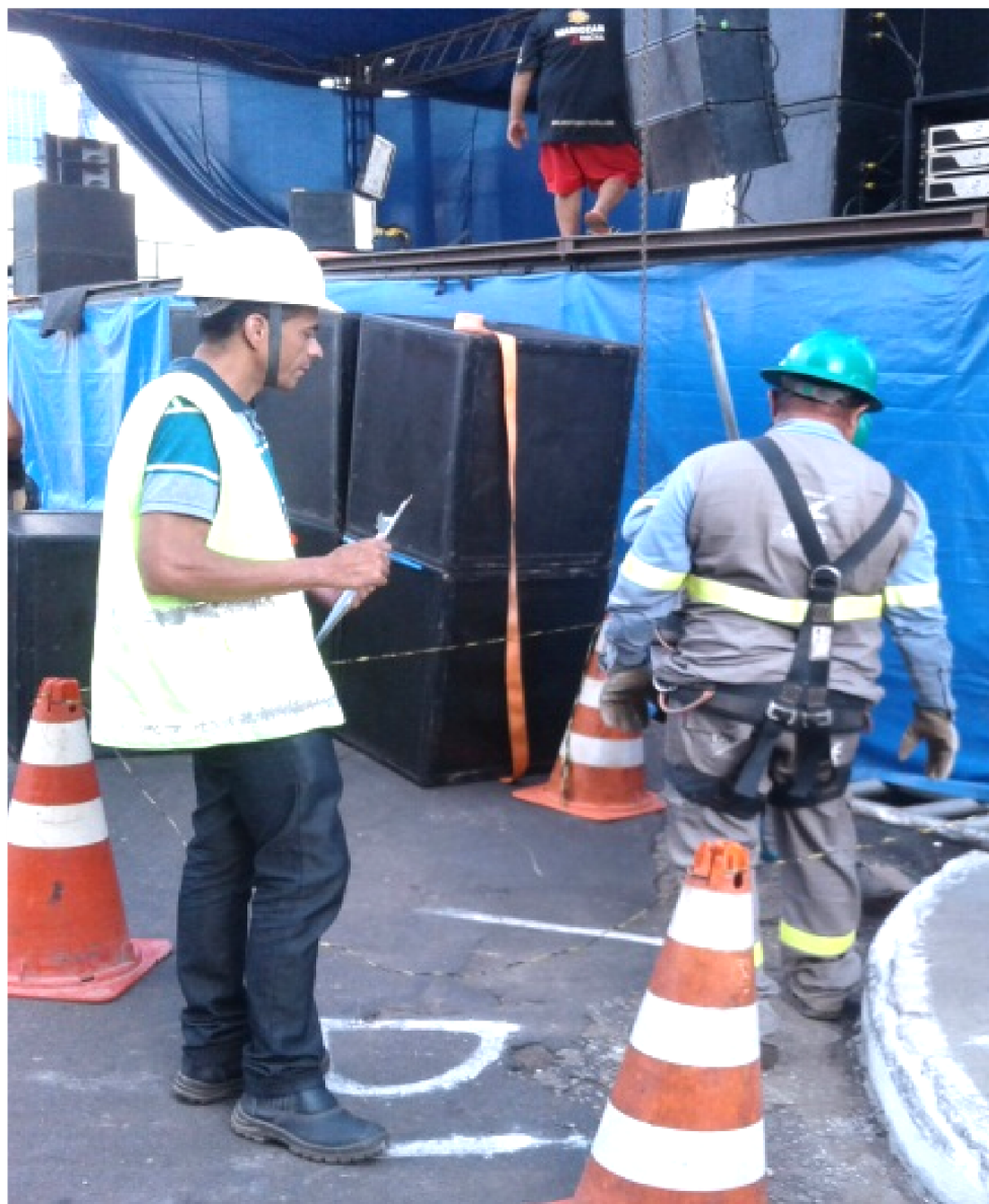
VISTORIA CEMAR INICIOU PELOS BARRACÕES DAS ESCOLAS DE SAMBA DE SÃO LUÍS

As visitas foram nos barracões da Favela do Samba, Flor do Samba, Império Serrano, Túnel do Sacavém, Tur-