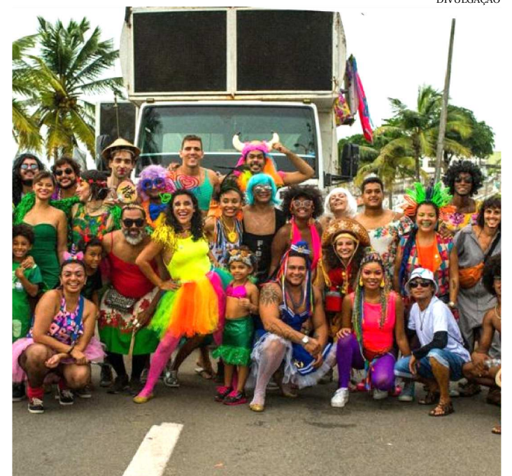
O SÓ SAFADOS FICOU CONHECIDO PELO HUMOR E DIVERSIDADE

Este último sábado (23) do Pré-Carnaval de Todos em São Luís tem tudo para ser o mais animado, lotado e comentado até agora. O Bloco Só Safados faz a última saída na Beira-Mar. Quem já viu quer ver de novo. Quem ainda não viu não quer perder a última chance. O resultado vai ser uma multidão tomando conta do espaço.