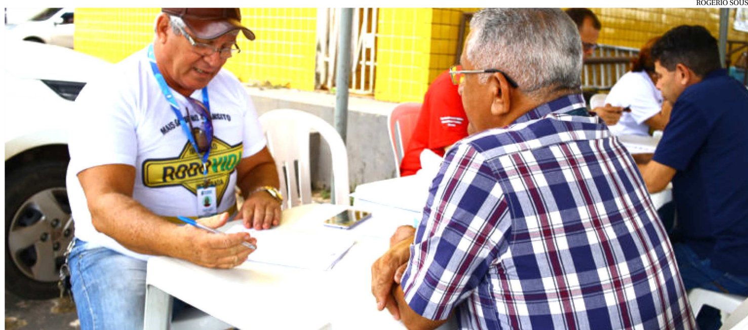
AS AÇÕES TÊM O PROPÓSITO DE REFORÇAR A PREVENÇÃO DE ACIDENTES E OFERTAR SERVIÇOS BÁSICOS PARA OS MOTORISTAS

Para promover um trânsito seguro, o Governo do Maranhão e a Polícia Rodoviária Federal (PRF) iniciaram, sexta-feira (22), a segunda etapa do programa Rodovida. As ações têm o propósito de reforçar a prevenção de acidentes e ofertar serviços básicos de saúde para os motoristas que trafegam na BR-135. A atividade prossegue até 9 de março.