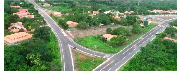
A RODOVIA ESTÁ PAVIMENTADA E TOTALMENTE SINALIZADA

Mais uma rodovia maranhense totalmente pavimentada e sinalizada. A obra na MA-110, estrada que faz a conexão do município de São Bernardo (Maranhão) até a cidade de Luzilândia (Piauí), se soma aos mais de 1.200 km de vias pavimentadas por meio do Programa Mais Asfalto executado pela Secretaria de Estado da Infraestrutura (Sinfra). Apesar de não ter sido inaugurada oficialmente na sexta-feira (22), como estava previsto, por conta das condições do tempo, a população de ambos os estados reconhece a obra como um marco para a região, a pavimentação da rodovia, que era um sonho de muitas décadas e agora foi concretizado pelo Governo do Maranhão.