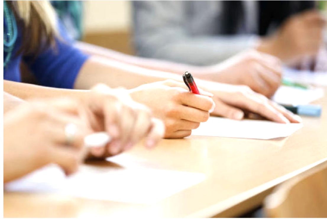
AS INSCRIÇÕES DOS CONCURSOS DAS PREFEITURAS DO MARANHÃO TERMINAM NO DIA 5 DE MARÇO

Nível Superior: Médico Plantonista Clínico Geral (24 hs) (1); Médico Plantonista Cirurgião Geral (24 hs) (1); Médico Especialista em Saúde Mental (1); Médico Pediatra (5); Médico para o PSF; Cirurgião Dentista (3); Enfermeiro (1); Farmacêutico/ Bioquímico (1); Fisioterapeuta (1); Fonoaudiólogo (1); Psicólogo (1); Nutricionista (1); Assistente Social e/ou Serviço Social; Engenheiro Elétrico; Engenheiro Civil; Arquiteto Urbanista; Químico; Médico Veterinário; Engenheiro Agrônomo e Psicopedagogo Institucional (1).