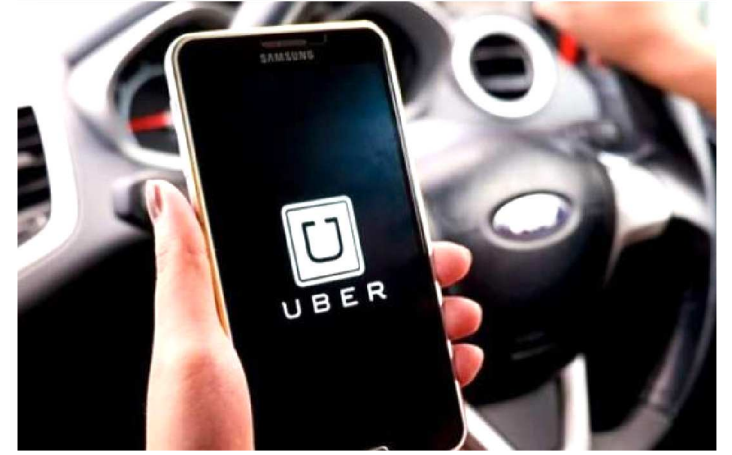
COMPARTILHAR CORRIDA NO APLICATIVO DE TRANSPORTE

As pessoas sempre fazem esquemas para prevenir de gastos extras, mas sempre burlam quando estão “altos” por conta da bebida ou alegria da festa momesca. Confira algumas dicas para economizar neste carnaval.