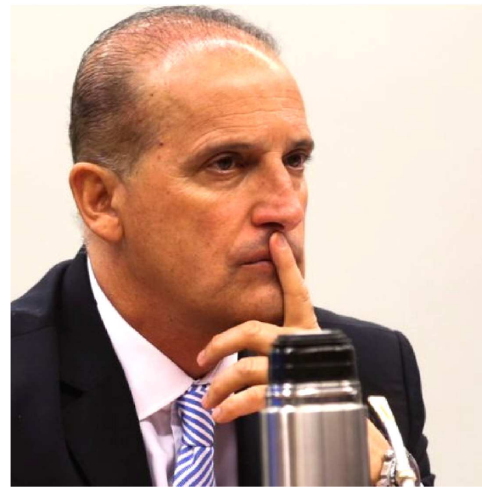
LORENZONI SERÁ INVESTIGADO

O ministro Marco Aurélio Mello, do Supremo Tribunal Federal (STF), decidiu encaminhar ao Tribunal Regional Eleitoral do Rio Grande do Sul (TRE-RS) a investigação que apura suspeitas de caixa 2 feitas por delatores da J&F ao ministro-chefe da Casa Civil, Onyx Lorenzoni. A decisão do ministro atende a pedido da procuradora-geral da República, Raquel Dodge, fundamentado a partir do novo entendimento sobre o alcance do foro privilegiado, que só deve ser aplicado para os crimes cometidos no exercício do mandato e em função do cargo. Pesam sobre Onyx o relato e planilhas dando conta de pagamentos de R$ 100 mil, em 2012, e R$ 200 mil, em 2014, quando o atual ministro concorria ao cargo de deputado federal. Onyx admitiu em entrevista a uma emissora de rádio ter recebido R$ 100 mil e pediu desculpas.