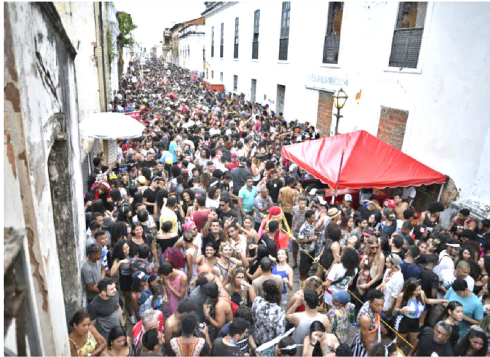
ESPECIALISTA REVELA QUE A FOLIA TORNA AS PESSOAS MAIS IMPULSIVAS E RELAXADAS