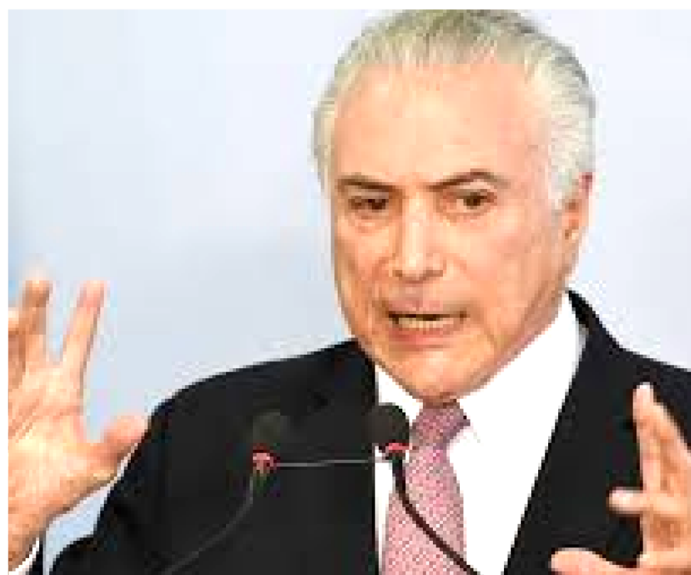
EX-PRESIDENTE MICHEL TEMER FOI CITADO NAS INVESTIGAÇÕES

O valor era referente a 5% do termo da Odebrecht com a estatal. Os políticos, no entanto, não são alvo desta ação penal, que foi denunciada à época em que ainda tinham foro privilegiado. Temer nega ter cometido irregularidades.