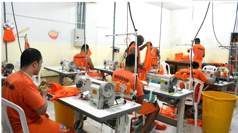
AMALHARIA ABSORVE PARTE DA MÃO DE OBRA PRISIONAL

Prática Em 2014, apenas seis oficinas de trabalho funcionavam, no sistema prisional do Maranhão. Em 2018, a gestão