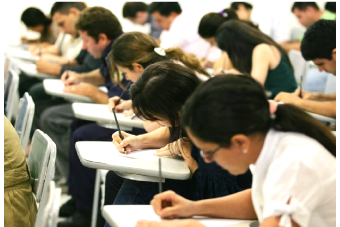
AS PROVAS DO CONCURSO PÚBLICO ESTÃO MARCADAS PARA O DIA 31 DE MARÇO DE 2019

Prefeitura Municipal de Sambaíba continua com inscrições de Concurso Público abertas. As vagas são referente a contratação de 110 profissionais de Nível Fundamental; Médio; Técnico e Superior.