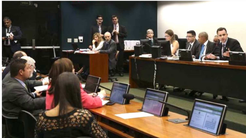
DEPUTADOS SE REUNIRÃO PARA FORMAR A COMISSÃO DE CONSTITUIÇÃO E JUSTIÇA

O grupo de 66 deputados que vão integrar a CCJ deve ser montado nesta terça-feira.