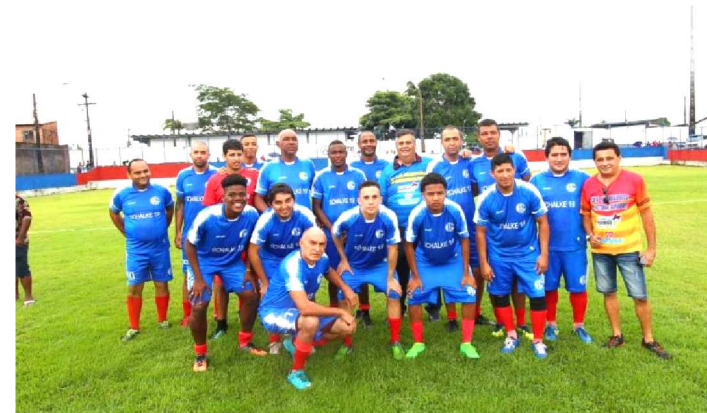
FLÁVIO DINO ENTREGA EQUIPAMENTO ESPORTIVO NO BAIRRO

O governador Flávio Dino realizou a entrega do campo do bairro Santo Antônio, em São Luís. Conhecido pela comunidade como ‘Estádio Moreirão’, a área para a prática esportiva passou por um processo de revitalização. A obra foi possível por meio da Secretaria de Estado de Esporte e Lazer (Sedel), através da Lei Estadual de Incentivo ao Esporte.