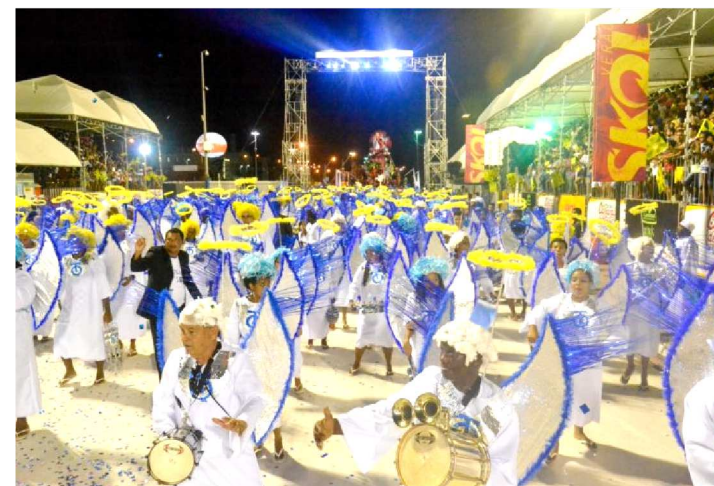
TURMA DO QUINTO VAI HOMENAGEAR CIDADE DE ALCÂNTARA

A Turma do Quinto, escola da Madre Deus, vai mostrar em 13 alas, o enredo “Alcântara Divina, o Cantar de Cantarias”, contando algumas das histórias e do rico patrimônio arquitetônico, histórico e cultural que a cidade conserva desde quando era Arraial de Tapuitapera, Arraial de São Matias, depois elevada à categoria de Vila, virou Santo Antônio de Alcântara. “Adotada por poetas e romancistas, faz da poesia seu eterno modo de vida”, diz a sinopse do enredo.