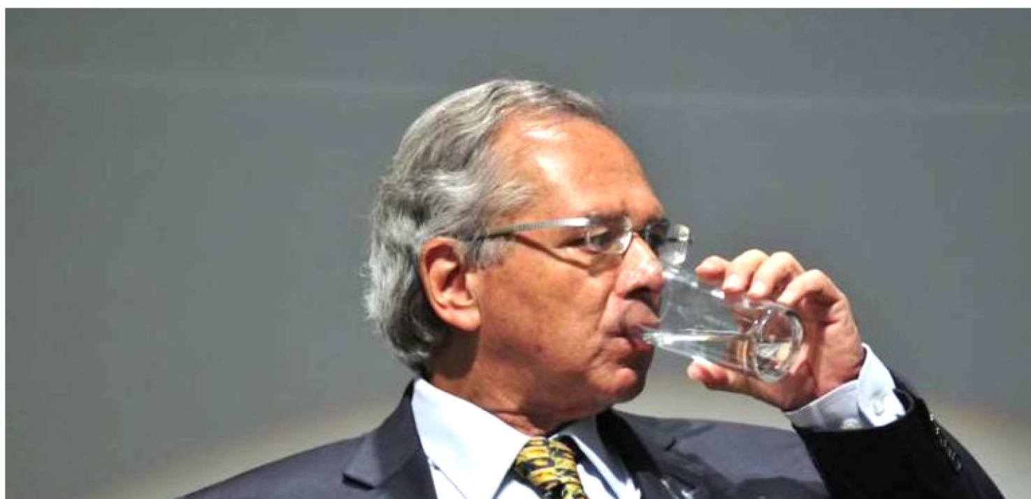
PAULO GUEDES QUER RECEBER TODAS AS DÍVIDAS

Em paralelo à tramitação da reforma da Previdência encaminhada ao Congresso na última quarta-feira, o governo federal pretende fazer um cerco aos grandes devedores do Instituto Nacional de Seguridade Social (INSS). Dentro de 30 dias, a equipe econômica promete levar um projeto de lei ao Congresso com o objetivo de combater a sonegação das contribuições previdenciárias e cobrar os grandes devedores.