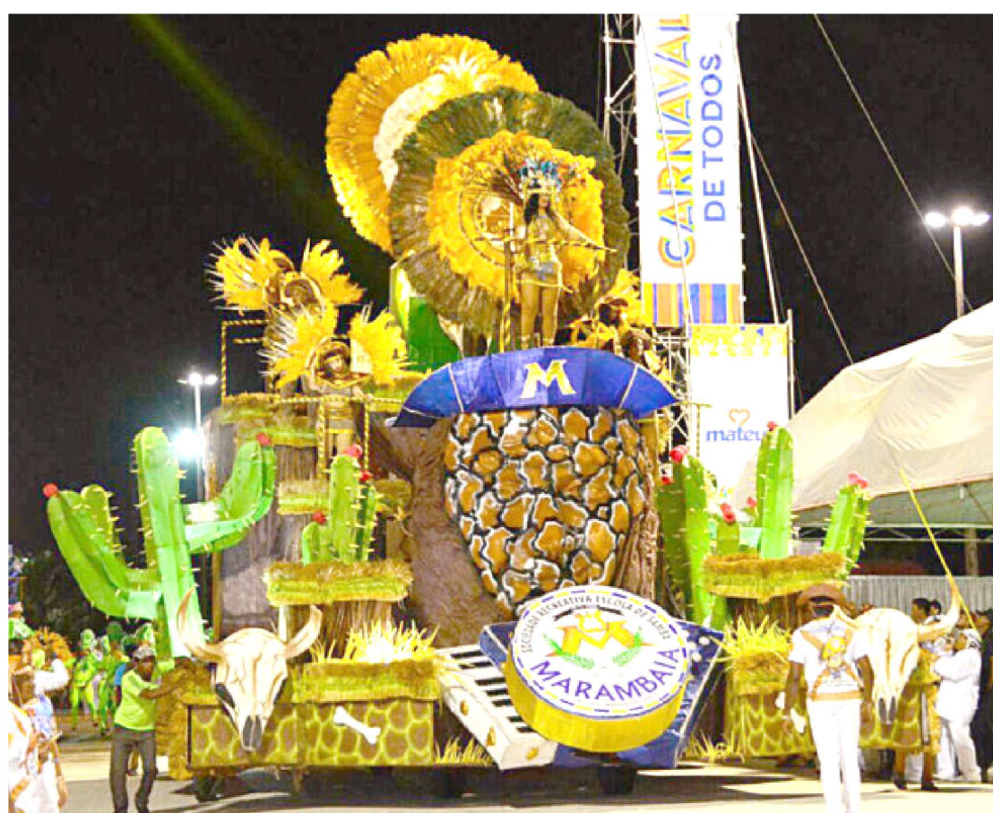
ESCOLA VAI PARA PASSARELA COM 18 ALAS, 4 CARROS ALEGÓRICOS E TEM 1.800 COMPONENTES