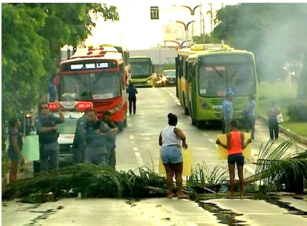
A AVENIDA CARLOS CUNHA É UMA DAS PRINCIPAIS VIAS DE ACESSO AO CENTRO DE SÃO LUÍS

Avenida Carlos Cunha, na altura do bairro Jaracati, em São Luís, amanheceu ontem, terça-feira (19), interditada. Moradores da região próxima ao São Luís Shopping paralisaram o tráfego de veículos na via, nos dois sentidos.