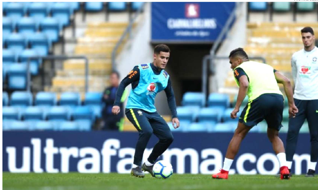
A SELEÇÃO BRASILEIRA (DE FELIPE COUTINHO E CASEMIRO) TREINOU ONTEM EM PORTUGAL

Contando com todos os 23 convocados, já que Fagner e Everton se juntaram ontem (19) ao resto do elenco do Brasil, a Seleção treinou pela segunda vez em solo português. No centro de treinamentos do Porto, o técnico Tite esboçou a escalação que deverá entrar em campo contra o Panamá.