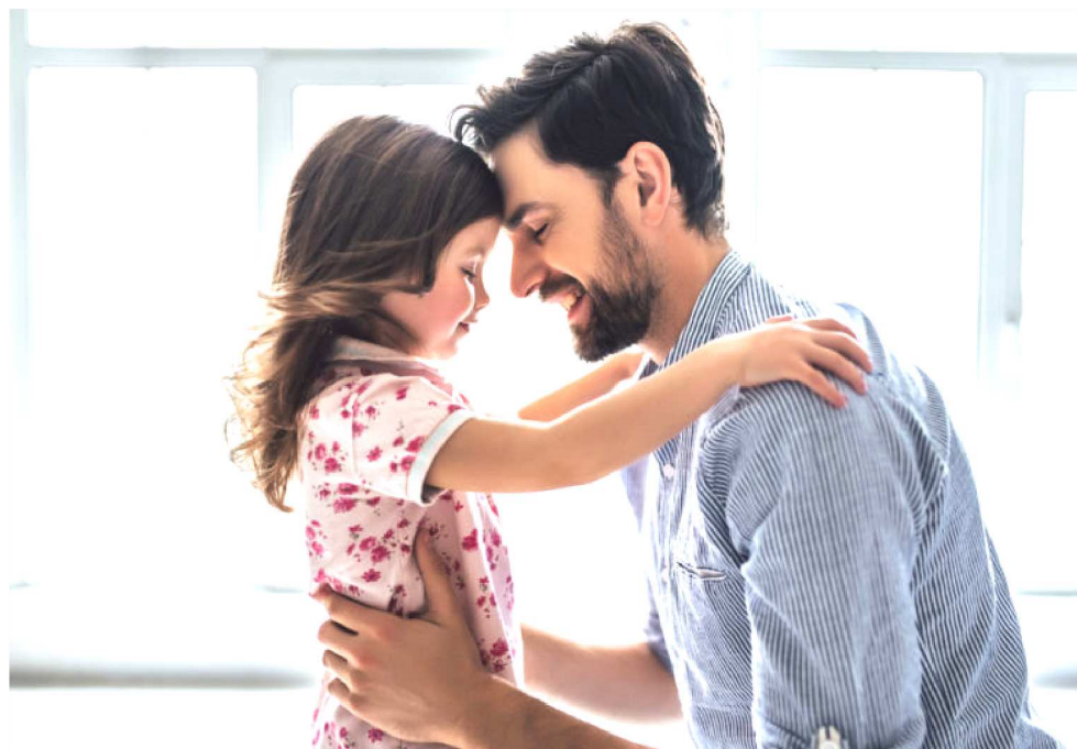
MELHOR MOMENTO PARA INFORMAR OS FILHOS É QUANDO ESTA DECISÃO ESTÁ TOMADA

A especialista lembra que a adaptação do discurso para a realidade dos pequenos e a sinceridade são pontos que devem ser levados em conta. “Po-