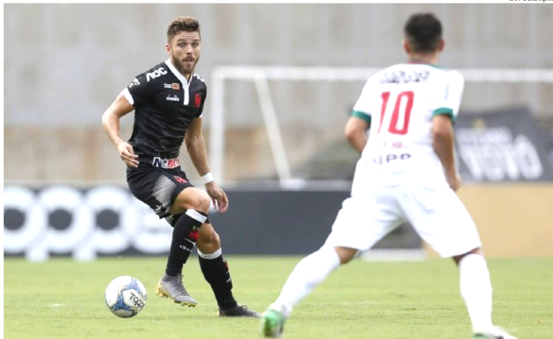
DEPOIS DE PERDER INVENCIBILIDADE, VASCO LEVA A SÉRIO O JOGO DE HOJE CONTRA O RESENDE

Nesta semana, um dos focos dos campeonatos estaduais está no Vasco da Gama. Todo mundo quer saber como o Gigante da Colina irá se portar após a perda da invencibilidade de 13 jogos – 10 resultados positivos e 3 empates. Levanta a poeira e segue forte ou acusa o golpe? O treinador Alberto Valentim vem sofrendo pressão. Apesar do momento de instabilidade, o favoritismo continua com os vascaínos.