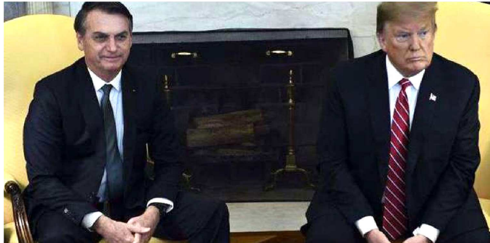
PRESIDENTES BOLSONARO E DONALD TRUMP MOMENTOS ANTES DAS DISCUSSÕES

Trump voltou a dizer que o apoio do Brasil está em discussão e que “todas as opções estão abertas”, não descartando a possibilidade de uma ação militar no país venezuelano.