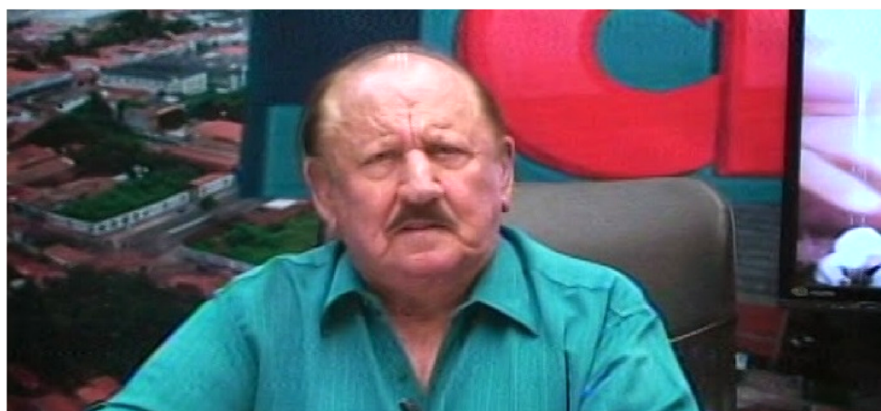
O DEPUTADO ZÉ-VIEIRA FALECEU NA TARDE DE ONTEM, AOS 85 ANOS

Vieira foi eleito prefeito em Bacabal em 2016, mas acabou afastado do cargo pelo TSE em junho de 2018 e foi determinada a realização de novas eleições cujo vencedor foi Edvan Brandão (PSC).