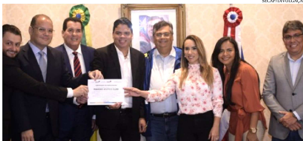
GOVERNADOR FLÁVIO DINO (CENTRO) AUTORIZOU ENTREGA DO CERTIFICADO DE APOIO