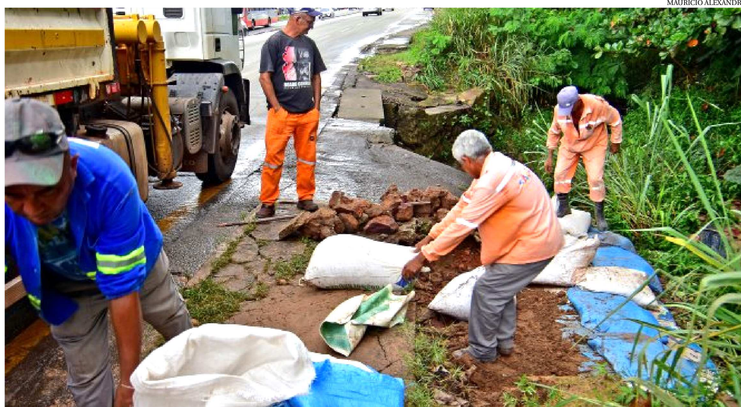
TRABALHANDO INTENSAMENTE PARA REPARAR OS DANOS E AMENIZAR OS TRANSTORNOS CAUSADOS PELAS CHUVAS NA CAPITAL

A Prefeitura de São Luís está trabalhando intensamente para reparar os danos e amenizar os transtornos causados pelas fortes chuvas na capital. Com isso, a Secretaria Municipal de Obras e Serviços Públicos (Semosp) vem intensificando os trabalhos como a manutenção na rede de drenagem com limpeza de canais, bueiros e galerias, contenção de erosão e manutenção asfáltica em pontos estratégicos da cidade. As ações são rotineiras, mas foram intensificadas seguindo orientação do prefeito Edivaldo Holanda Júnior que montou uma força-tarefa composta por diversas secretarias. As chuvas continuam caindo forte em São Luís. O acumulado do mês de março já atingiu 681,3 mm, quase 60% do previsto – 428 mm. E a previsão é de mais chuva para abril.