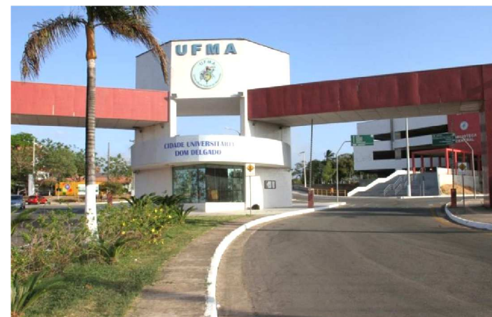
O ENCONTRO SERÁ NO CENTRO PEDAGÓGICO PAULO FREIRE

No dia 28 de março, das 18h30, às 21 horas, ocorrerá a roda de conversa "Diálogos Diaspóricos: relatos de experiências acadêmicas, política e cultural de pesquisadores africanos no Brasil e pesquisadores brasileiros em Cabo Verde, na Universidade Federal do Maranhão. O encontro será realizado no auditório do Centro Pedagógico Paulo Freire, 3º andar – Asa Sul 307/308, onde será possível fazer a inscrição a partir das 17 horas.