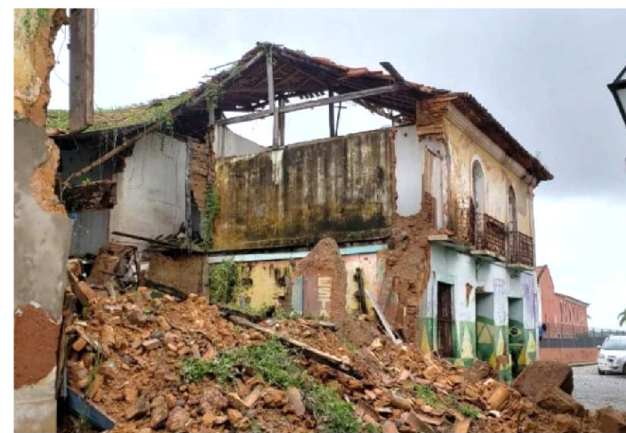
93% DESTES IMÓVEIS SÃO DE PROPRIEDADE PARTICULAR

As fortes chuvas do último fim de semana trouxeram grandes consequências para a estrutura da cidade. Dentre alagamentos e deslizamentos, um casarão não resistiu e desabou. Segundo a Defesa Civil, além dele, outros 22 casarões do Centro Histórico de São Luís correm risco de desmoronar.