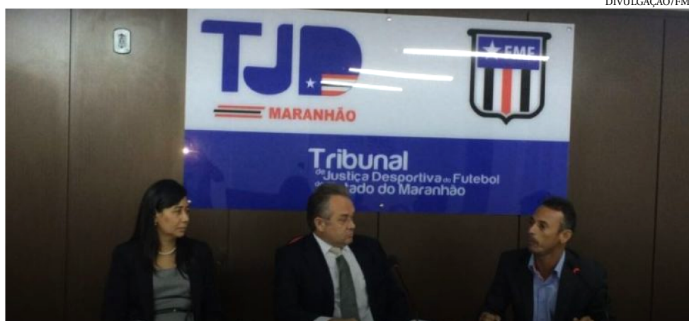
TRIBUNAL DECIDIU SUSPENDER EQUIPES QUE NÃO PAGAM SUAS DÍVIDAS

Em princípio, os clubes reagiram e quase todos negaram que tivessem conhecimento de suas dívidas, sob o argumento de que não foram notificados. Tal justificativa, porém, não tem legitimidade, porque as dívidas passam a ser conhecidas oficialmente pelas partes a partir dos julgamentos de cada processo na primeira instância.