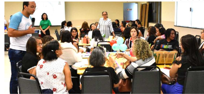
NO JARDIM RENASCENÇA, FORAM REUNIDOS 400 EDUCADORES