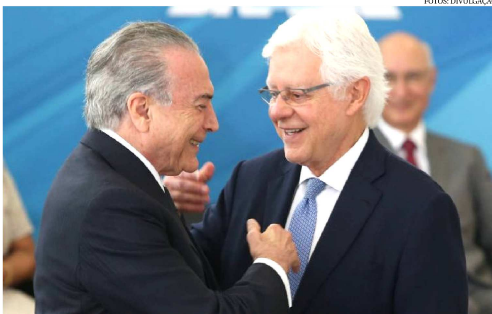
TEMER E MOREIRA SORRIDENTES. SE DEPENDER DO MPF, ELES NÃO FICARÃO IMPUNES