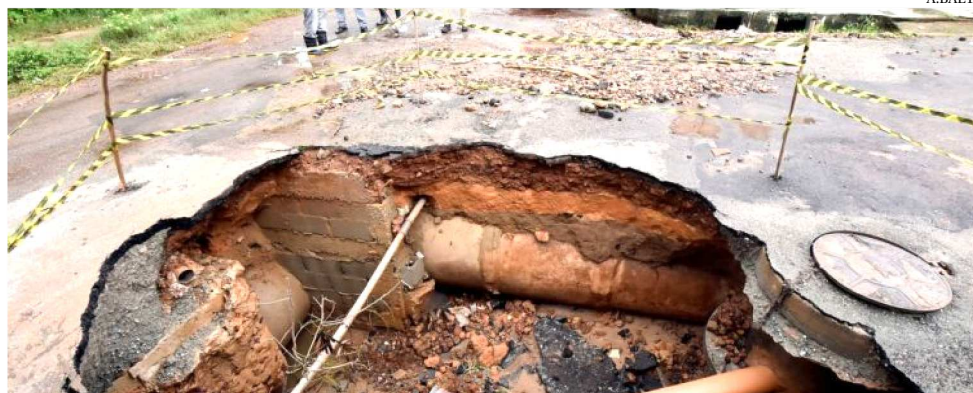
CRATERAS DEIXAM AS RUAS DA CIDADE TOTALMENTE DANIFICADAS PELAS ÁGUAS

Em locais como a Estrada da Vitória, no Sacavém e bairros como Vila Isabel Cafeteira e Coroadinho, equipes da Defesa Civil estiveram instala-