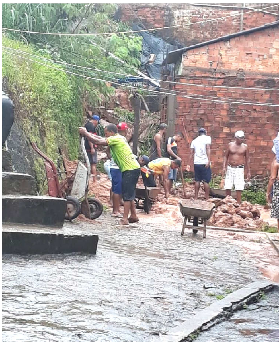
VÁRIAS FAMÍLIAS TIVERAM GRANDES PERDAS E ESTÃO RECEBENDO AJUDA DE OUTROS