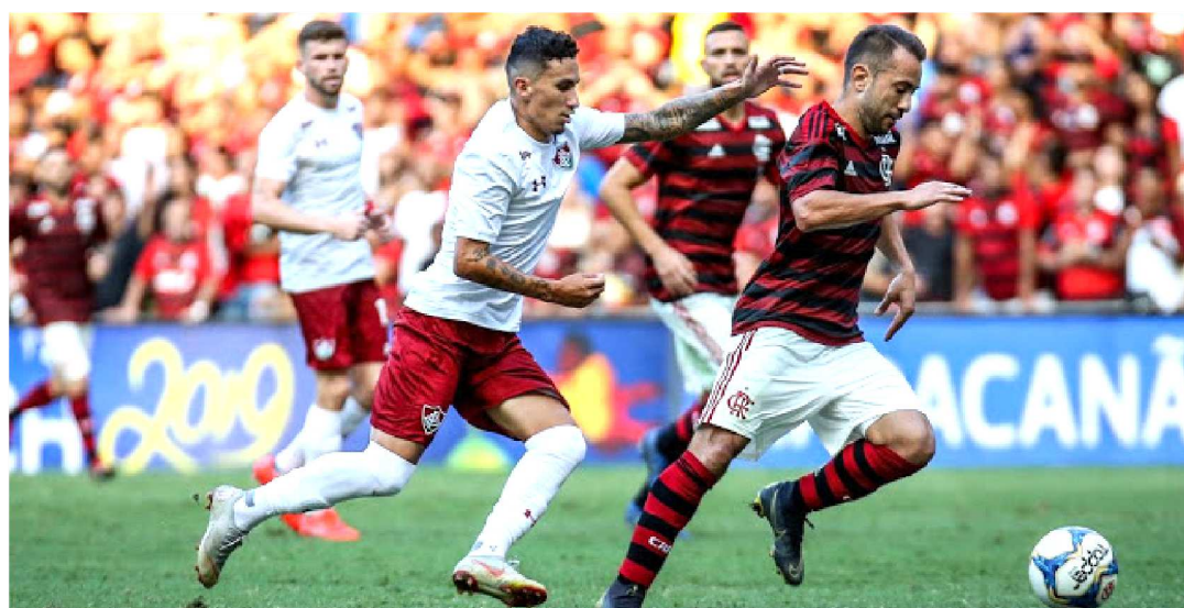
FLAMENGO FLUMINENSE VOLTAM A SE ENFRENTAR ESTA NOITE EM JOGO VÁLIDO PELA TAÇA RIO

A reedição da semifinal do primeiro turno do Campeonato Carioca, a Taça Guanabara. Fluminense vai receber o Flamengo hoje (27), às 21h30, no Estádio Maracanã, no Rio de Janeiro (RJ). O jogo único será válido pela semifinal da Taça Rio.