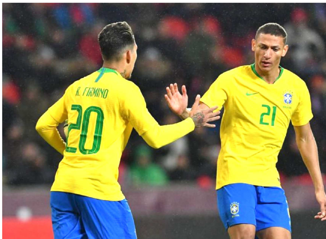
FIRMINO E RICARLISON VIBRAM COM A VIRADA DO BRASIL EM CIMA DA REPÚBLICA TCHECA

O Brasil levou um susto, mas virou em cima da República Tcheca em Praga e venceu por 3 a 1 o último amistoso antes da convocação para a Copa América 2019. Roberto Firmino e Gabriel Jesus (duas vezes) fizeram os gols da vitória.