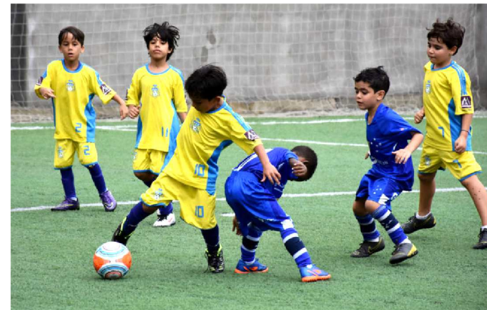
MENINADA TEM MARCADO MUITOS GOLS NO FUTEBOL 7

A bola começou a rolar pelo Campeonato Maranhense de Futebol 7 no último fim de semana. Promovido pela Federação Maranhense de Futebol 7 (FME7), o torneio conta com a participação de 40 equipes, distribuídas em três categorias (Sub-7, Sub-9 e Sub-11). Na rodada de abertura, dos 12 jogos programados, apenas oito foram realizados no campo do A&D Eventos, no Turu. As fortes chuvas que atingiram São Luís no domingo (24) adiaram quatro confrontos. Mesmo assim, a média de gols do fim de semana foi muito bom: 2,6 gols por jogo.