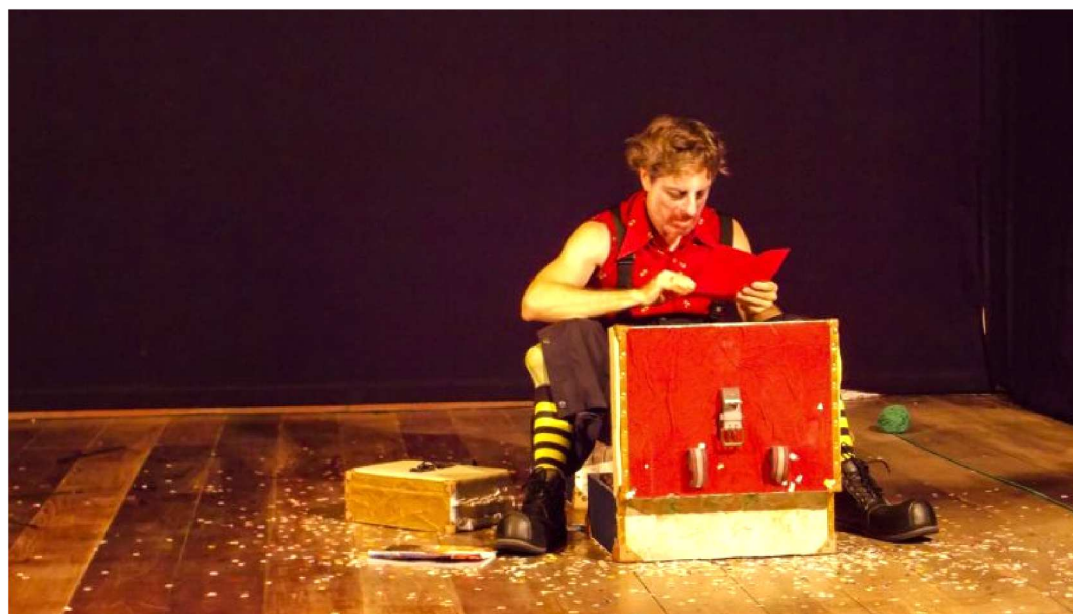
PEQUENA COMPANHIA DE TEATRO SOBE AO PALCO COM O ESPETÁCULO-SOLO EXTRATO DE NÓS

O Dia Mundial do Teatro é comemorado nesta quarta-feira, dia 27 de março. Estabelecido no cenário cultural maranhense como um dos principais apoiadores e precursores das artes cênicas, o Sesc presta a sua homenagem aos profissionais apresentando o público com espetáculos gratuitos no Teatro Napoleão Ewerton, localizado na Avenida dos Holandeses, desde o dia 21 de março. A mostra encerra na data dedicada às artes cênicas com a apresentação infantil "Popotitodó" (Grupo TeatroDança) para os alunos da educação infantil do Sesc e o teatral adulto intitulado "Quase (Al Danuzio), aberto ao público.