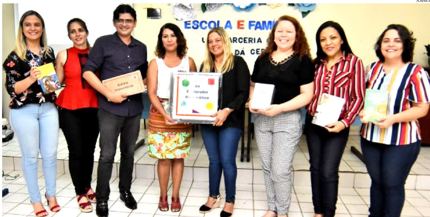
A SOLENIDADE DE ENTREGA DO KIT FOI NA QUARTA-FEIRA (27), NA UNIDADE DE EDUCAÇÃO BÁSICA (U.E.B.) LUÍS VIANA, NA ALEMANHA

Educadores da rede municipal de ensino da Prefeitura de São Luís foram contemplados com kits pedagógicos do programa Protegendo Sonhos. A iniciativa é resultado de parceria entre a Prefeitura e a Fundação Abrinq pelos Direitos da Criança e do Adolescente com fins a oportunizar formação aos professores e estimular o aprendizado dos estudantes. O programa contribuirá com a qualificação da leitura, escrita e matemática em escolas municipais de Ensino Fundamental do 6º ao 9º anos. O kit contém itens diversos – DVDs, livros e jogos – que serão utilizados em recursos pelos educadores para melhoramento das práticas e metodologias utilizadas em sala de aula com os alunos.